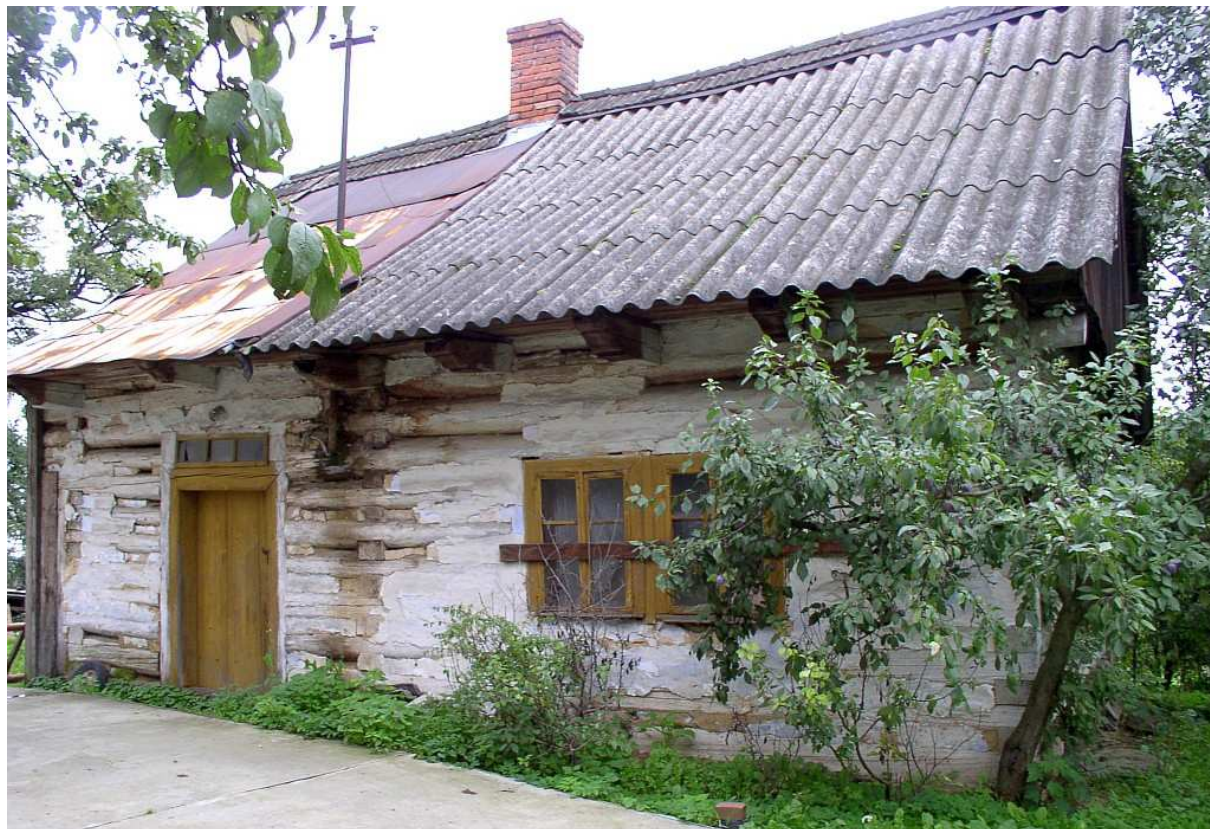
Fot. nr 34. Oryginalna fasada chałupki, gdzie nadal egzystują wiekowe okienka.