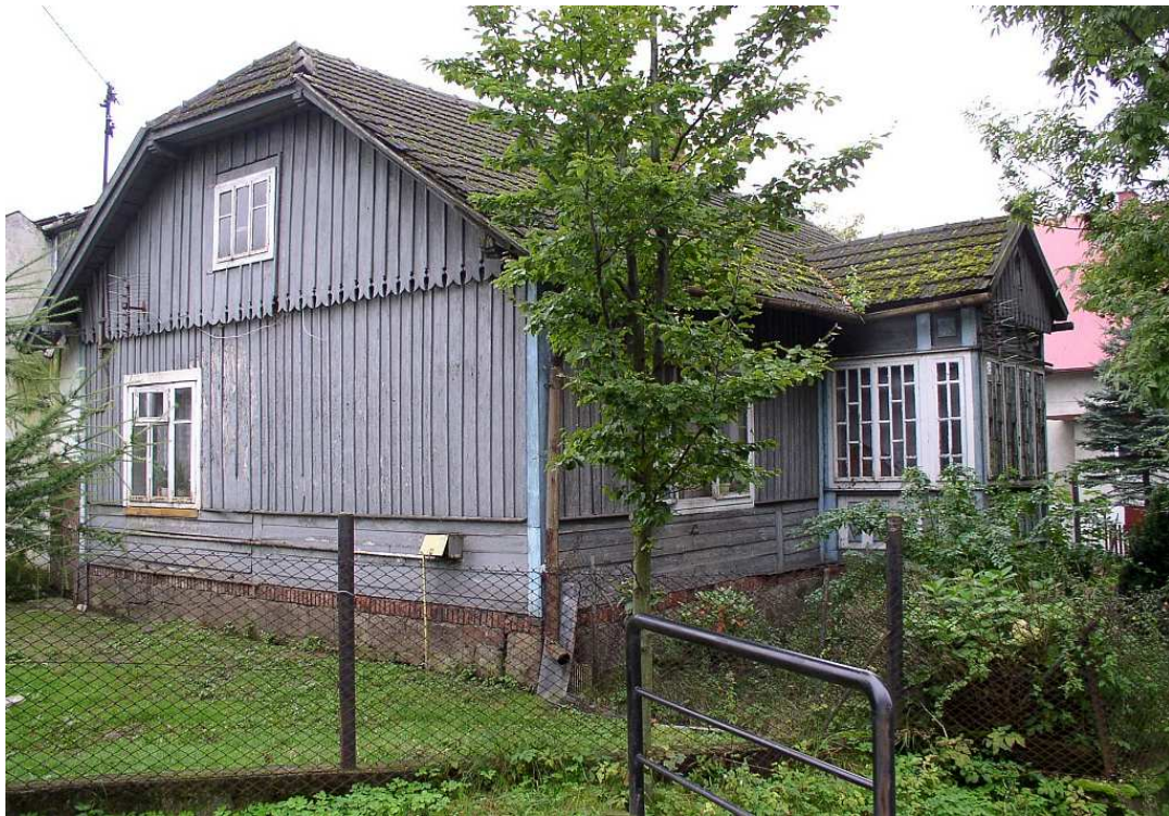
Fot. nr 53. Lewy narożnik. Boazeria zapewne oryginalna.