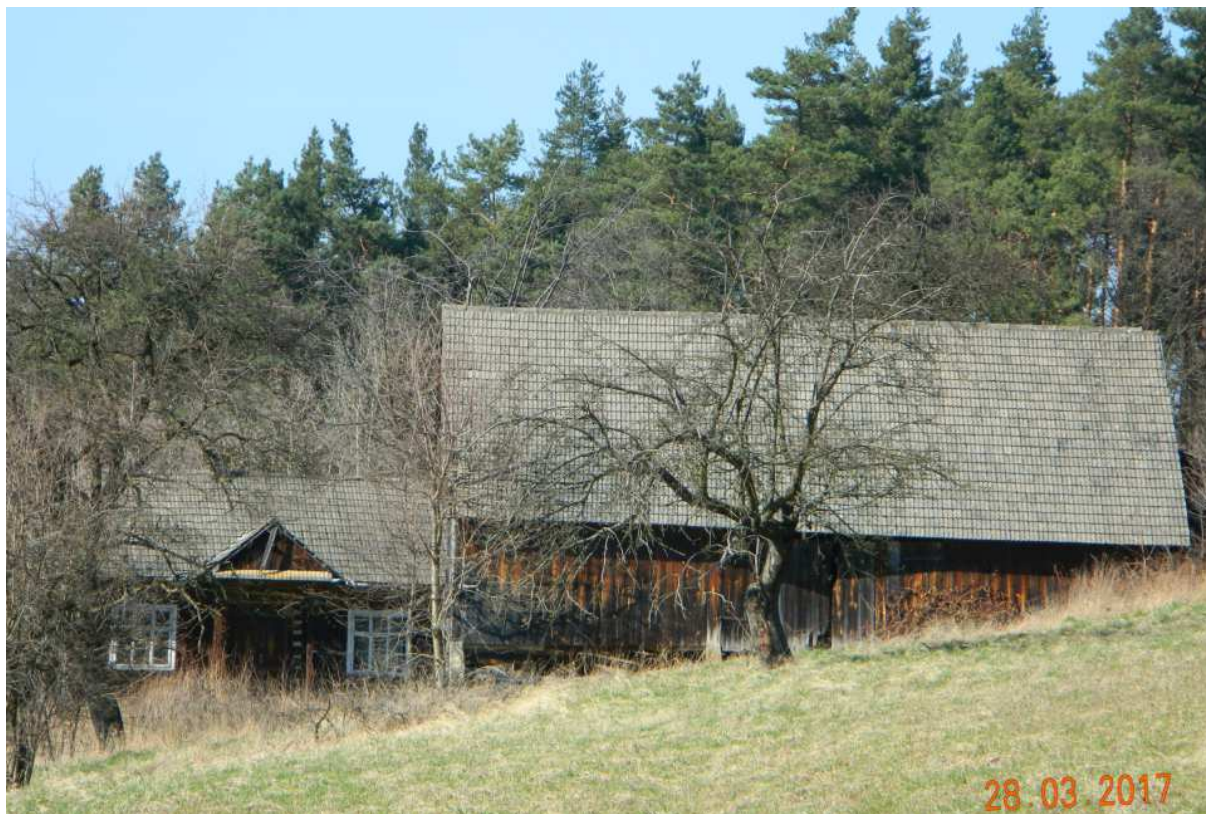
Fot. nr 100.