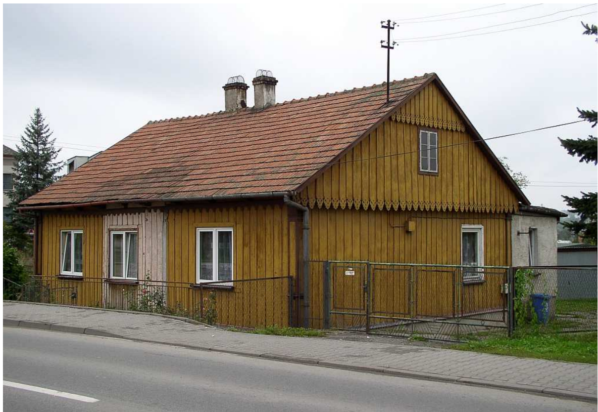
Fot. nr 9. Boazeria, która wydaje się być oryginalną.