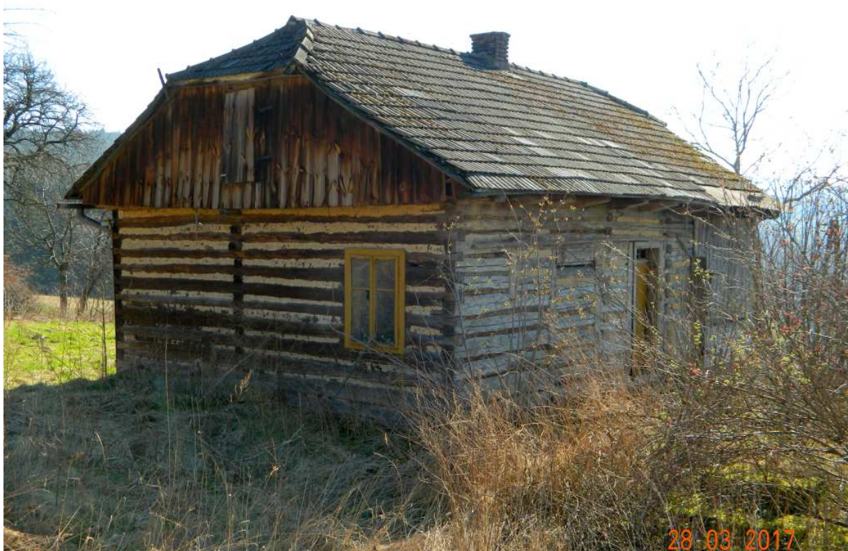
Fot. nr 109.