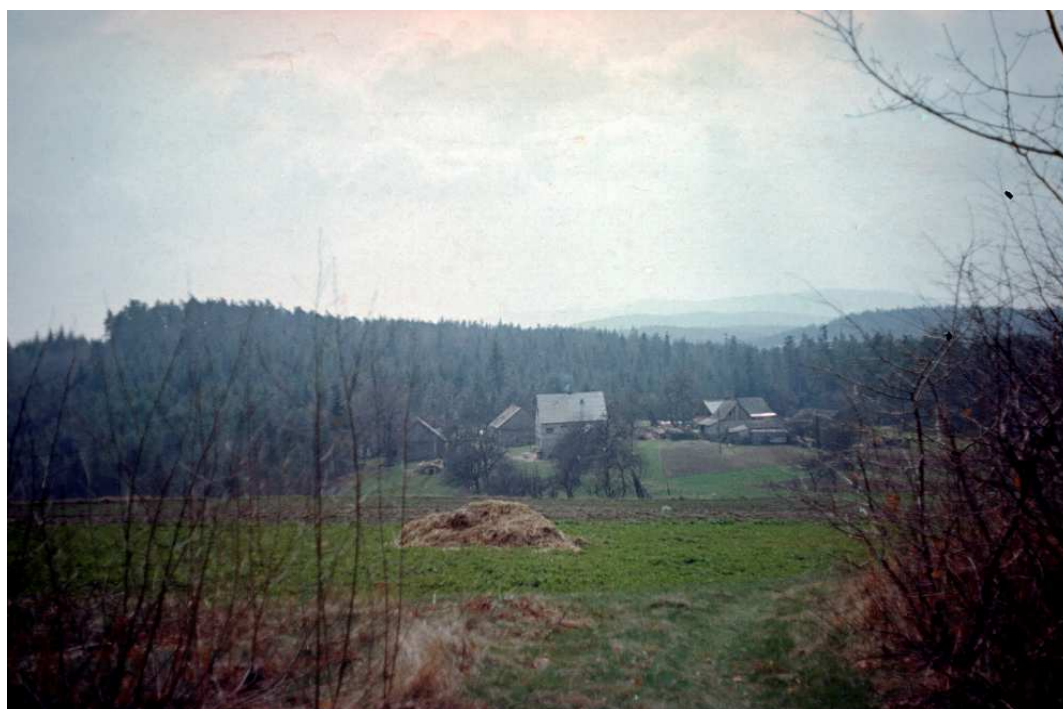
Fot. nr 77. (Wiosna 1992).