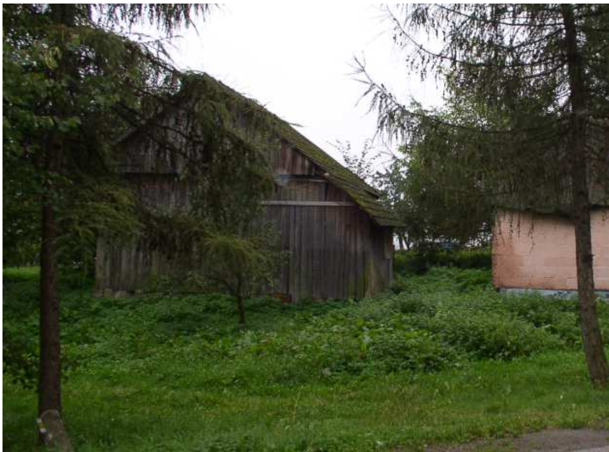
Fot. nr 38. Stara stodoła – element wiejskiej zagrody – widok z ulicy.