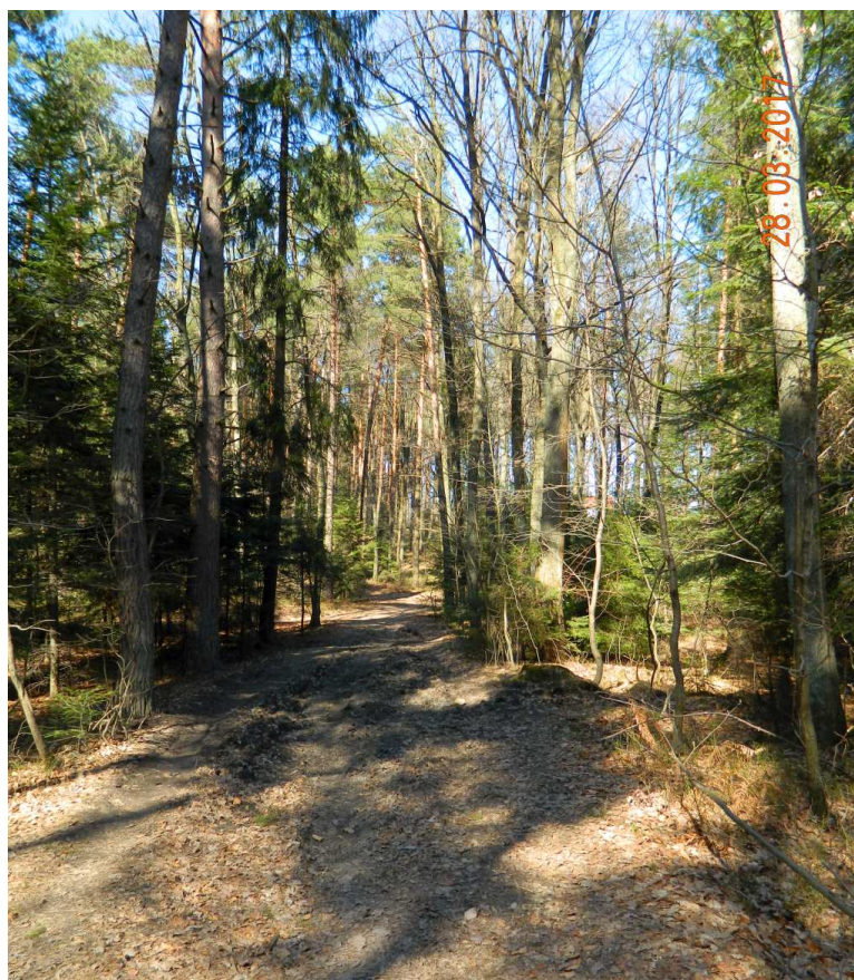
Fot. nr 89. Dukt leśny wiodący w kierunku przysiółka Syberia.