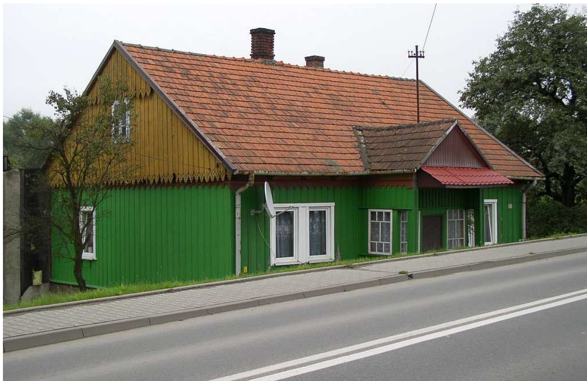
Fot. nr 14. Fasada budynku z ciągle oryginalnym, przeszklonym gankiem.