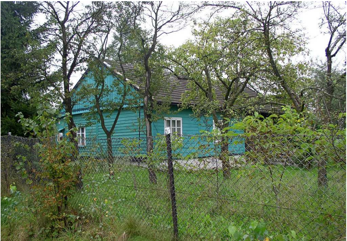
Fot. nr 55. Sielski krajobraz dawnej podkrakowskiej wsi.