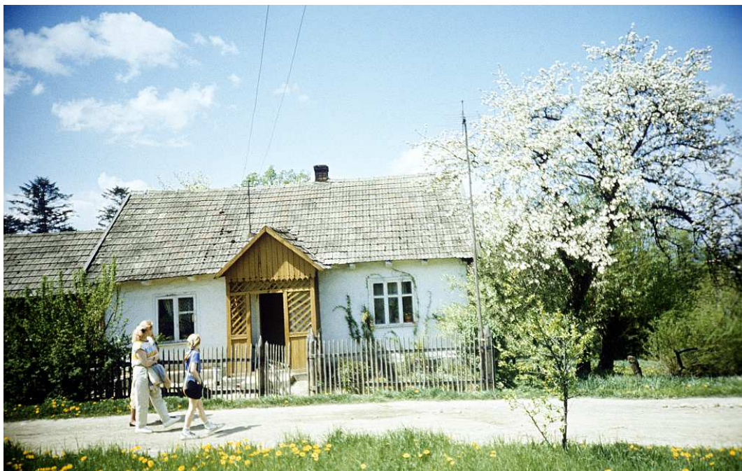
Fot. nr 68 (68-71). Wiejska chałupa pod nr 78(??) - wiosna 1991.