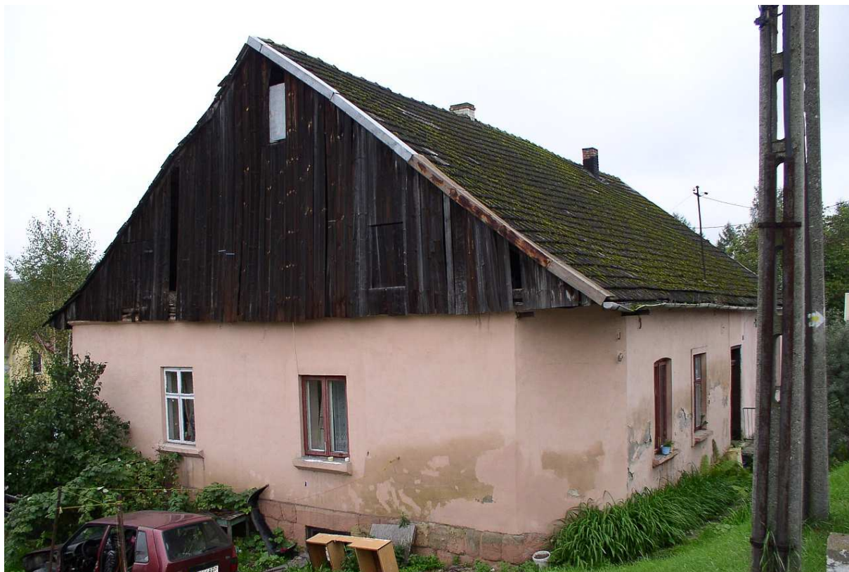
Fot. nr 18 (18-20). Przedwojenny, murowany budynek mieszkalny z sąsiedztwa mostu.