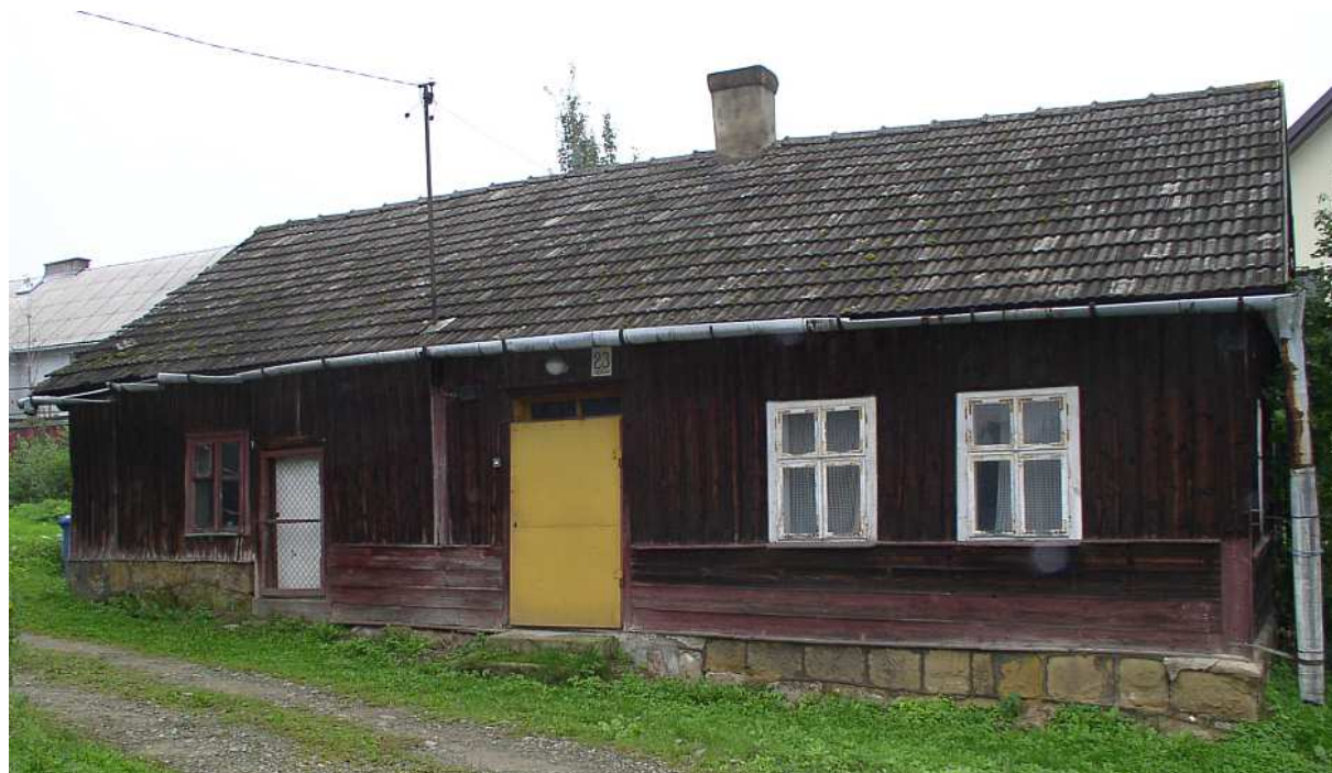
Fot. nr 23. Interesujący przykład przedwojennego świata przedpola Dobczyc.