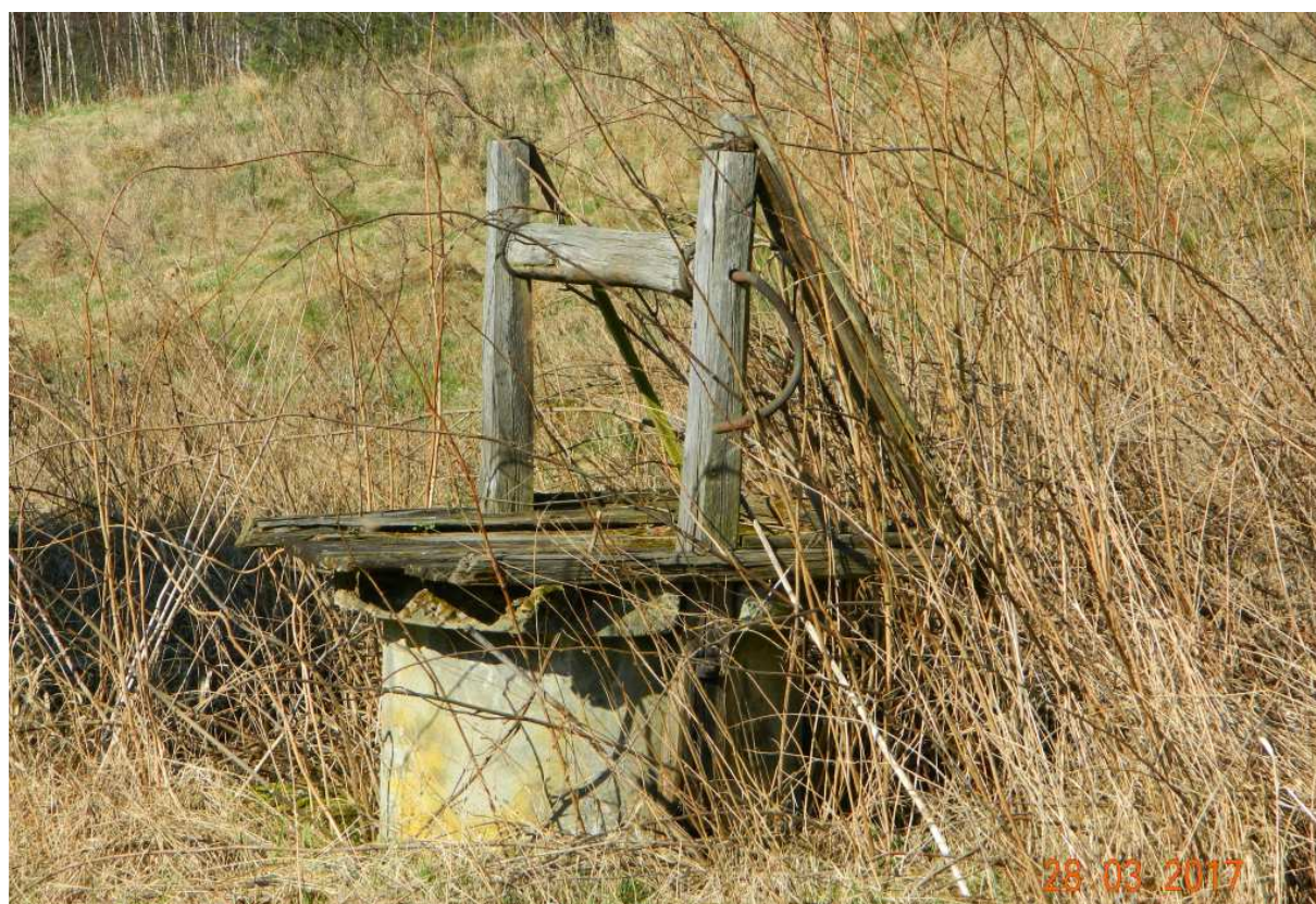
Fot. nr 111. Resztki dawnej studni.