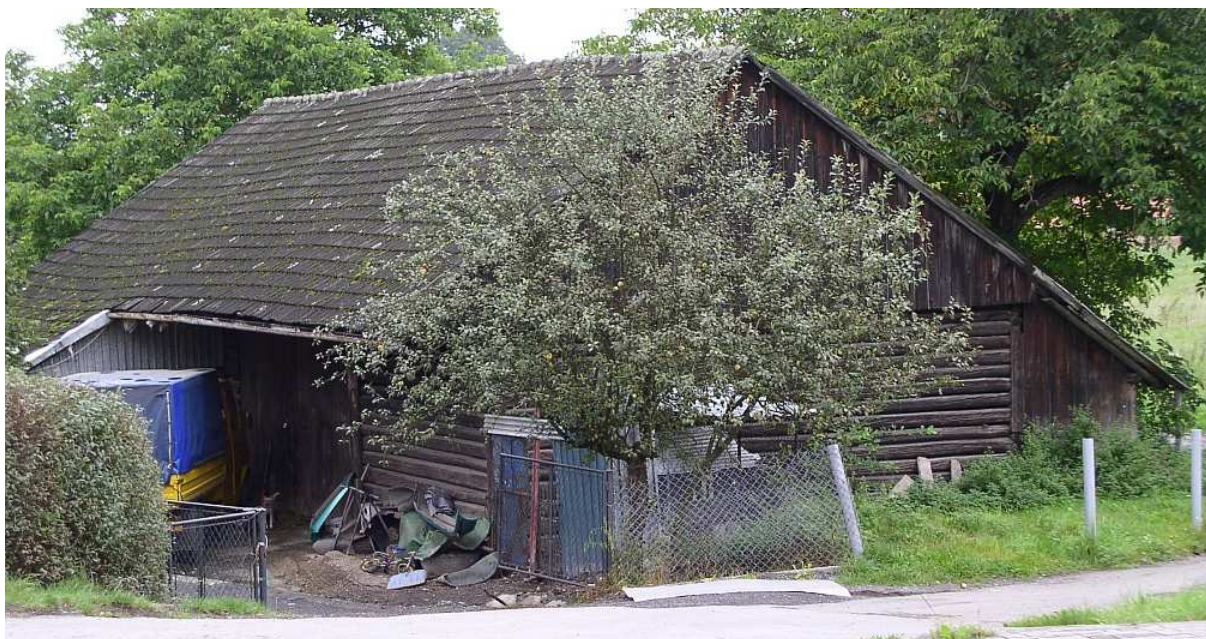
Fot. nr 17. Stodoła typowa dla lat przedwojennych i jeszcze wcześniejszych – uwagę zwraca poprzecznie belkowana faktura uszczelniana słomianymi warkoczami.