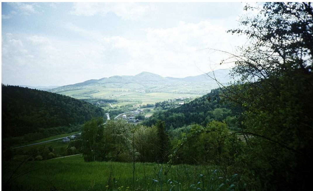
Fot. nr 82 (82-84). Ujęcia ponad Czaławiem w stronę Grodziska i Ciecienia (z prawej w tle) - (wiosna 1991).