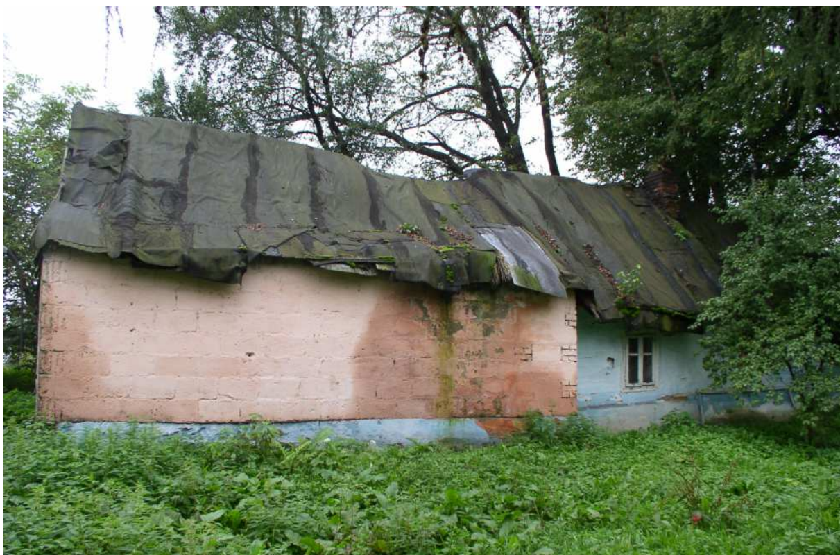
Fot. nr 39. Archaiczny kompleks mieszkalno-gospodarczy z oryginalną częścią mieszkalną z prawej strony.