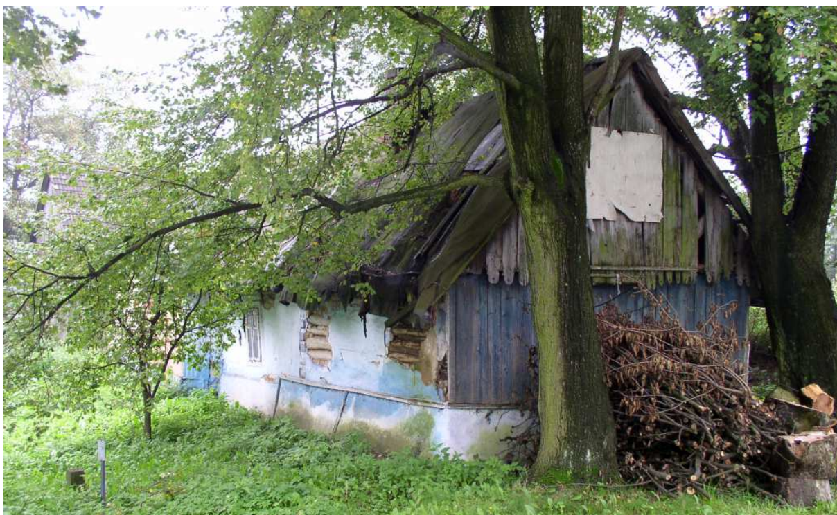
Fot. nr 41. Widok na opuszczoną część mieszkalną, jeszcze do niedawna pieczołowicie bieloną.