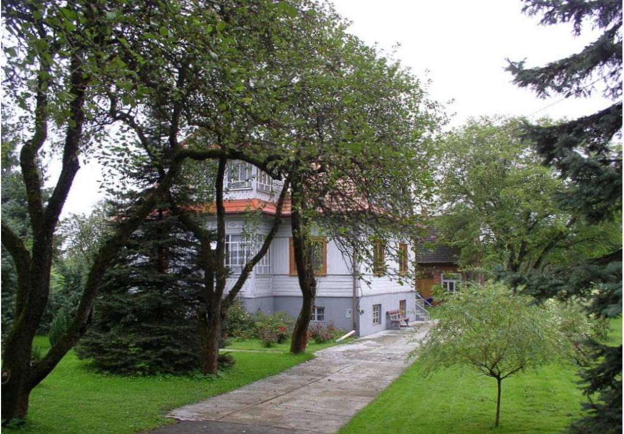
Fot. nr 10 (10-11). Przedwojenna willa z ulicy Mostowej (nr 3a) z efektownym, ciągle oryginalnym gankiem.