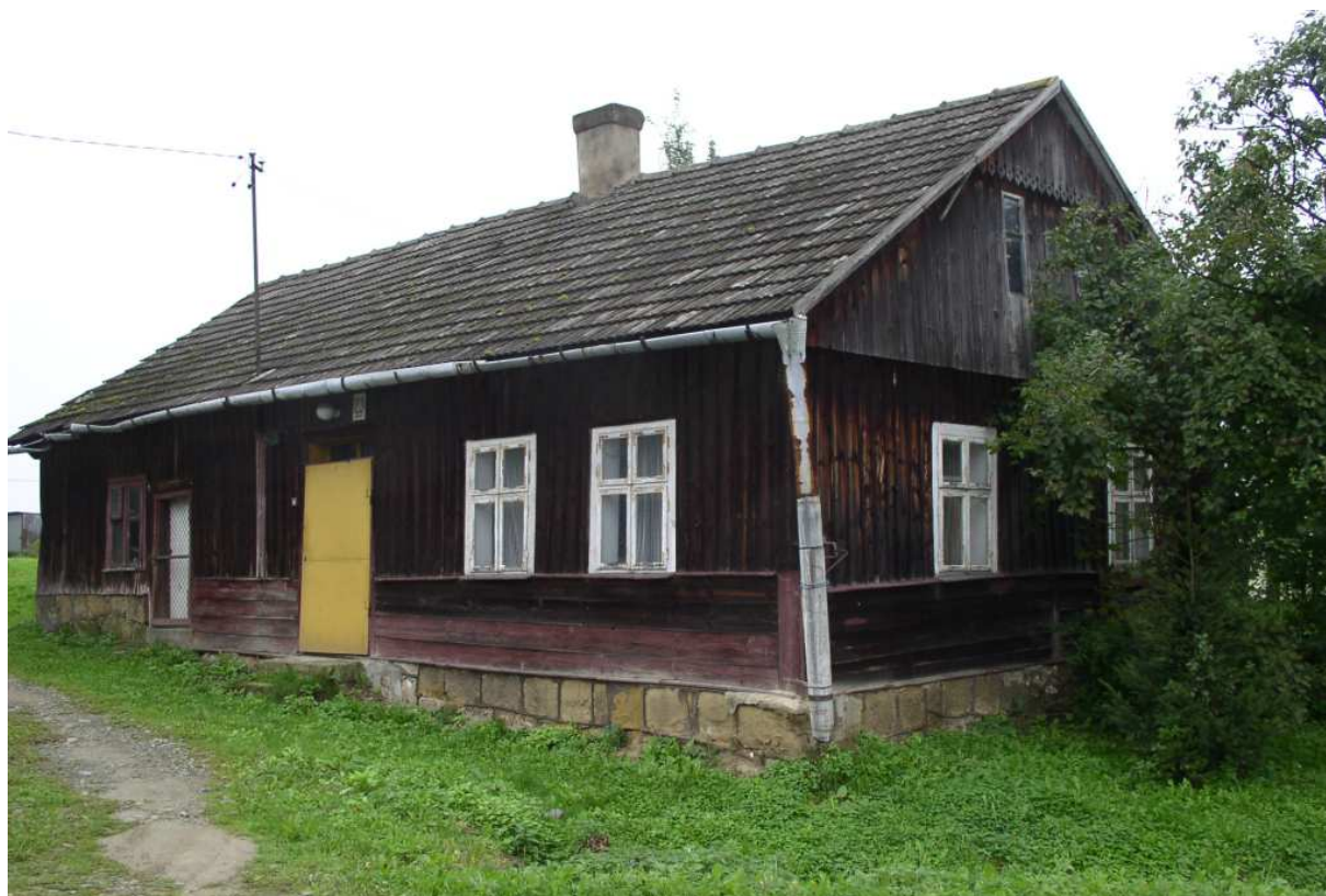
Fot. nr 22 (22-24). Oryginalny, przedwojenny dom mieszkalny z ulicy Górskiej (?) 23, który najprawdopodobniej już nie istnieje.