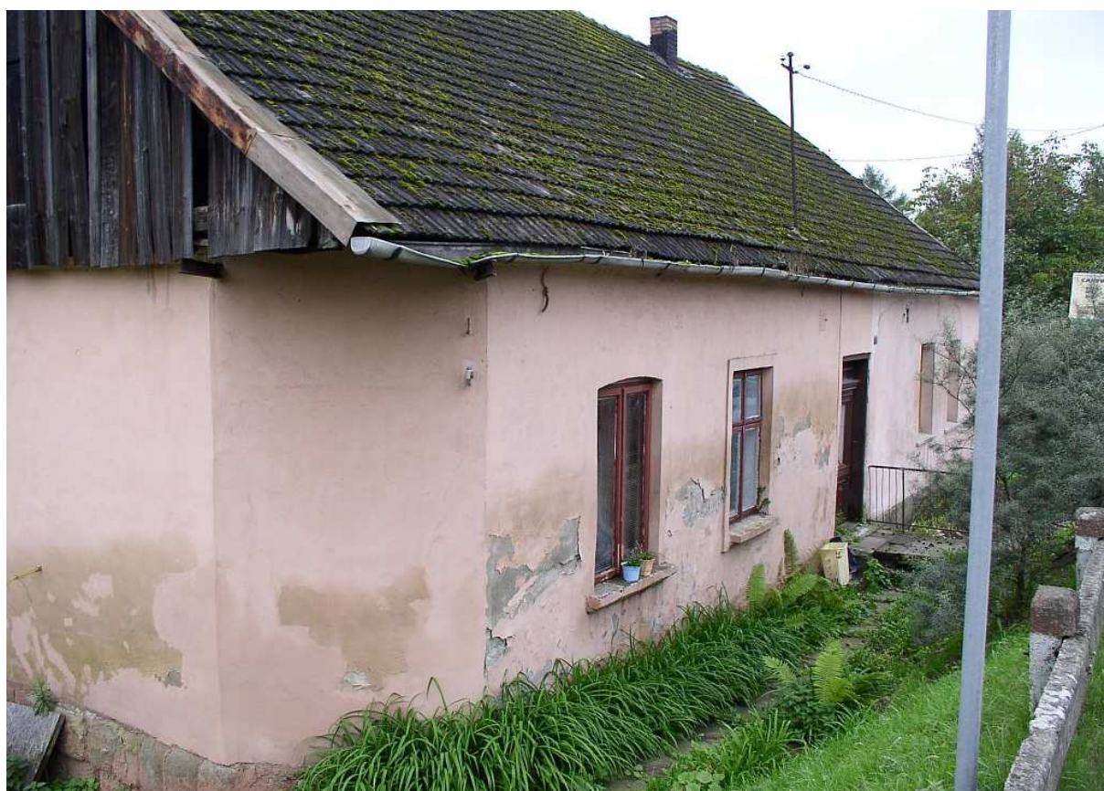
Fot. nr 19. Zmieniona już nieco fasada budynku z początku ulicy Mostowej (nr 2).