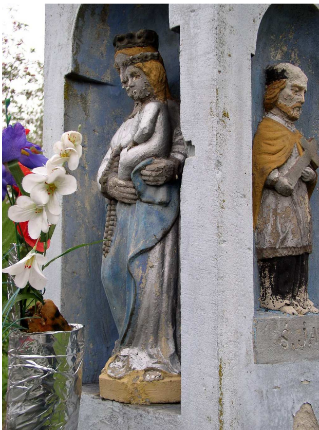
Fot. nr 26. Figury: Matki Boskiej z Dzieciątkiem z lica i św. Jana z niszy prawego boku.