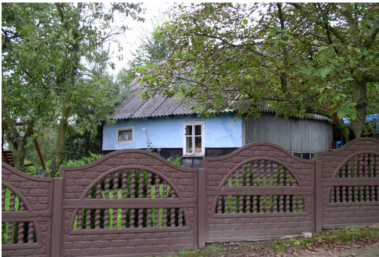
Fot. nr 31 (31-32). Wiekowa chatka: bielona i z oryginalnym oknem, usytuowana na pograniczu ulic: Górskiej i Dębowej (nr 26).