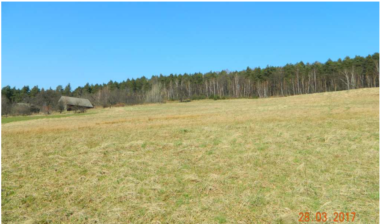
Fot. nr 95. Pola uprawne Syberii i jedyny tu dom pod nr 10, niestety od kilku lat pusty.