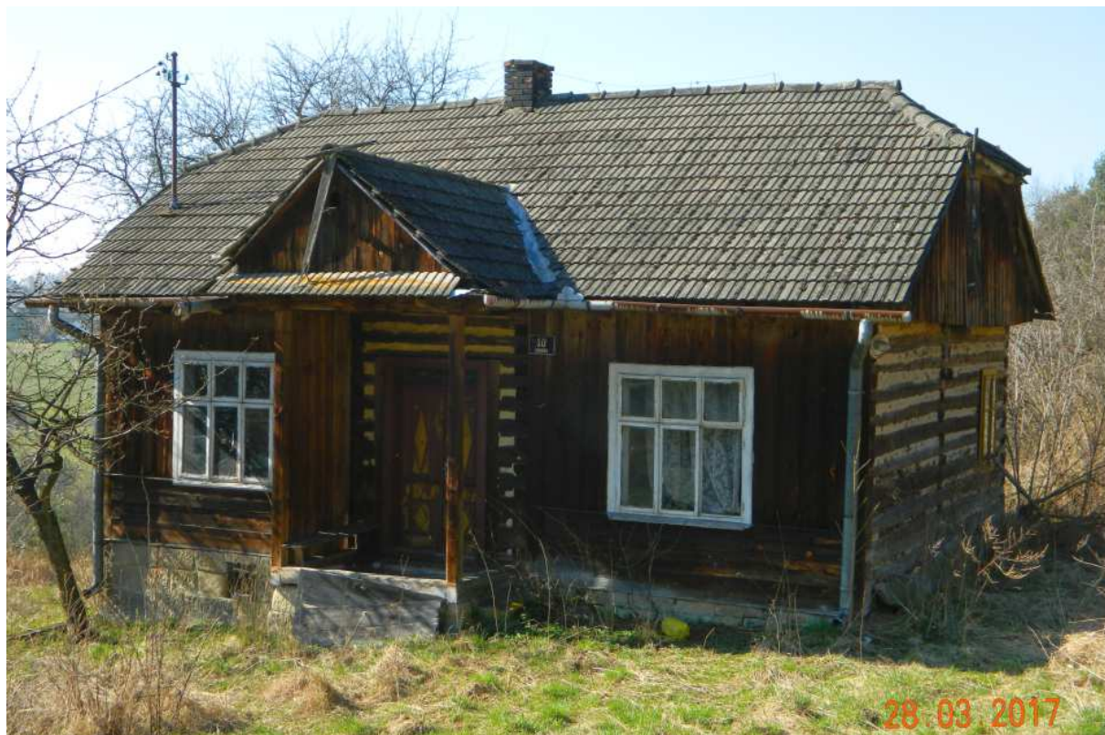
Fot. nr 102 (102-103). Portyk i stylowe drzwi.