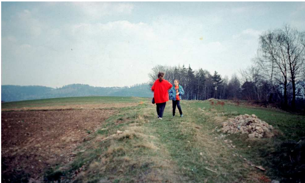
Fot. nr 80 (80-81). Droga polna ku wzgórzu nad drogą wiodącą z Dobczyc do Wiśniowej i Raciechowic przez rozległą wieś Czaśław (wiosna 1992).