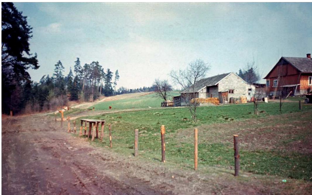
Fot. nr 72. Sielski krajobraz Zalesia (wiosna 1992).