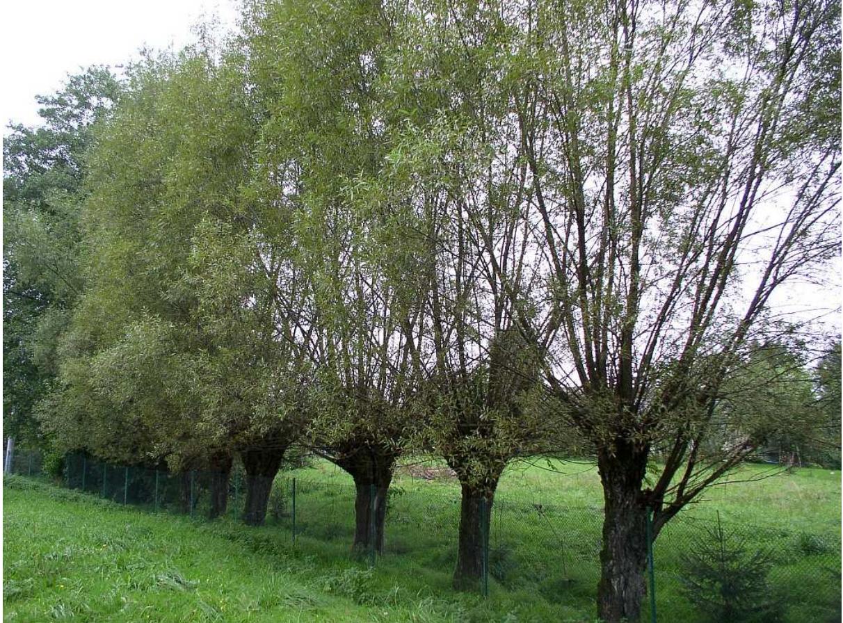
Fot. nr 5. Krajobraz nizinnej części Kornatki, typowy dla dawnej polskiej wsi.

Pełny zestaw wykonanych przeze mnie zdjęć, fragmentami dość szczegółowych, bo uważam, że warto przyrzeć się z bliska wielu dawnym detalom, został zamieszczony w rozdziałach: I-III opracowania.