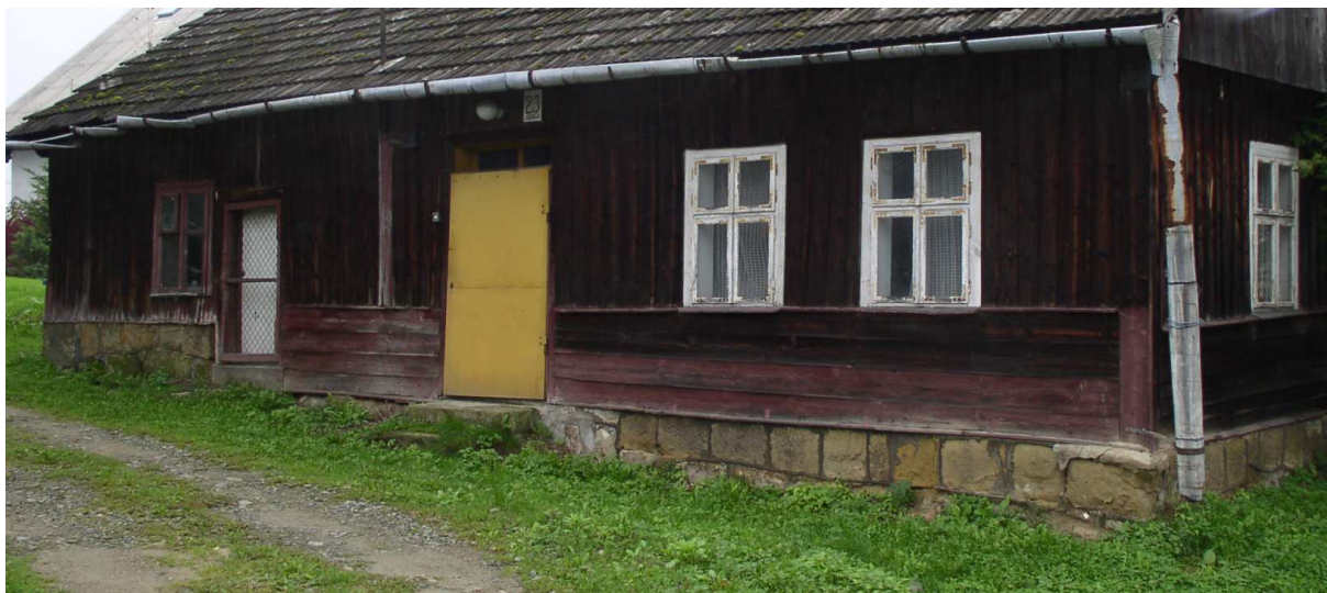
Fot. nr 24. Detale fasady z oryginalną stolarką okienną sprzed wielu dekad.