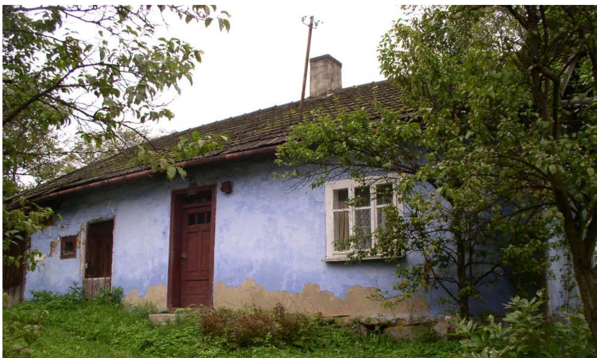
Fot. nr 45. Ciągłe oryginalna fasada chałupy z przedsionka Dobczyc, na której ciągle znać pozostałości tradycyjnego bielenia z dodatkiem siwki.