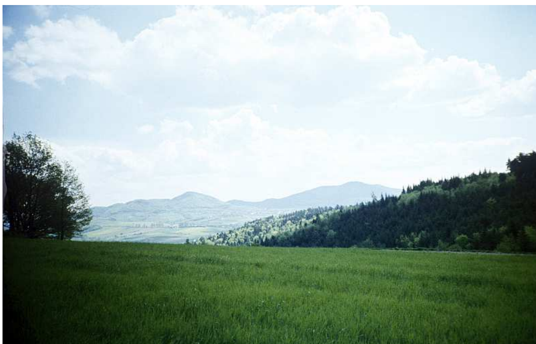
Fot. nr 61. Ponad Kornatką i Czaślawiem Myto w stronę Grodziska i Ciecienia (w tle po prawej) - (wiosna 1991).