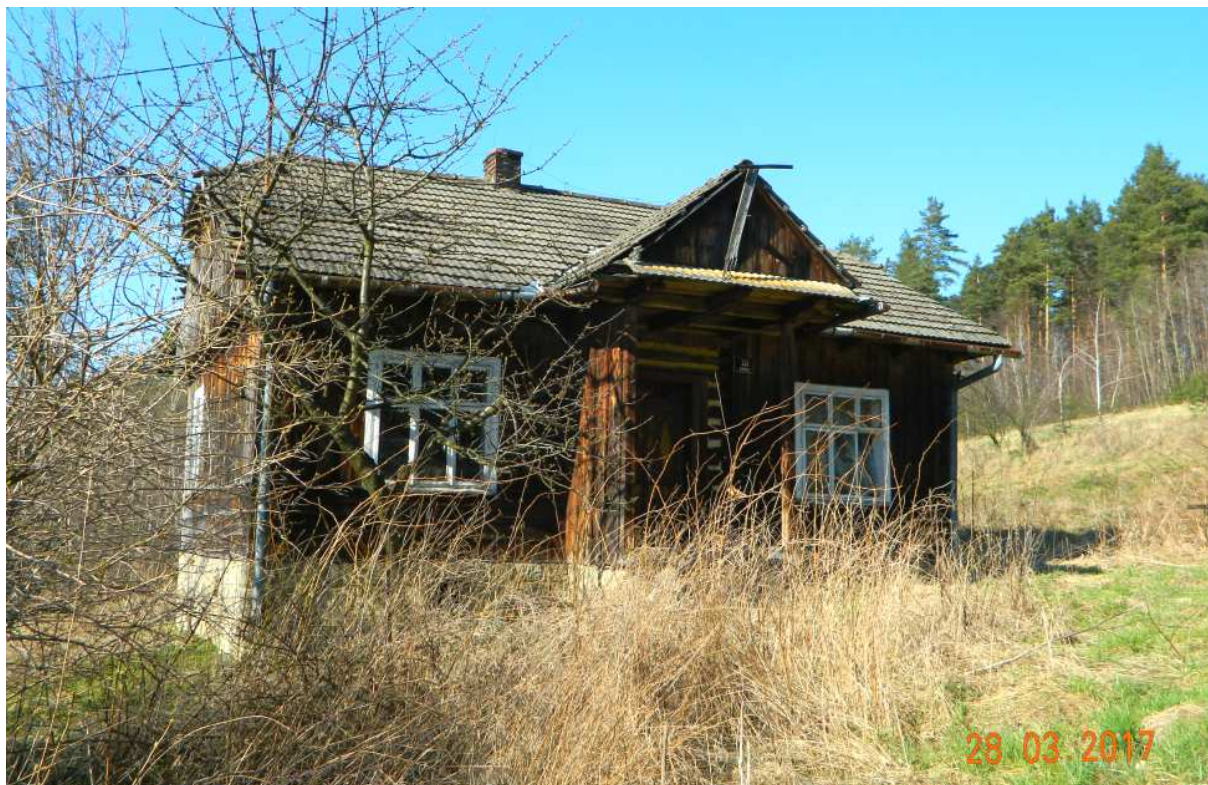
Fot. nr 104.