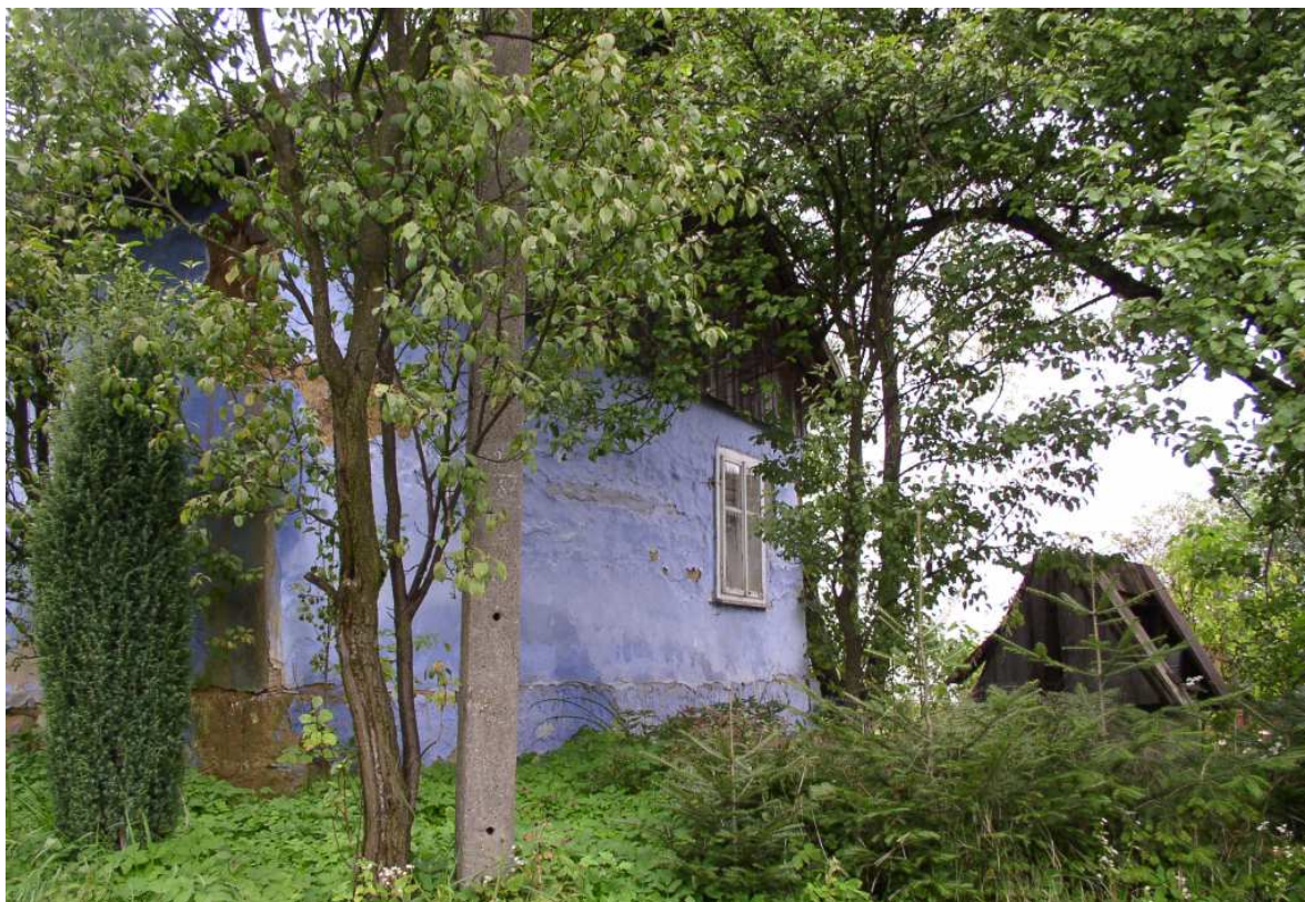
Fot. nr 46. Boczny fragment tradycyjnie bielonej chałupy, która tkwi w otoczeniu sadu.