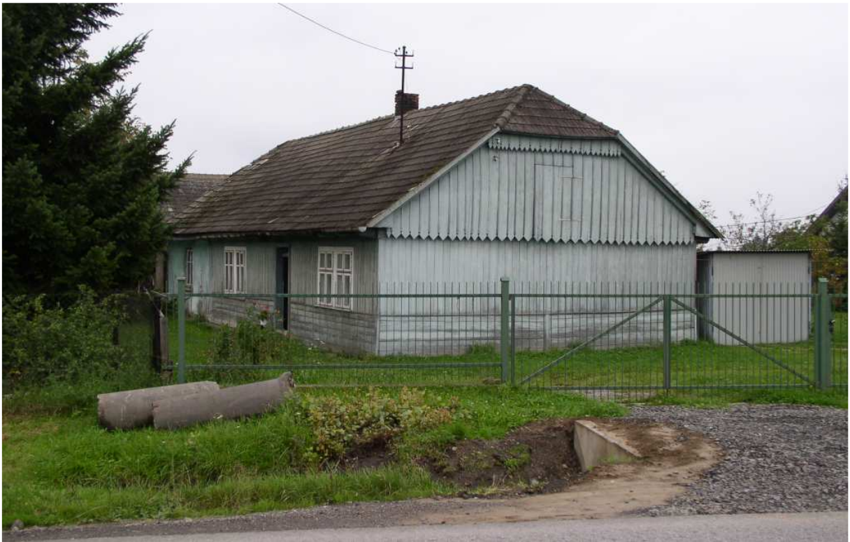
Fot. nr 6 (6-7). Oryginalny, przedwojenny dom mieszkalny z Pawlikowic.