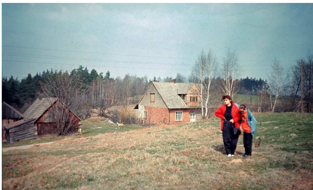
Fot. nr 79. Zagrody przy drodze do wzgórza usytuowanego nad Czaślawiem (wiosna 1992).