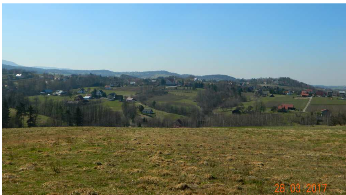
Fot. nr 91. W stronę Brzezowej i Drogini.