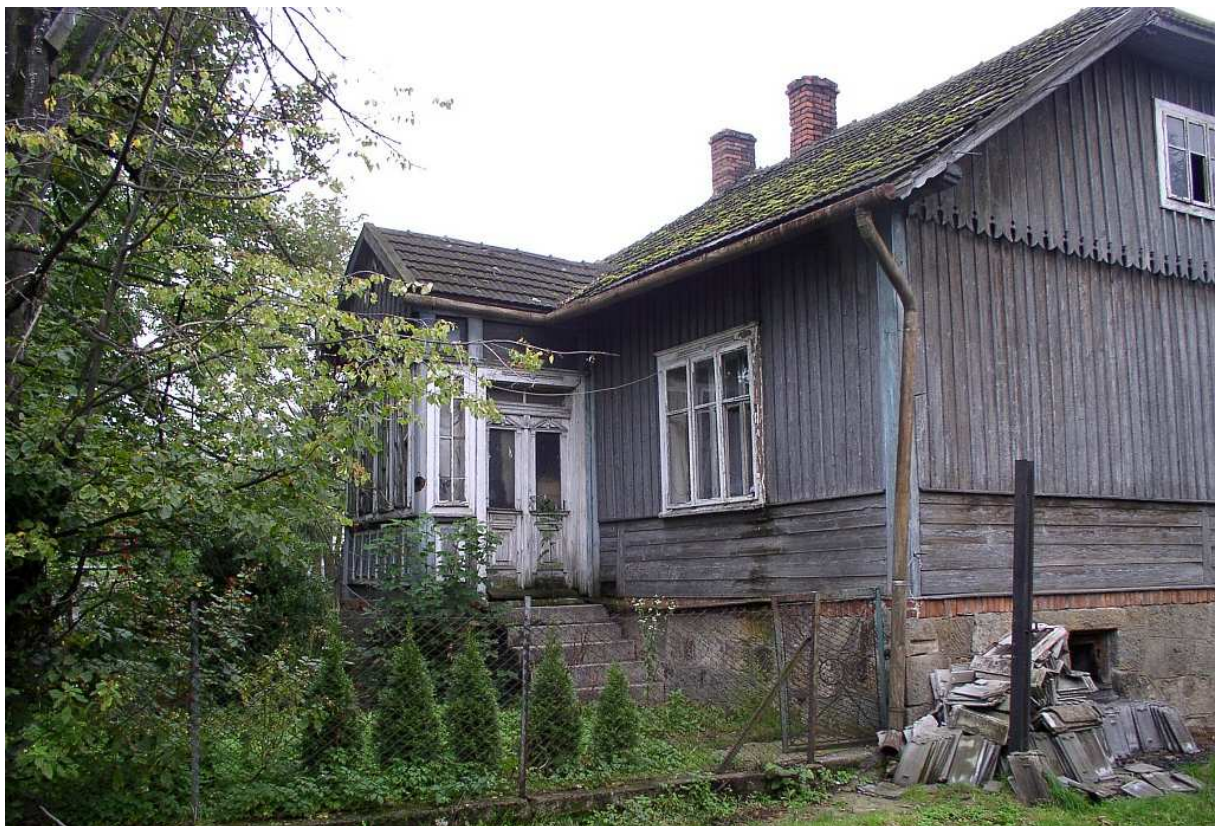
Fot. nr 51 (51-53). Rozległy dom z ulicy Dębowej 56, pochodzący zapewne z II ćwierci XX wieku bądź z połowy tego wieku, który najprawdopodobniej już nie istnieje.