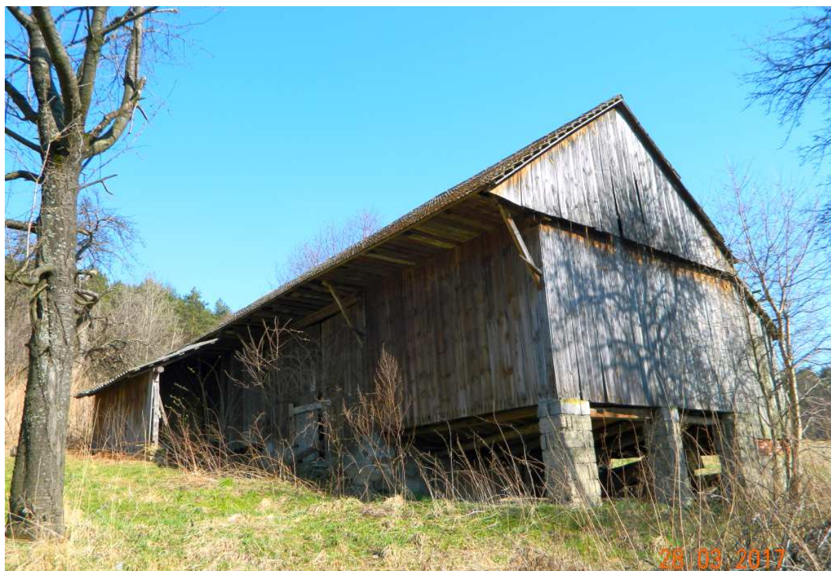
Fot. nr 110. Rozległa stodoła.