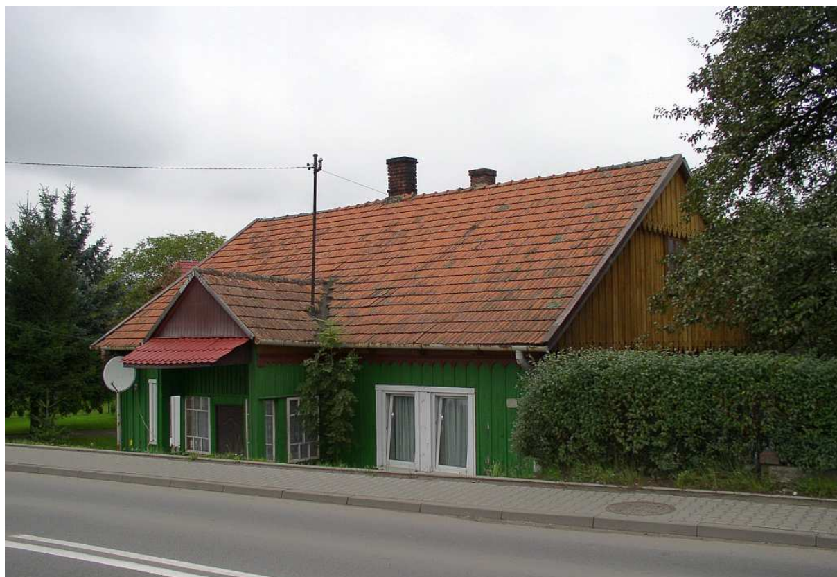
Fot. nr 15. Odległy czas powstania tego domu dobrze uzmysławia jego usytuowanie względem jezdni.