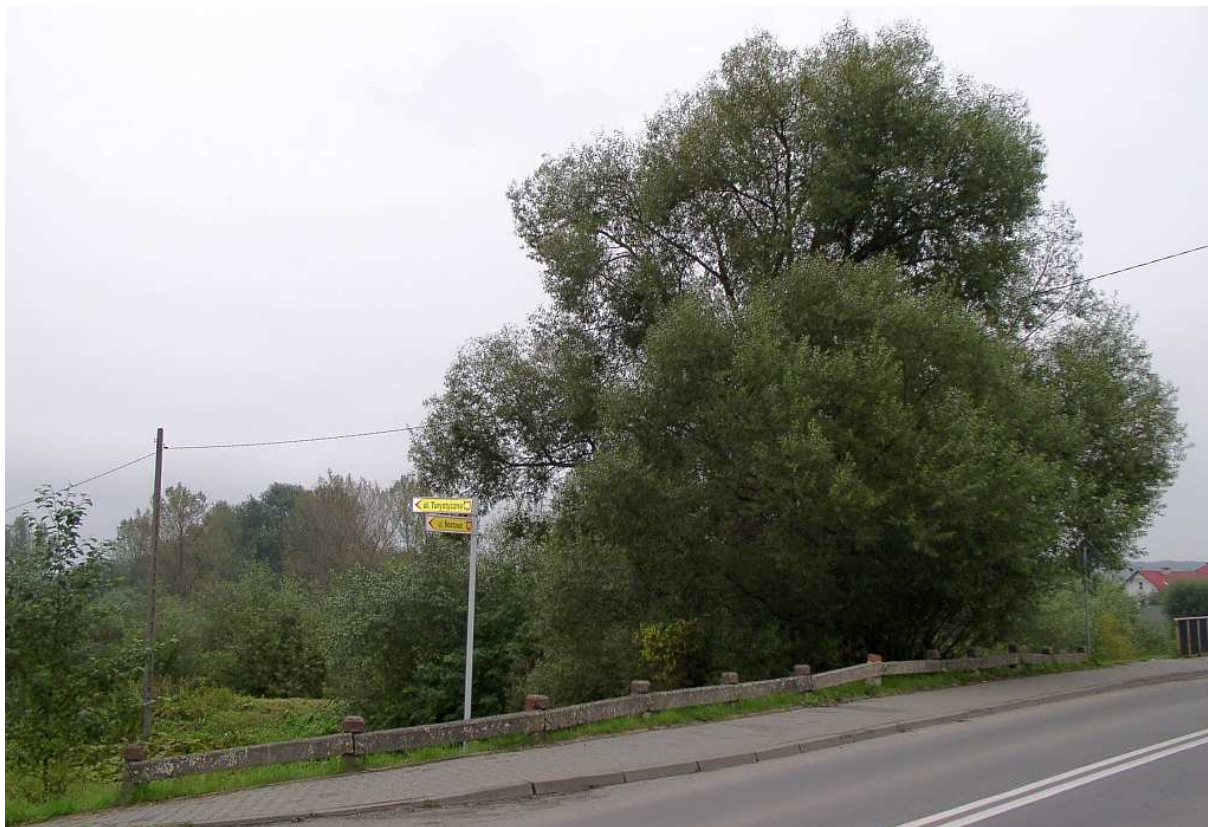
Fot. nr 21. Nadrzeczny krajobraz Raby - widok od strony ulicy Mostowej.