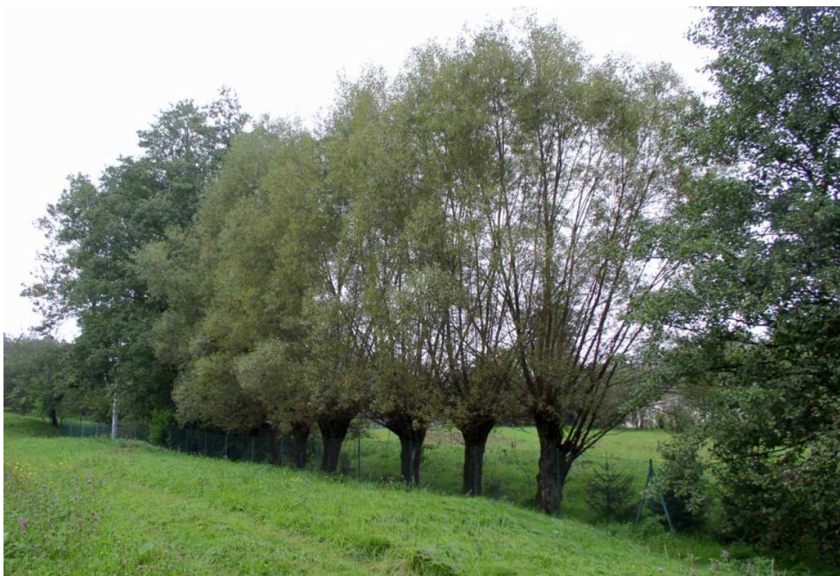
Fot. nr 59. Krajobraz podmokłych łąk w sąsiedztwie prezentowanej powyżej zagrody.