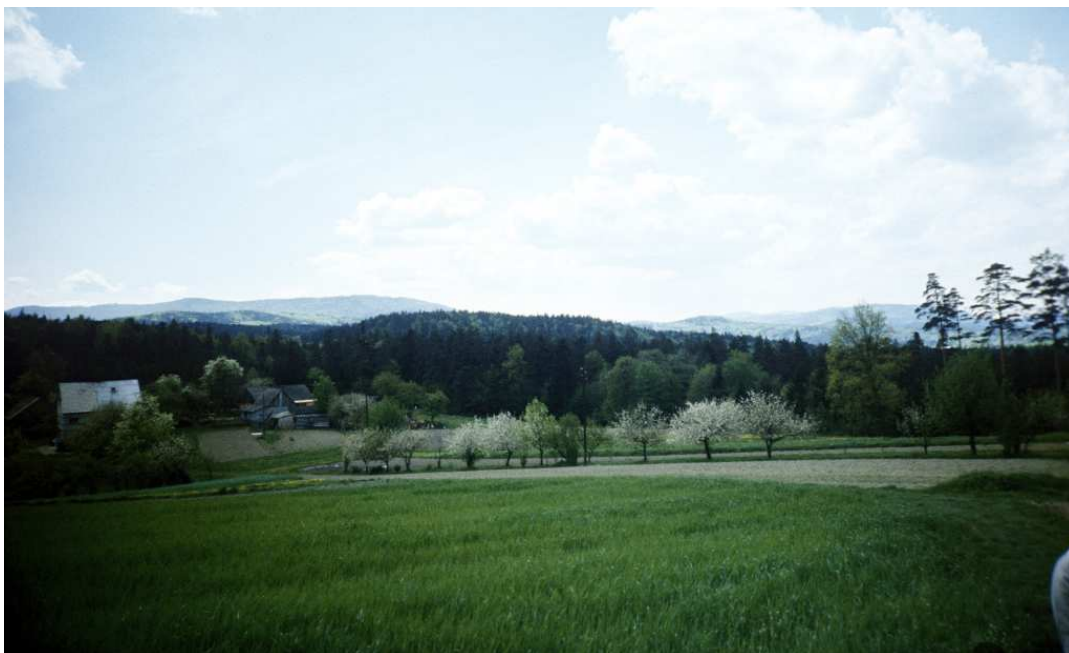
Fot. nr 74 (74-75). Ujęcia w stronę Wiśniowej (wiosna 1991).