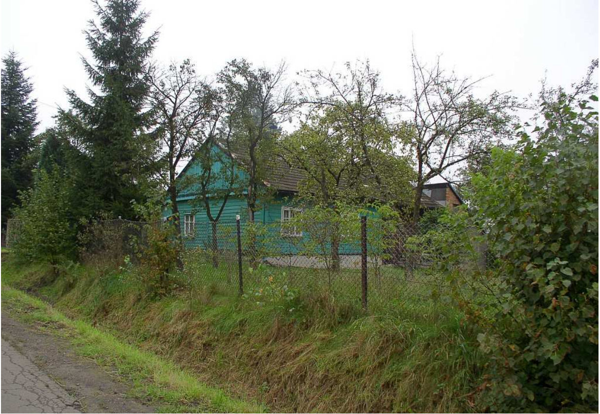
Fot. nr 54 (54-55). Zapewne jeszcze przedwojenny dom z ulicy Dębowej 72, zlokalizowany przy pograniczu z Kornatką.