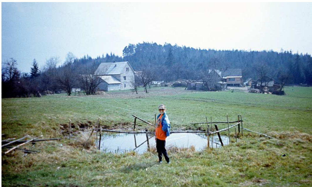
Fot. nr 76 (76-77). Wzgórze na dolinę Czajkiewic (wiosna 1992).