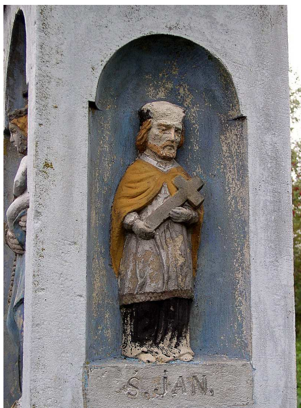
Fot. nr 27. Figura św. Jana z niszy prawego boku.