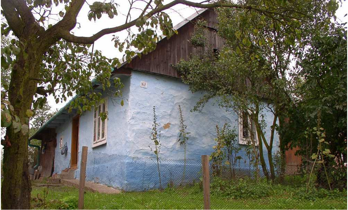
Fot. nr 48. Fasada antyku z przedmieść Dobczyc, który nadal jest starannie bielony.