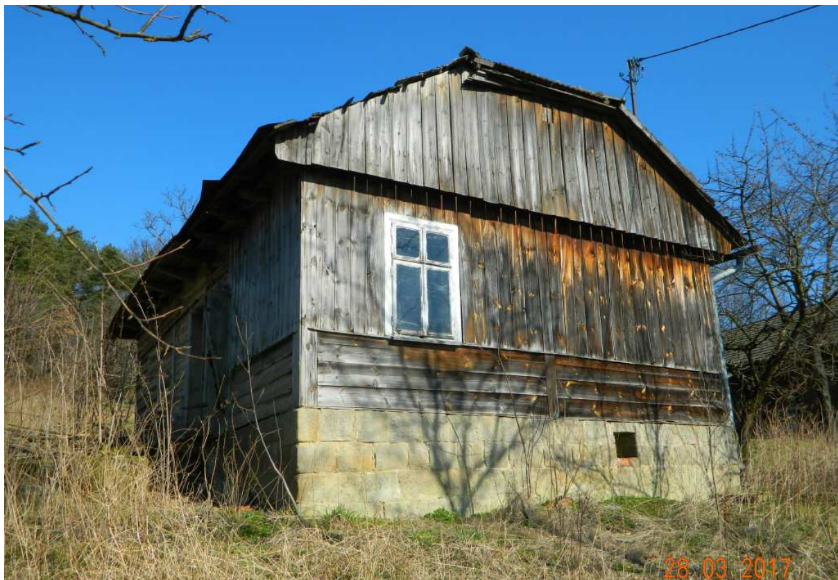
Fot. nr 106.