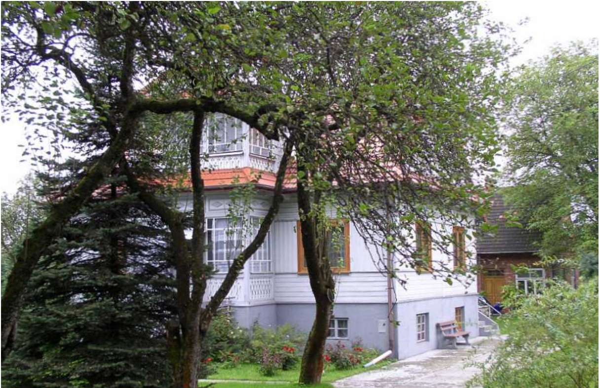
t. nr 11. Próba uchwycenia oszklonej werandy ukrytej pośród ogrodu. W tle ledwo widoczny, drewniany dom.