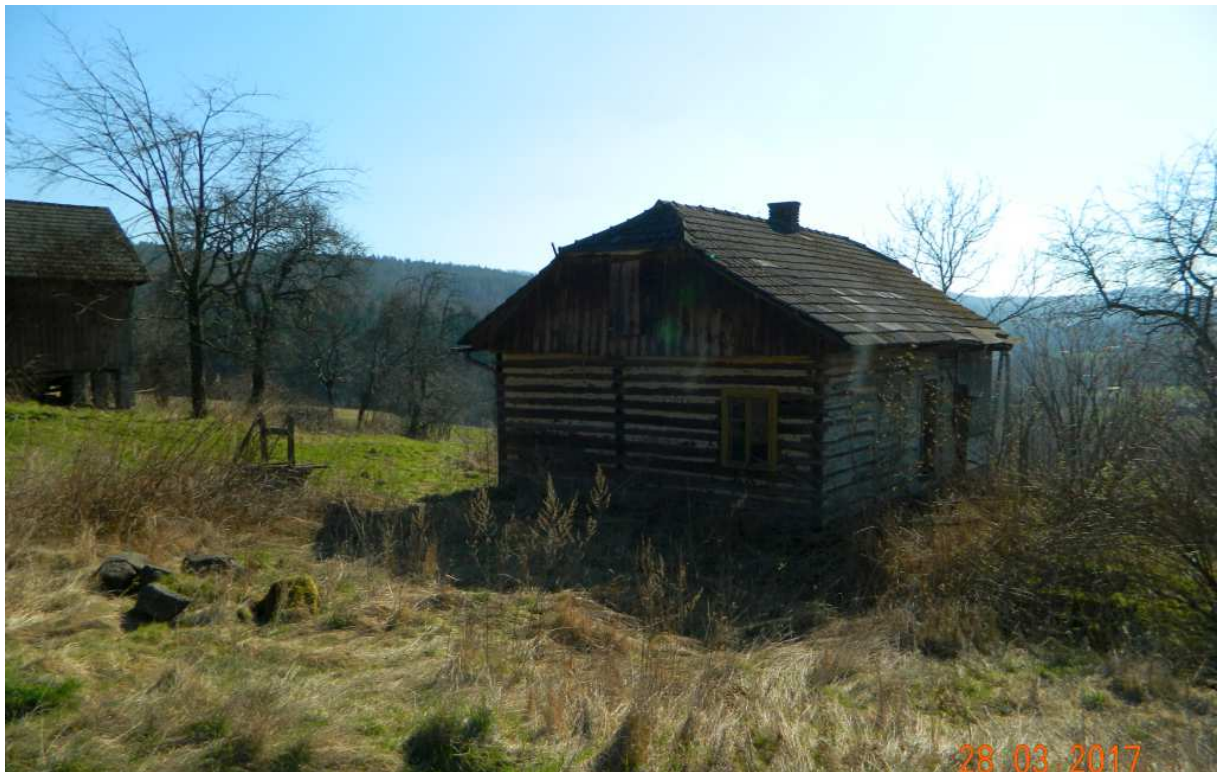
Fot. nr 108 (108-109). Prawy bok i tył.