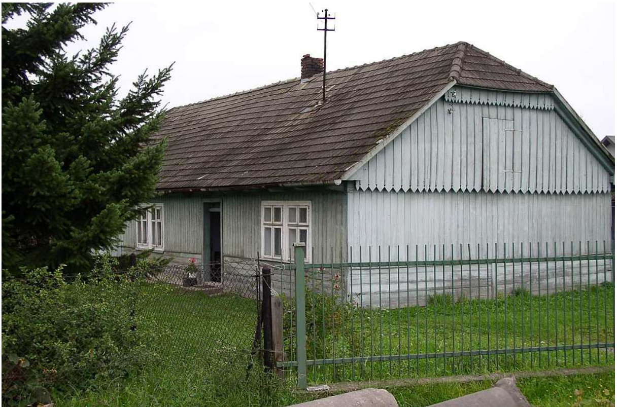
Fot. nr 7. Fasada oryginału z Pawlikowic, który dobrze oddaje obraz przedwojennej, podkrakowskiej wsi.