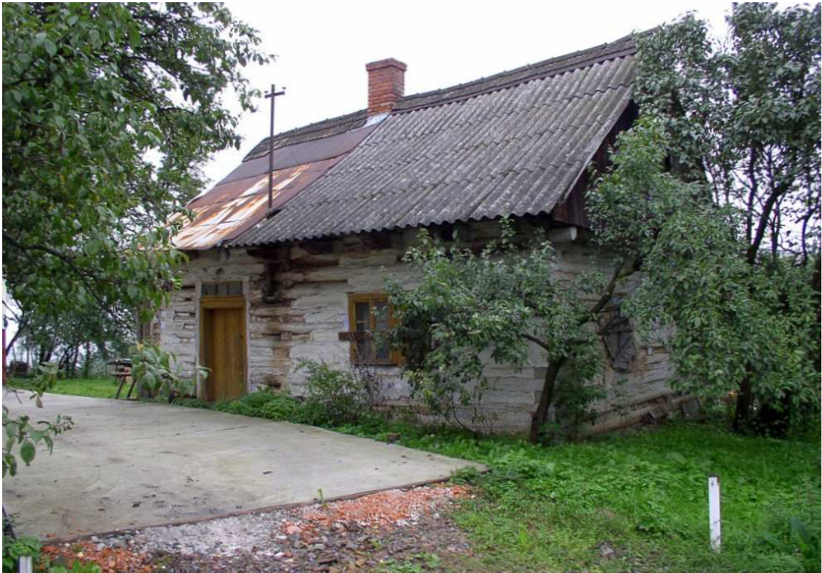
Fot. nr 33 (33-36). Skromna chatka – obiekt z ulicy Dębowej (nr 23), kolejny antyk z zapewne XIX-to wiecznymi korzeniami. Chyba jeszcze trwa.