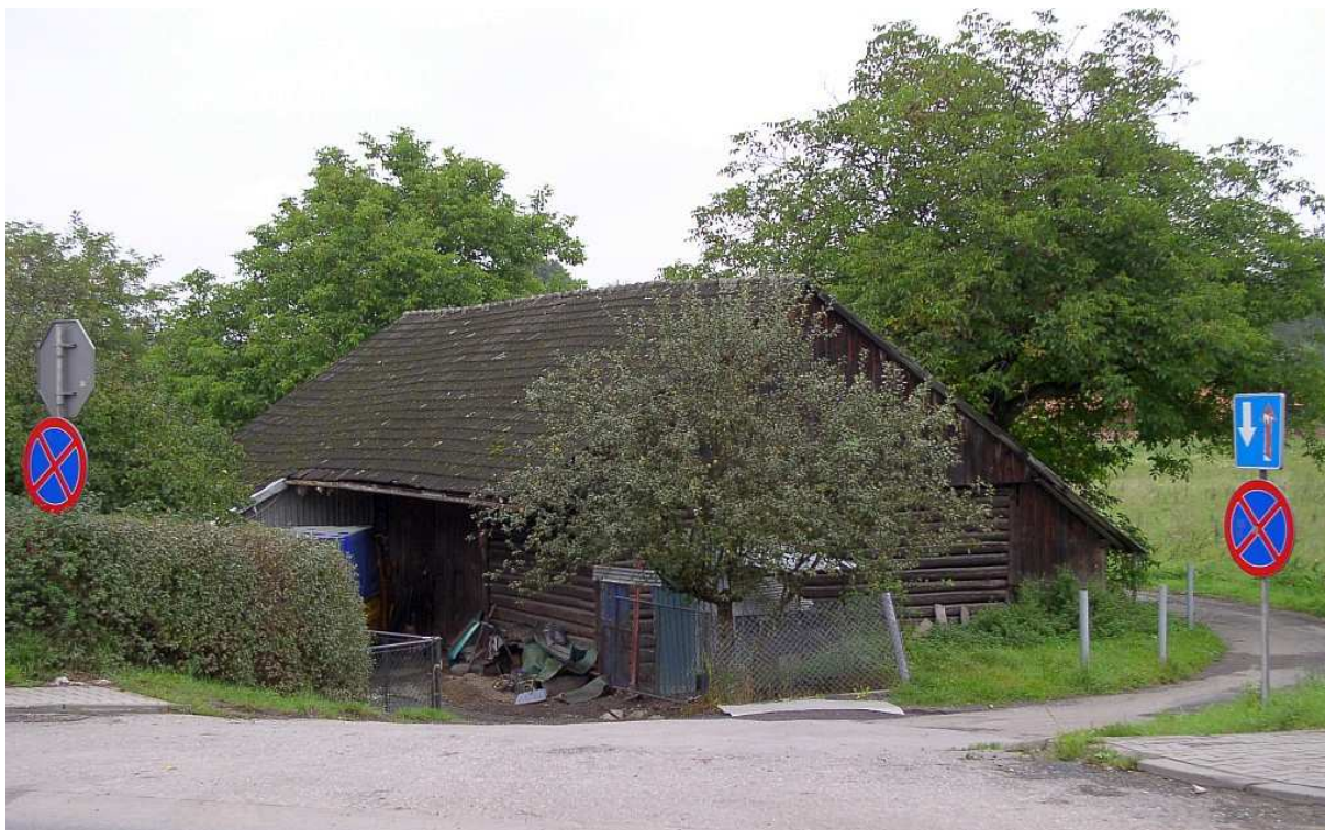
Fot. nr 16 (16-17). Oryginalna stodoła z sąsiedztwa Raby, element zagrody spod nr 1.