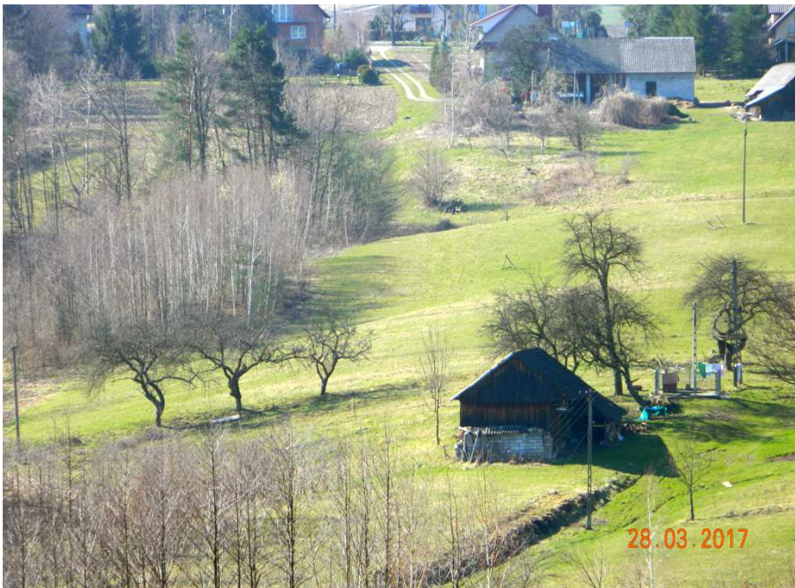
Fot. nr 93 (93-94). Stodoła z zagrody pod nr 30 (?) i jej sielskie otoczenie.