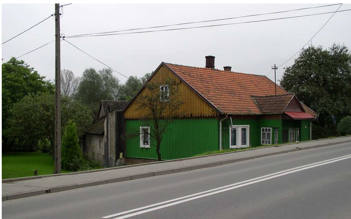
Fot. nr 13 (13-15). Przedwojenny dom mieszkalny z ulicy Mostowej 1, zlokalizowany w bliskości mostu – główny człon dawnej zagrody.