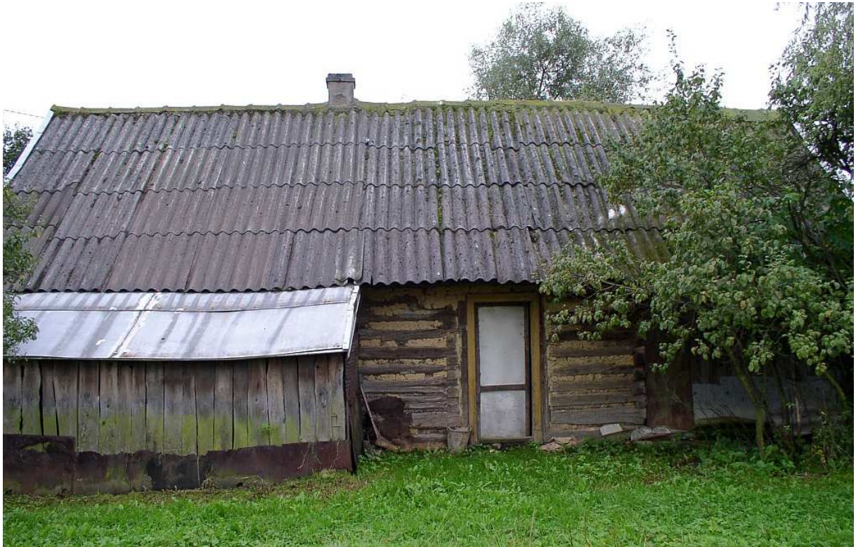
Fot. nr 50. Tył chaty z dobrze widoczną fakturą, którą stanowią poprzecznie kładzione bele wypełniane gliną.