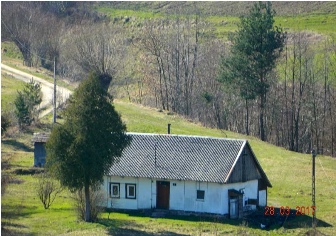
Fot. nr 92. Bliska oryginałowi chałupa spod nr 82.