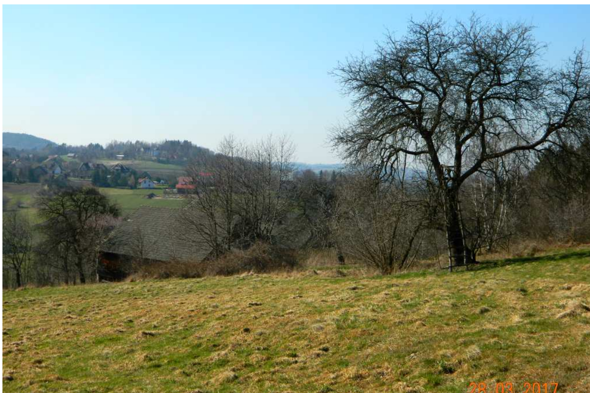
Fot. nr 97. Widok od strony lasu.