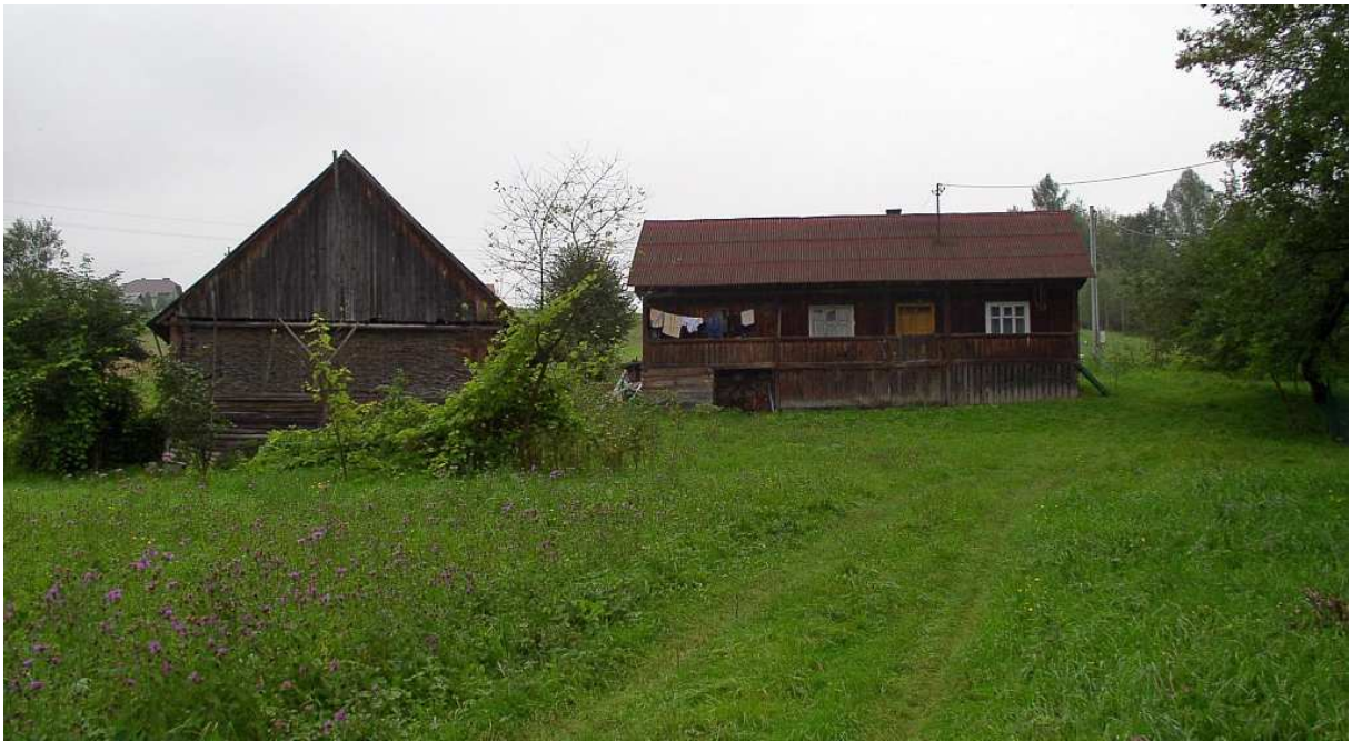
Fot. nr 56 (56-58). Dawna zagroda z początkowego fragmentu Kornatki (nr 5) w sąsiedztwie ulicy Zalesie.