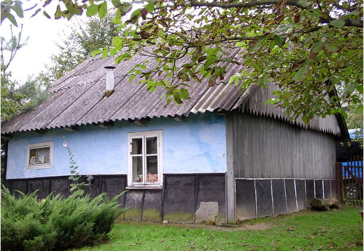
Fot. nr 32. Bliska oryginałowi fasada antyku. I tylko strzechy brak, której dziś już w okolicy nie uświadczysz. A może jest schowana pod eternitem?