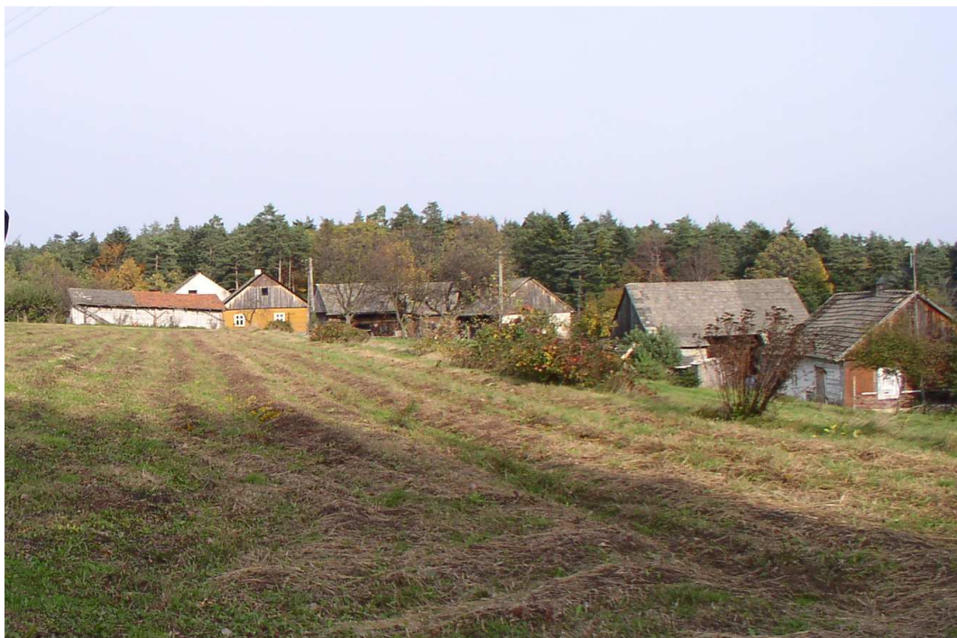
Fot. nr 60 (60-63). Ujęcia ze wzniesienia Zajazd (tu wrzesień 2008).