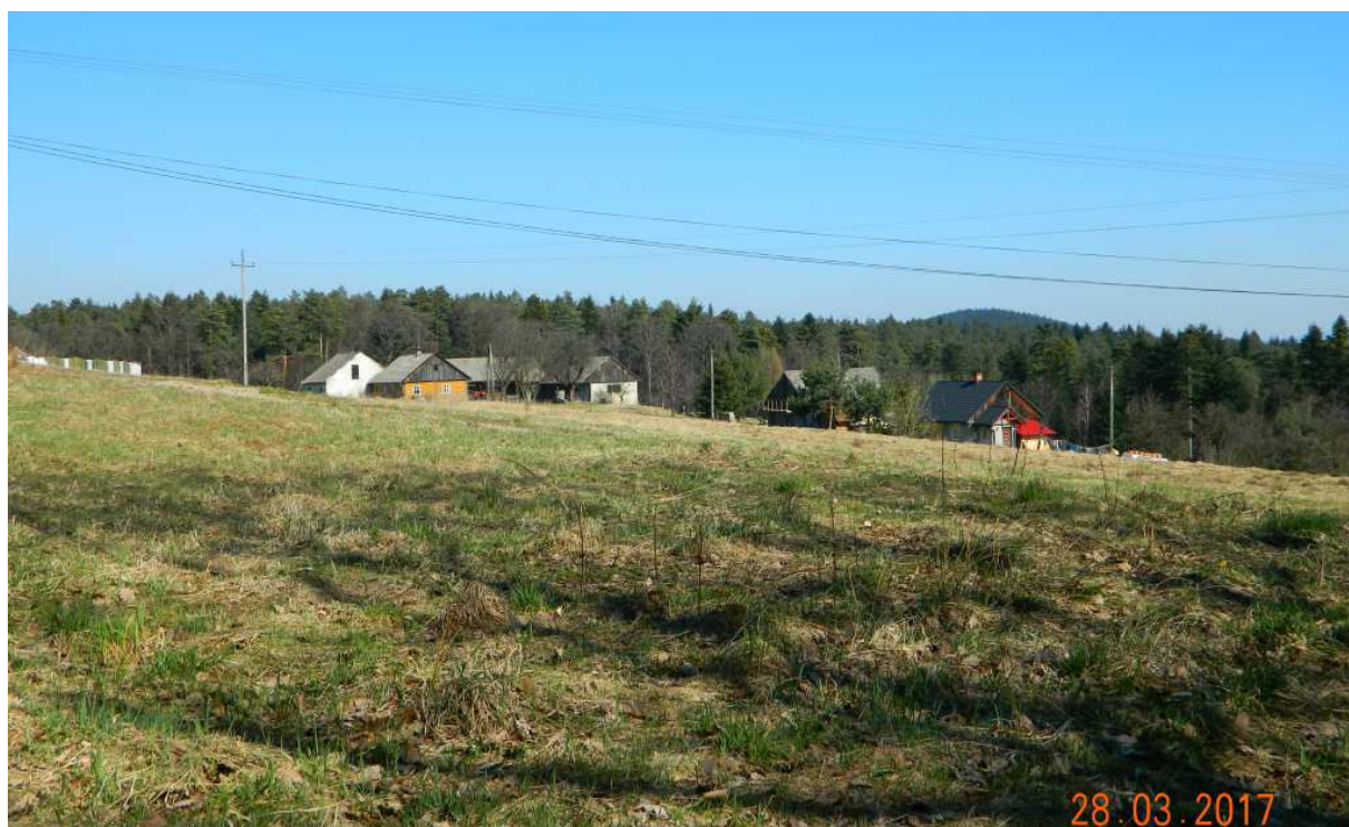
Fot. nr 87. Zabudowa wzniesienia.