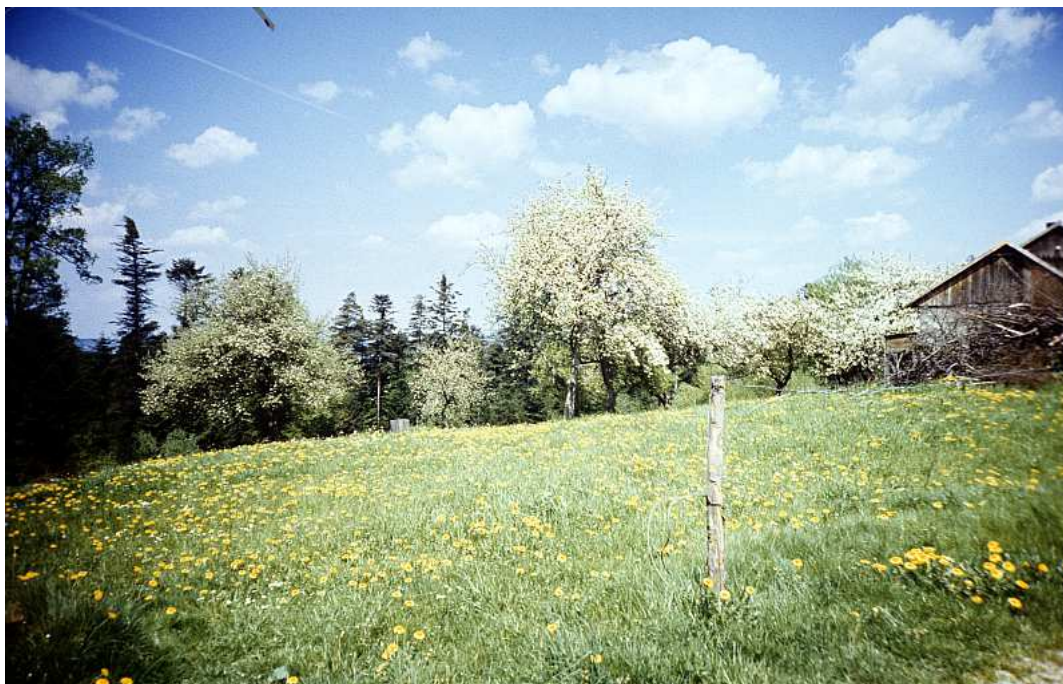
Fot. nr 66. (Wiosna 1991).