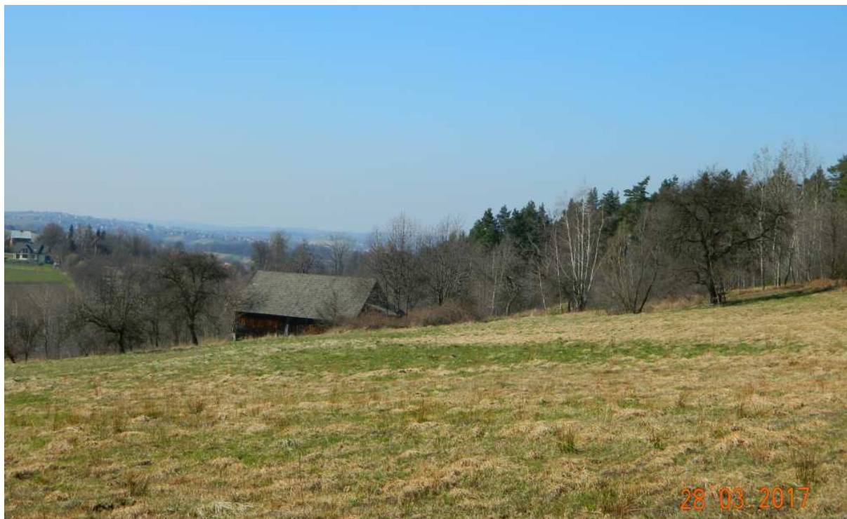
Fot. nr 96 (96-109). Zagroda pod nr 10 i jej zabudowania.