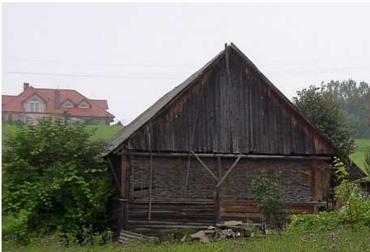
Fot. nr 58. Archaiczna stodoła z boczną ścianą wyplataną z wikliny.