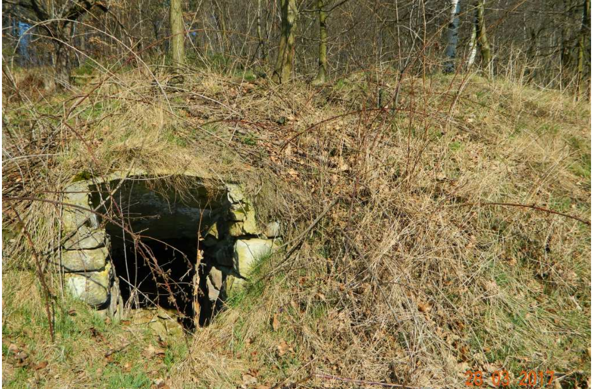
Fot. nr 112. Głęboki i rozległy loch.