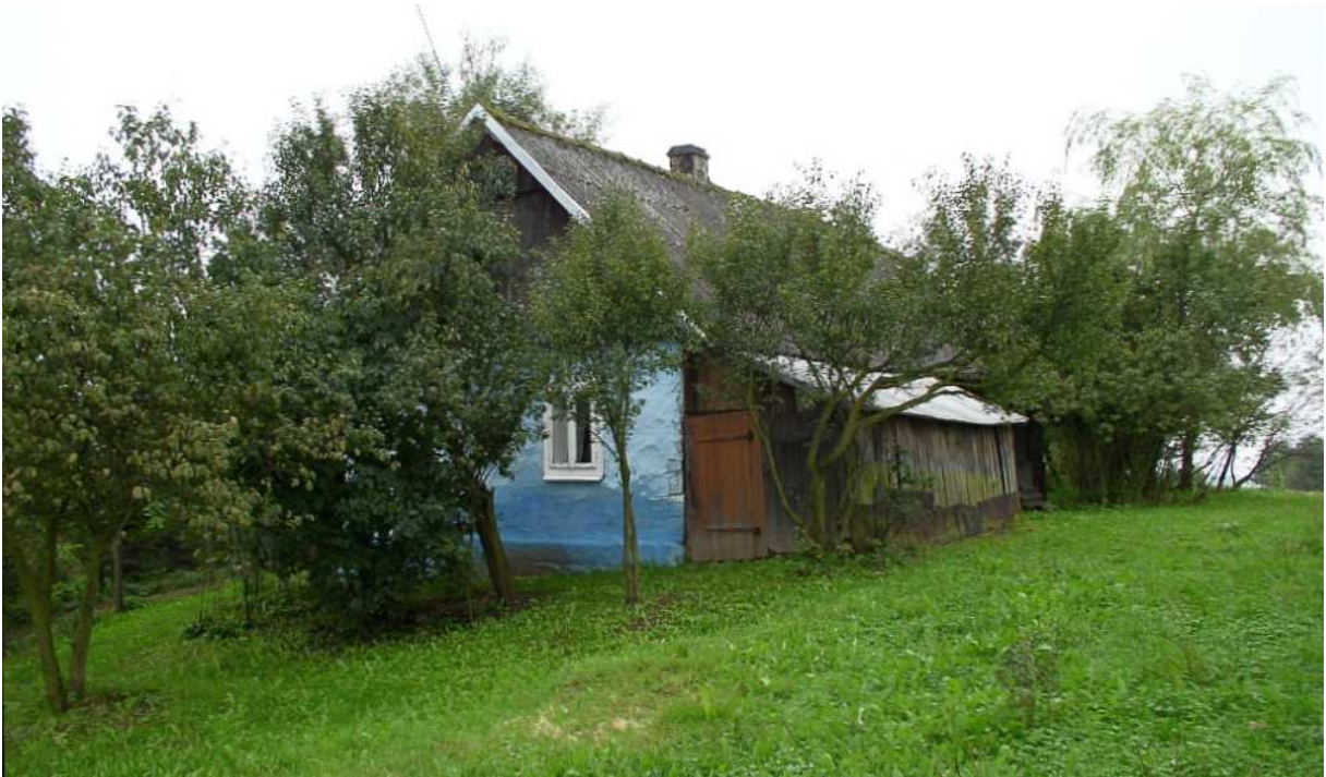
Fot. nr 49. Boczna i tylna część chałupy z ulicy Dębowej 43, która jest ukryta pośród starego sadu.