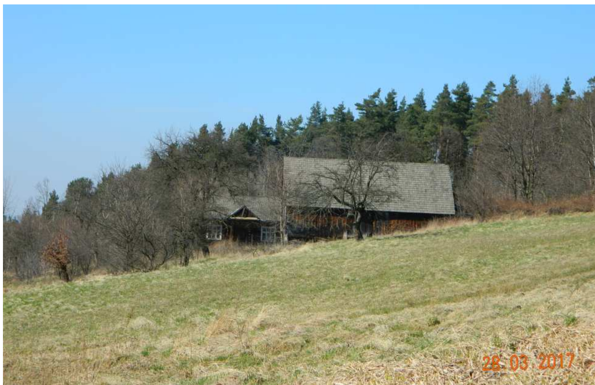
Fot. nr 98 (98-100). Dom i przylegająca do niego stodoła.