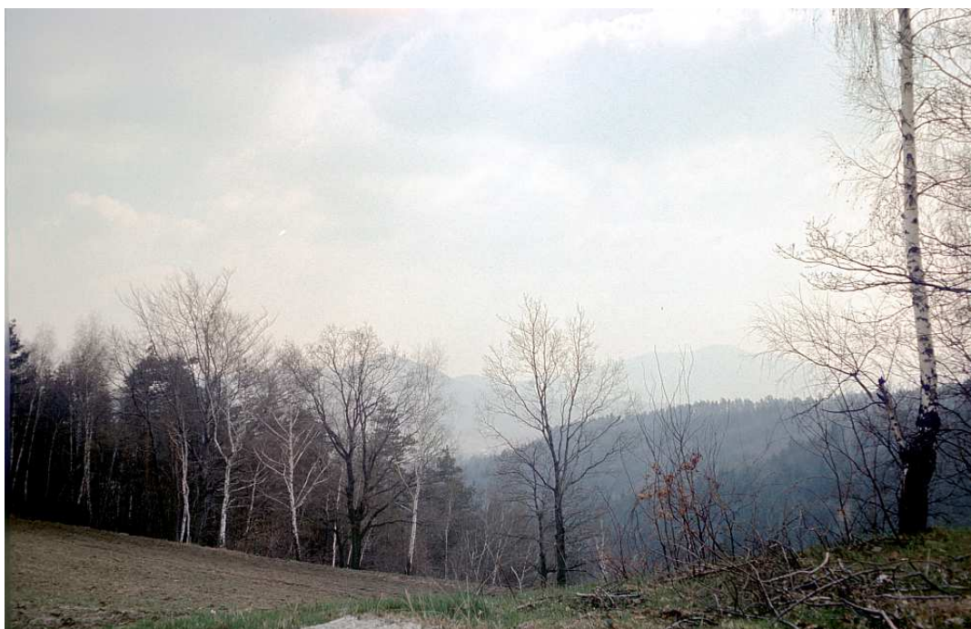
Fot. nr 81. (Wiosna 1992).