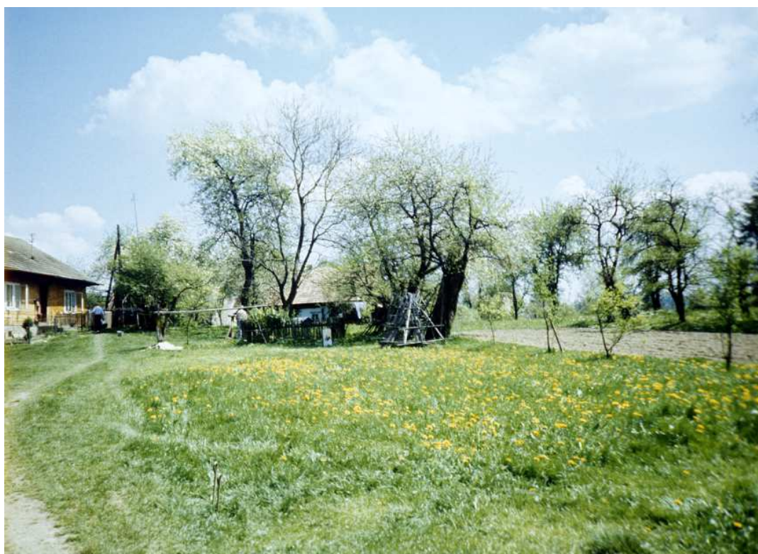
Fot. nr 73. (Wiosna 1991).