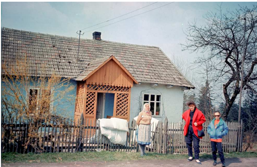
Fot. nr 70. (Wiosna 1992).