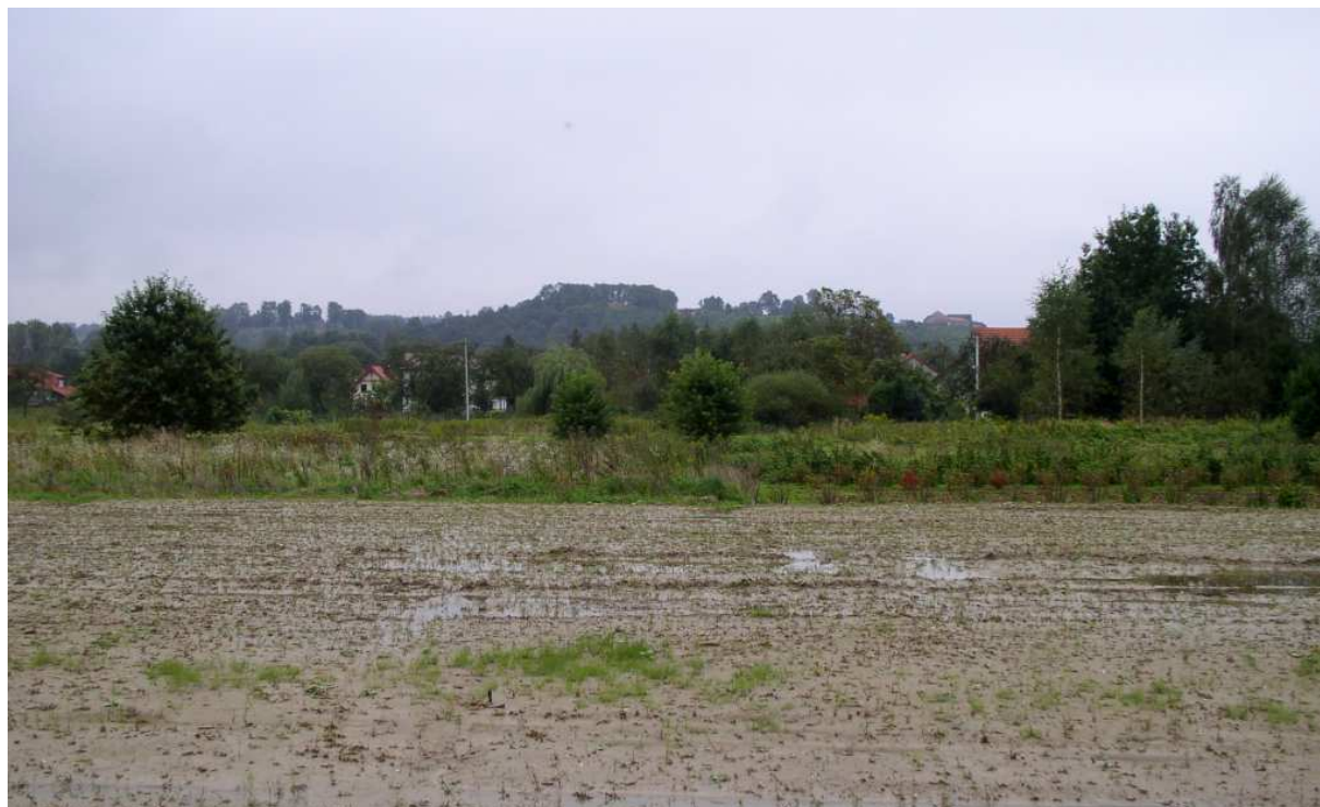
Fot. nr 2. Stare Dobczyce i Wzgórze Zamkowe (w tle) – widok spod marketu Biedronka, z obrzeża ulicy Zarabie (12.09.2010).

Dobczyce i ich przedpole to ciągle żywy skansen budownictwa: małomiasteczkowego, podmiejskiego i wiejskiego, wyjątkowo obfity i różnorodny jak na polskie warunki. Miastu temu poświęciłem już drugą część tego cyklu (patrz załącznik), ale oczywiście nie wyczerpałem wtedy tematu, bo skoncentrowałem się wówczas głównie na obiektach zlokalizowanych w centrum miasta i wokół wylotowej ulicy Kilińskiego. Tym razem starałem się uwiecznić obraz odchodzącego świata tej prowincjonalnej kiedyś miejscowości, jaki zachował się jeszcze przy wjeździe do miasta od strony Krakowa i Myślenic (ulica Mostowa), jak i wokół peryferyjnych ulic: Górskiej i Dębowej, usytuowanych przy jego południowo – zachodniej granicy, by na końcu zahaczyć tylko o pograniczną Kornatkę. Ciągle jest to barwny, oryginalny i różnorodny świat: po części galicyjskiej wsi, a w znacznych fragmentach przedwojennego i powojennego miasteczka.