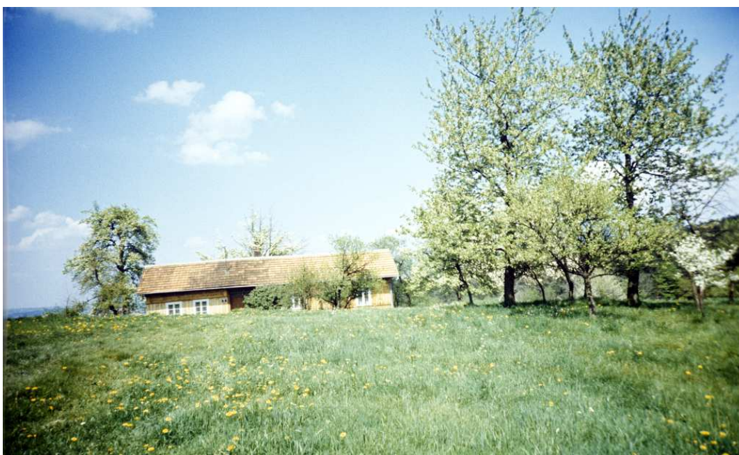
Fot. nr 63. Sielski krajobraz Kornatki (zagroda pod nr 9?), wsi idealnej do letniego wypoczynku (wiosna 1991).