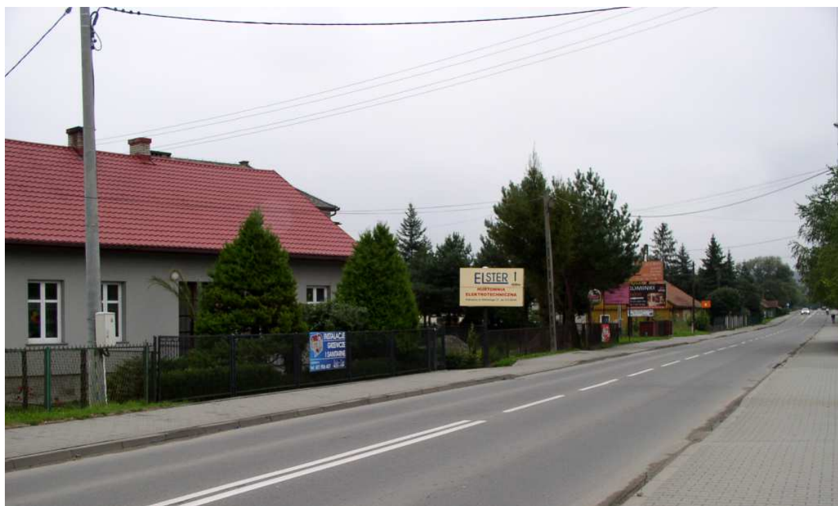
Fot. nr 3. Ulica Mostowa – widok w kierunku mostu na Rabie (12.09.2010).

Wokół ulicy Mostowej, drogi dojazdowej do mostu na Rabie, zachowały się jeszcze: stare, choć już nieco przebudowane chałupy, murowane, parterowe domki, jak i okazałe przedwojenne wille, które do dziś są wyposażone w oryginalne, przeszklone ganki. Jeszcze dziś można sobie wyobrazić wygląd tego przedmieścia z lat 60-tych, który utkwił mi w pamięci, gdy jako dziecko okazjonalnie zapuszczałem się w te strony; resztki tego świata próbuję utrwalić na prezentowanych poniżej fotografiach.