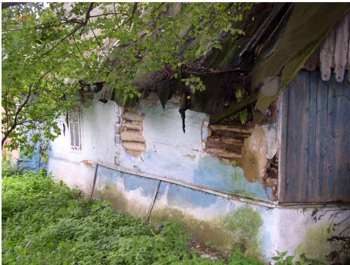
Fot. nr 42. Szczegóły faktury, którą stanowią poprzecznie ułożone belki, a następnie nakładało się na nie warstwę gliny.