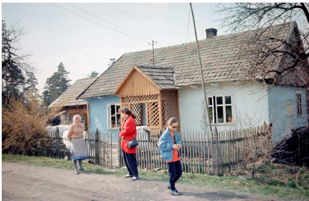
Fot. nr 69. Znana nam przez lata mieszkanka chałupy. Miała ośmioro dzieci, ale na końcu życia pozostała samotna i zmarła w domu starców (wiosna 1992).