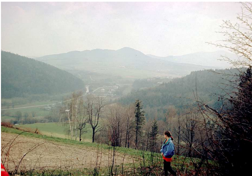
Fot. nr 84. (Wiosna 1992).