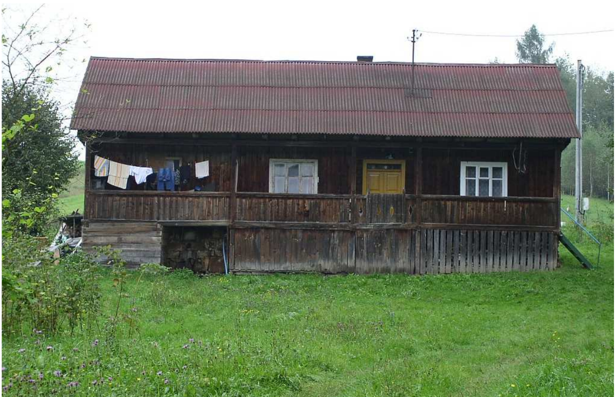
Fot. nr 57. Ciekawy przykład drewnianego domu z rozległą werandą - budynek zapewne z czasów międzywojennych.