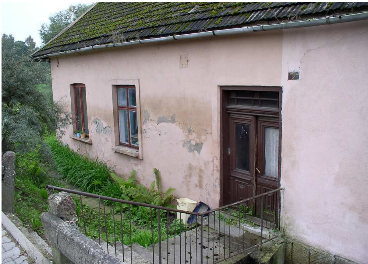
Fot. nr 20. Zachowane do dziś oryginalne detale wielorodzinnego domu z przedsionka Dobczyc – drzwi i pierwsze okno z lewej ich strony.