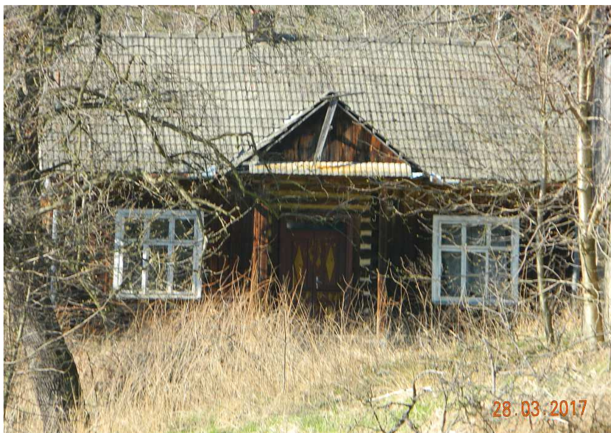
Fot. nr 101 (101-109). Opuszczony dom pod nr 10 i jego detale. Można przypuszczać, że powstał jeszcze przed II wojną światową bądź niedługo po jej zakończeniu.