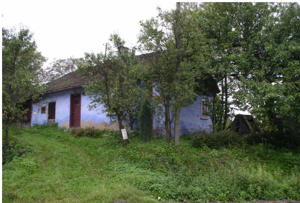
Fot. nr 43 (43-46). Być może jeszcze XIX-wieczny antyk z ulicy Dębowej (nr 39). Prawdopodobnie już nie istnieje.