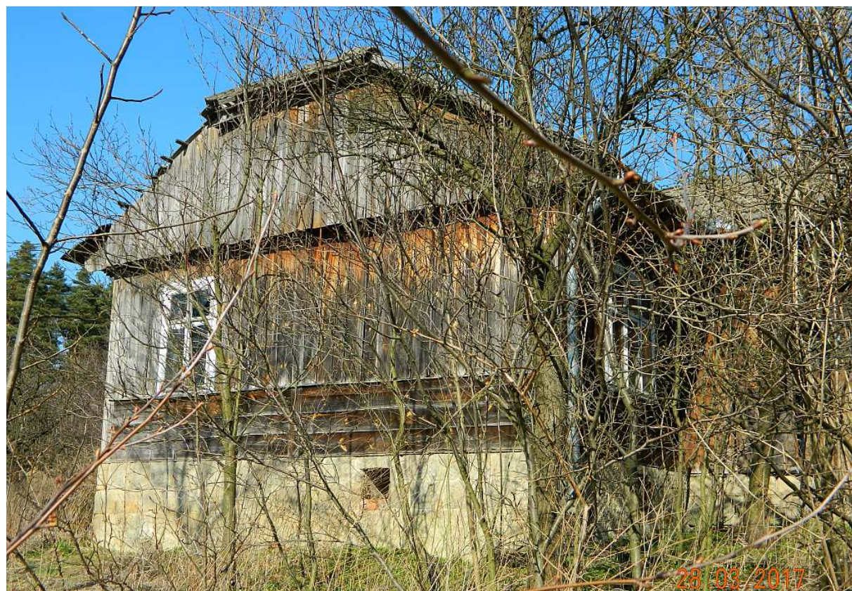
Fot. nr 105 (105-106). Lewy bok.