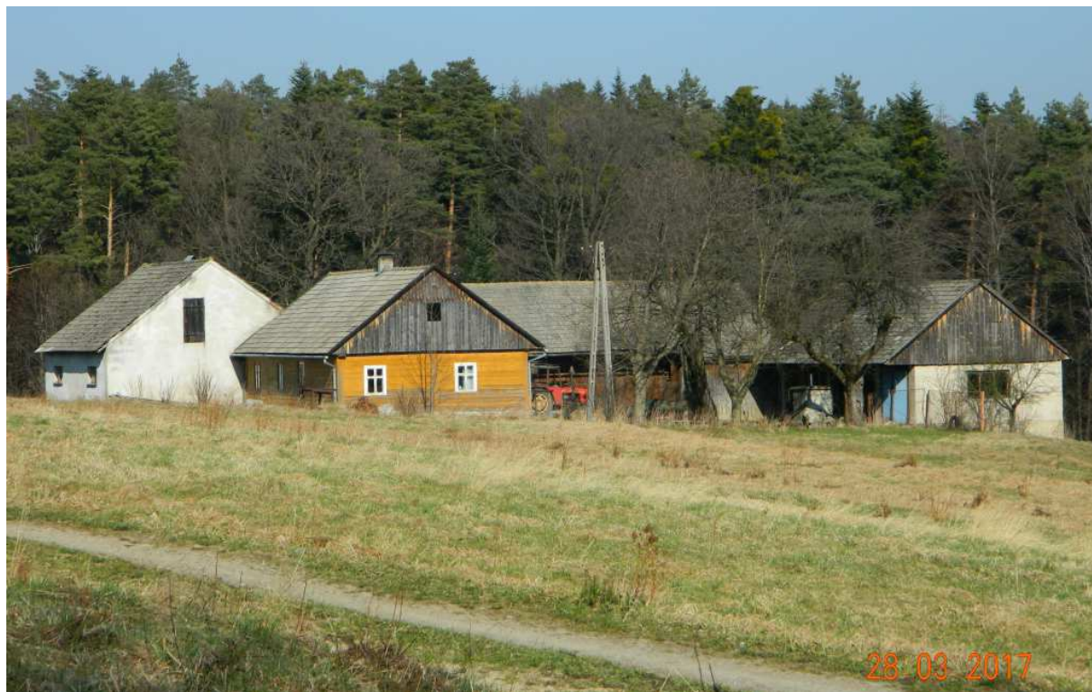
Fot. nr 88. Tradycyjne gospodarstwo pod nr 91(?).