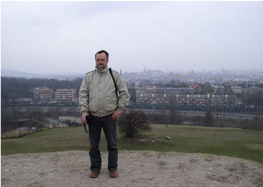
Fot. nr 1. Wiosna 2010. Kopiec Krakusa.