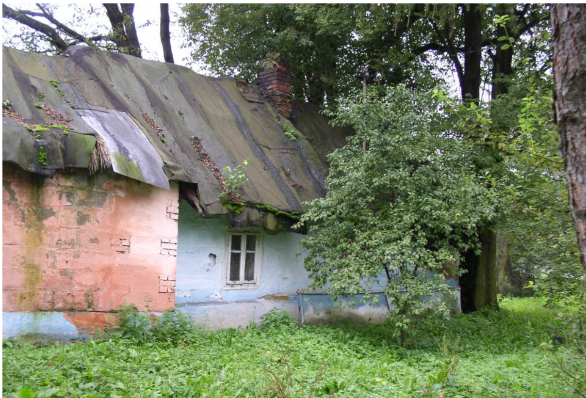
Fot. nr 40. Zapewne ponad stuletnia część mieszkalna, gdzie pod papą kryje się strzecha.