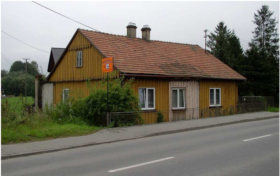
Fot. nr 8 (8-9). Budynek mieszkalny z ulicy Mostowej nr 5 ze współczesną już stolarką okienną (poza strychem), typowy dla czasów przedwojennych.