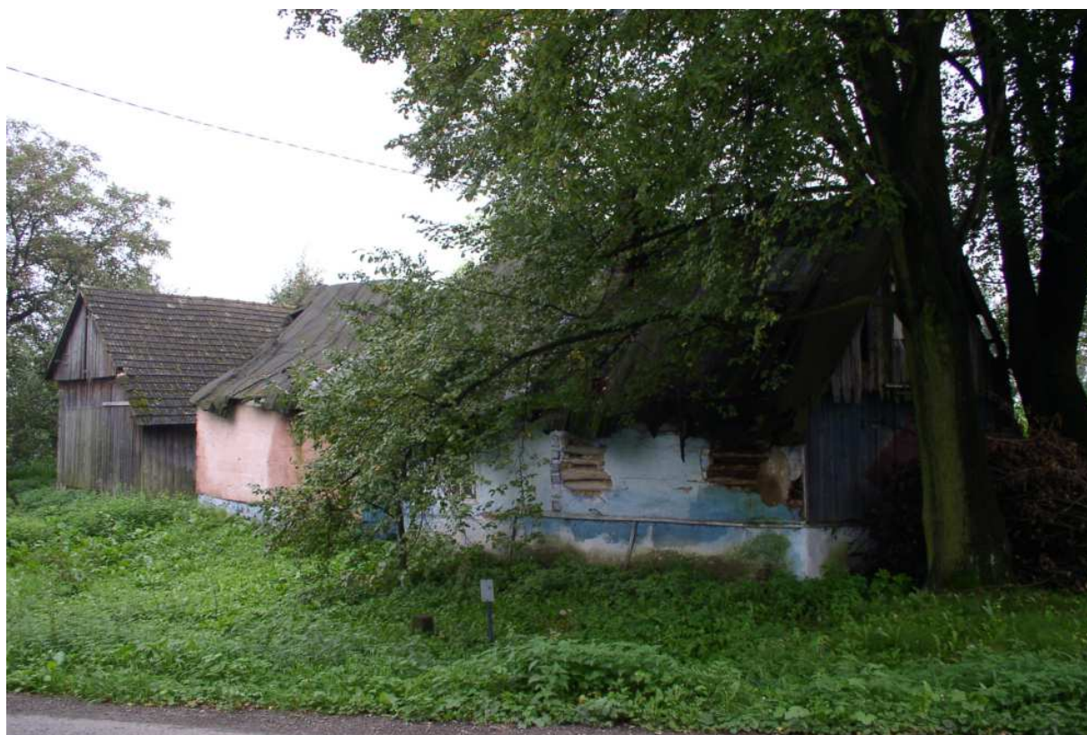
Fot. nr 37 (37-42). Kolejna, zapewne jeszcze XIX-wieczna, tradycyjna zagroda z ulicy Dębowej (36a?), która już nie istnieje.