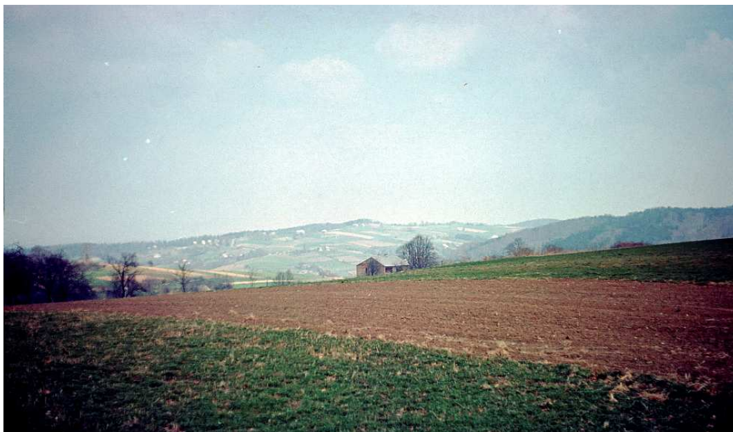
Fot. nr 78. W stronę Krzyworzeki i Skrzyńki (wiosna 1992).