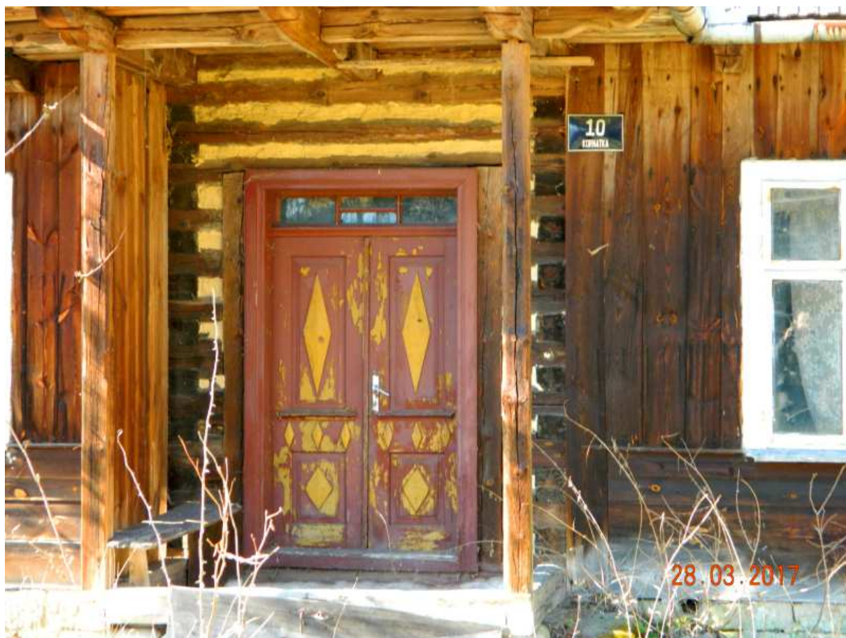
Fot. nr 103.