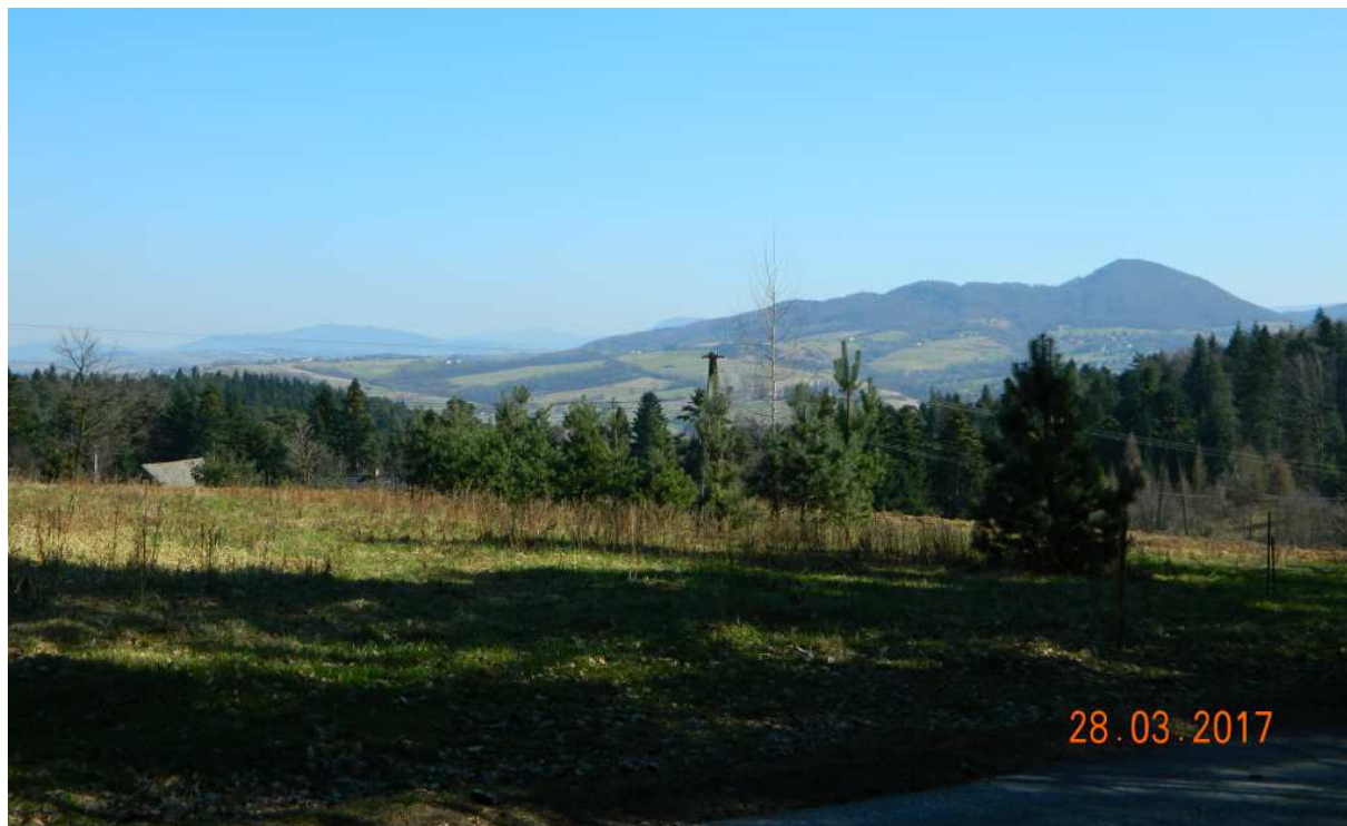
Fot. nr 86 (86-87). Widoki ze wzniesienia zwanego Zajazdem. Tu w stronę Grodziska.