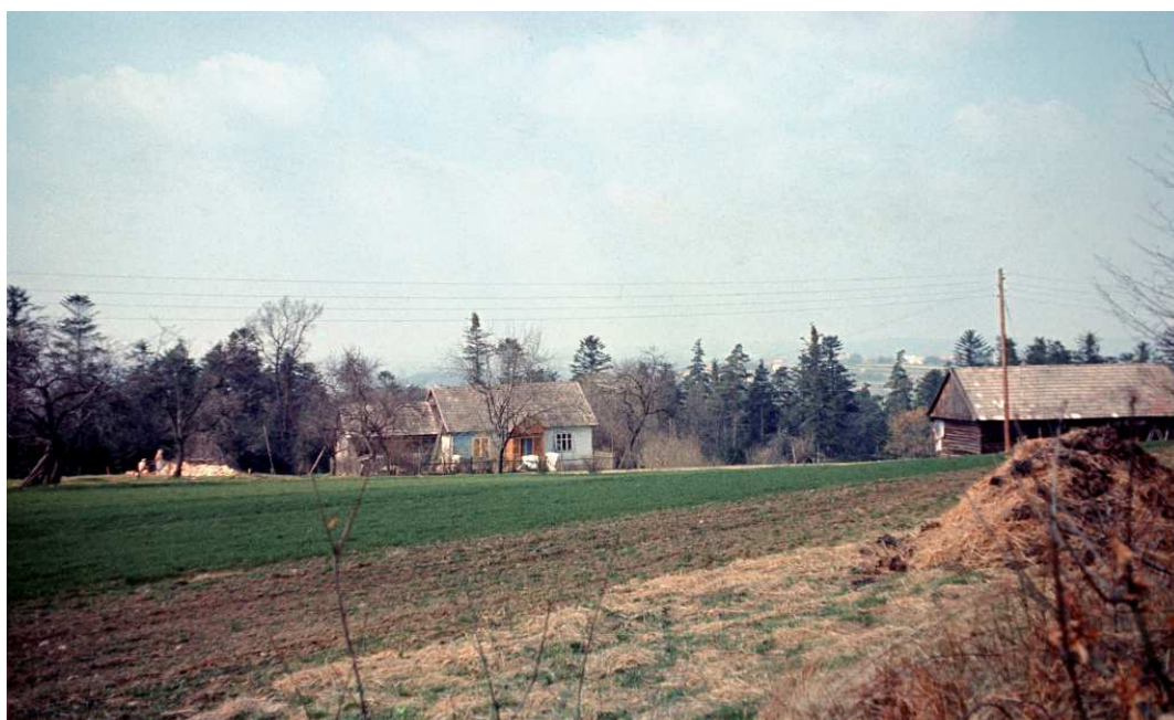
Fot. nr 67. Rządka zabudowa przysiółka Zalesie – sielski krajobraz w stylu retro (wiosna 1992).