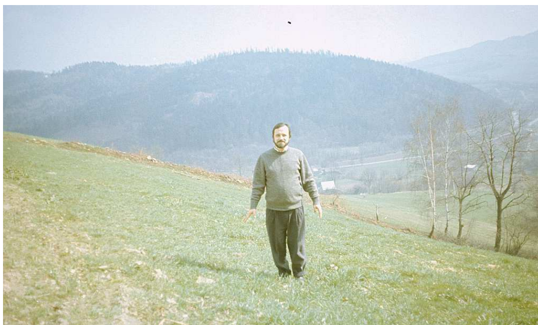
Fot. nr 85. Ze wzgórzem na sąsiednim zboczu (w tle) za doliną Czaławia (wiosna 1992).