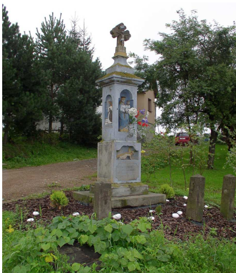
Fot. nr 25 (25-29). Zabytkowa kapliczka słupekowa, posadowiona w 1882-go roku, z krzyżem w zwieńczeniu – obiekt z peryferyjnej ulicy Górskiej w sąsiedztwie z ulicą Podlesie.