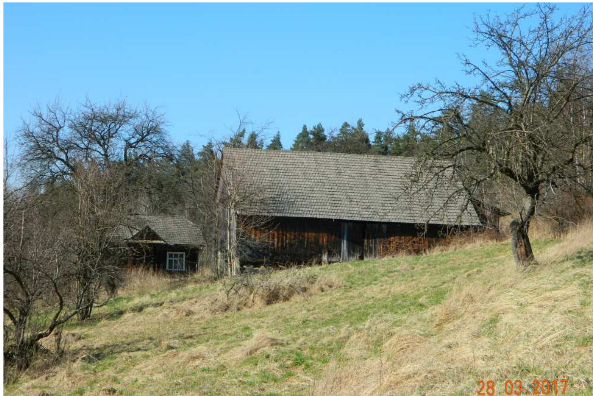
Fot. nr 99.