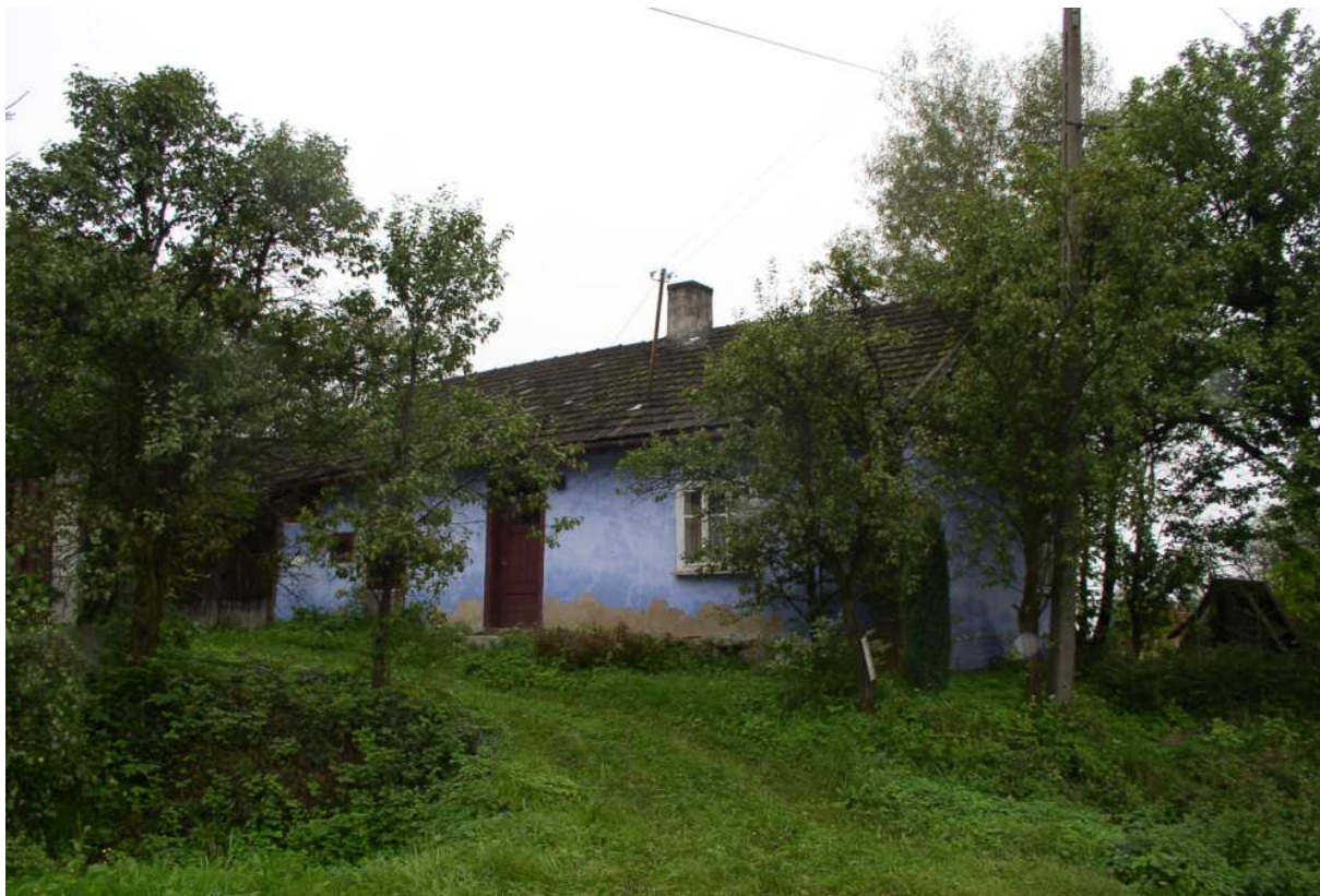
Fot. nr 44. Podwórkó dawnej zagrody.