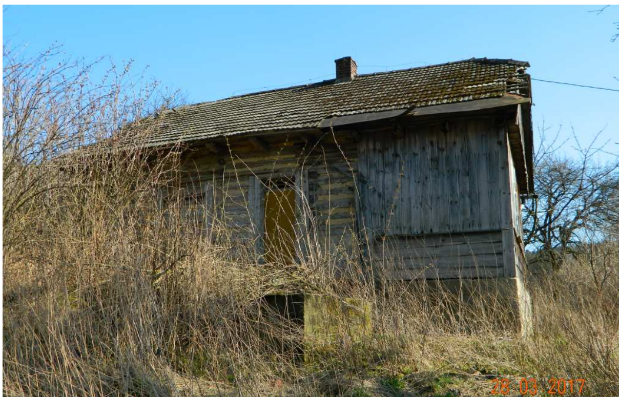
Fot. nr 107. Tył domu.