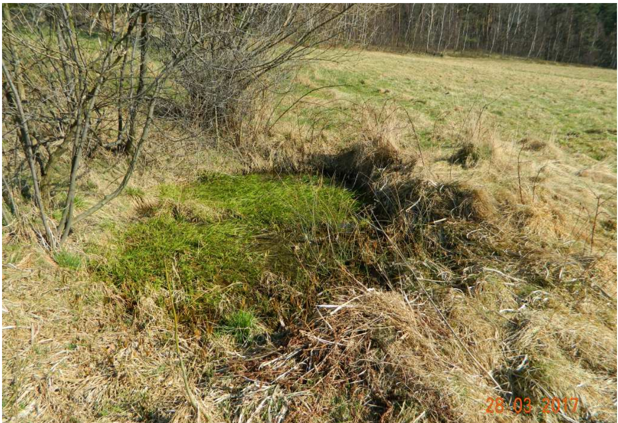
Fot. nr 113. Pozostałości po dawnym stawku.