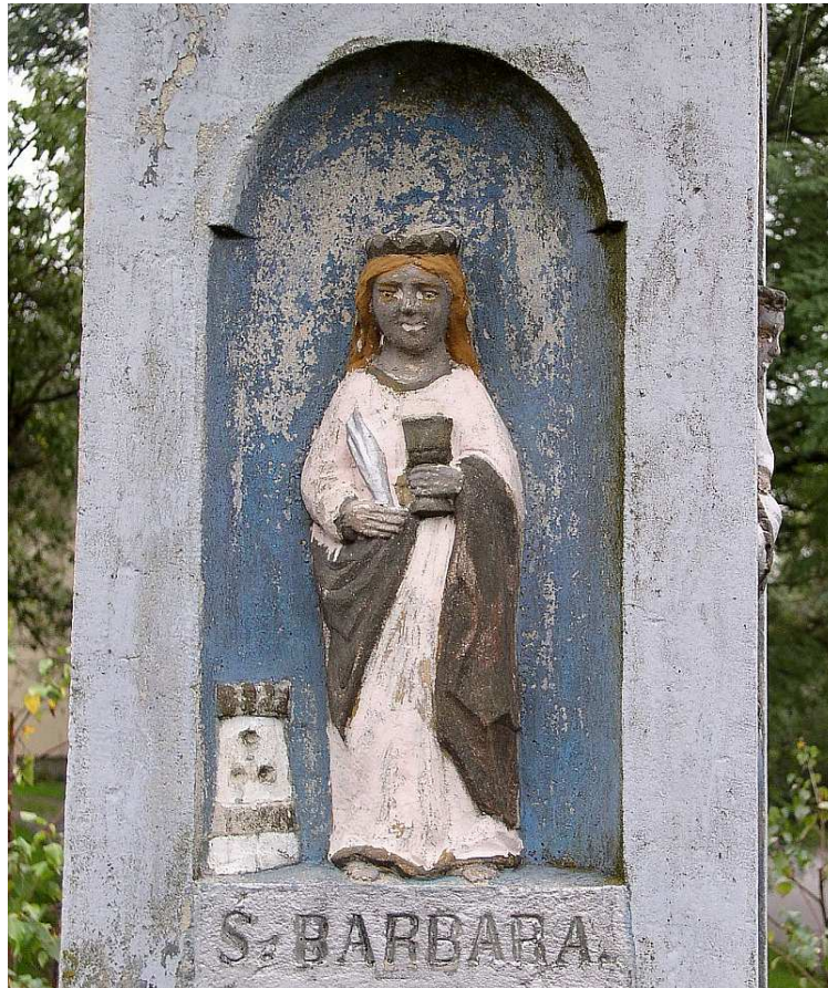
Fot. nr 28. Figura św. Barbary z niszy lewego boku kapliczki.