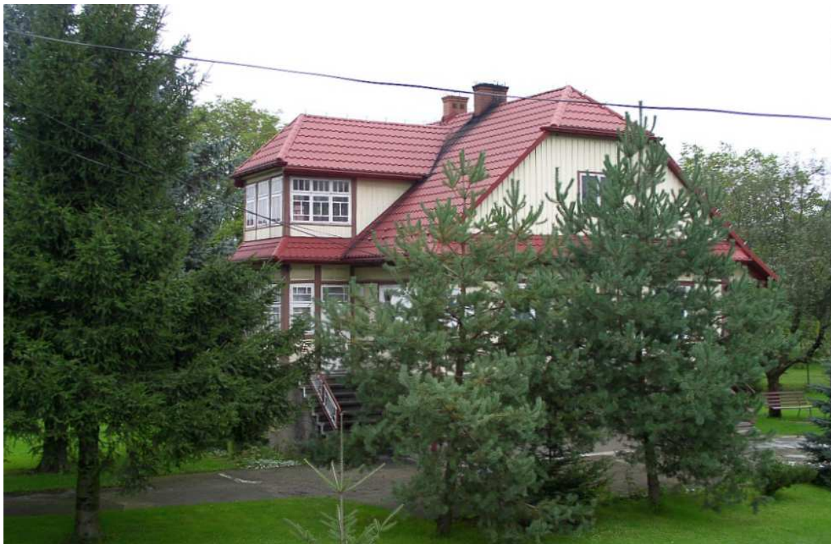
Fot. nr 12. Kolejna efektowna willa z ulicy Mostowej (nr 3), podobna do poprzedniczki.