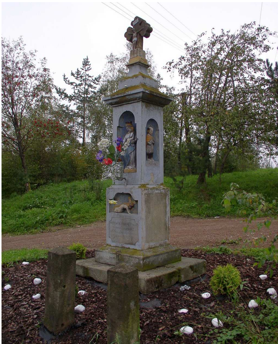
Fot. nr 4. Urokliwa kapliczka słupowa z przedmieścia Dobczyc – obiekt z ulicy Górskiej.

Na końcu wypada tylko zachęcić wszystkich, głównie krakowian, do częstszych wycieczek do Dobczyc i ich okolic, gdzie każdy znajdzie dla siebie coś ciekawego. Samo miasteczko jest bardzo zadbane; widać na nim dobrą, gospodarską rękę miejscowych władz, a i różnych rarytasów: cukierniczych czy wędliniarskich jest tu pełny, a na dodatek zróżnicowany wybór.