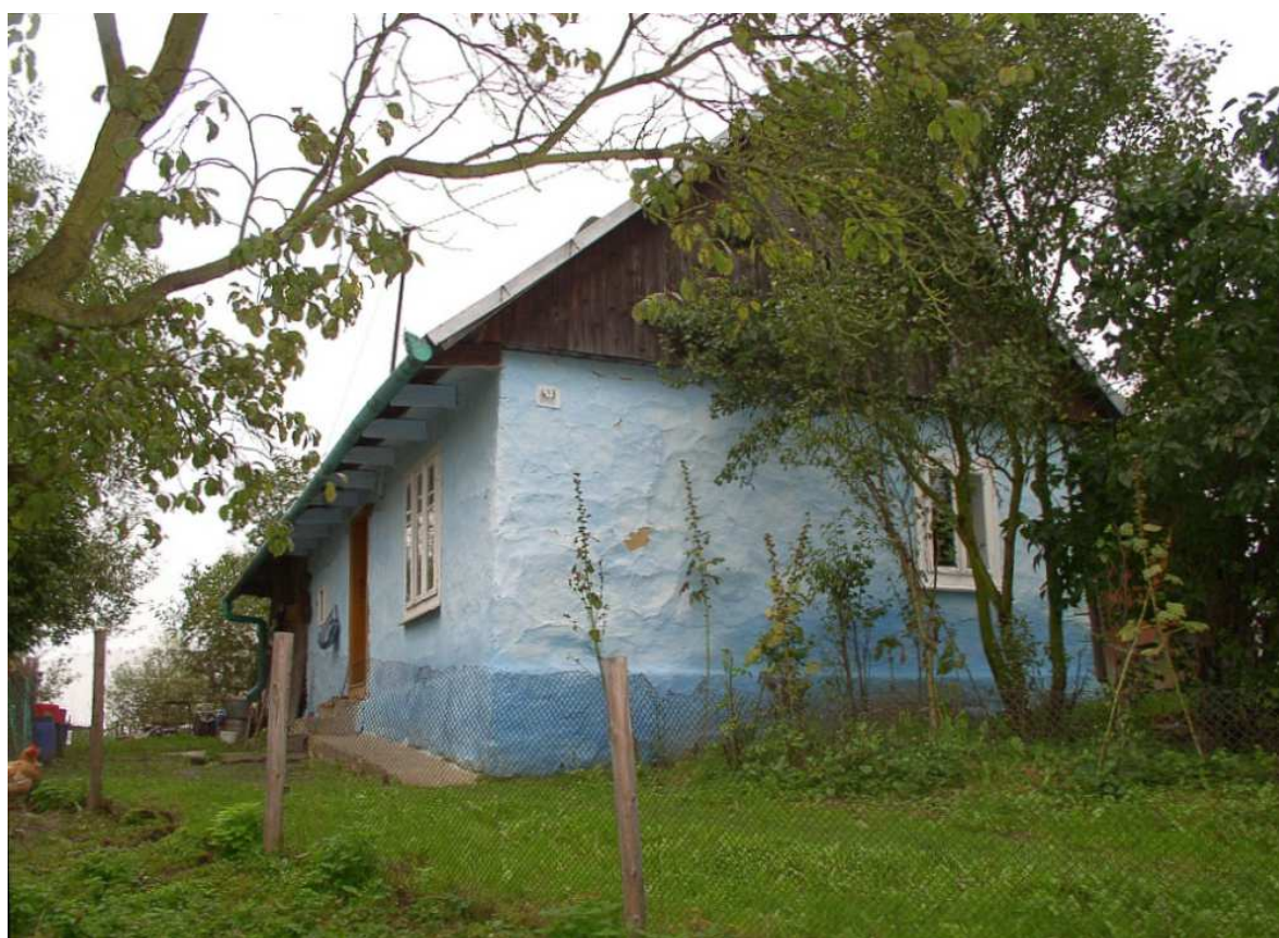
Fot. nr 47 (47-50). Kolejny przykład w pełni oryginalnej, wiekowej chałupy z ulicy Dębowej 43 - obiekt z sąsiedztwa sklepu, który najpewniej już nie istnieje.