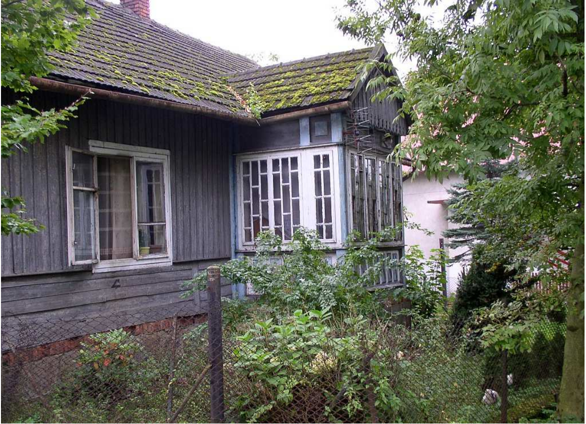
Fot. nr 52. Lewa strona domu z zasklonym gankiem pośrodku.