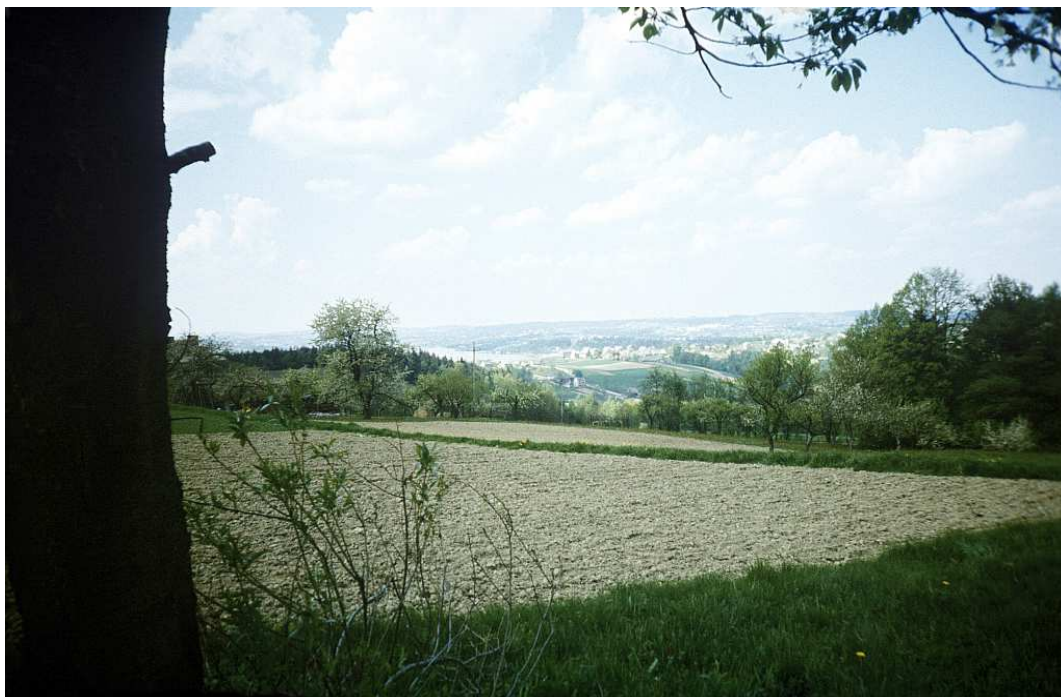
Fot. nr 62. Widok w stronę Raciechowic (wiosna 1991).