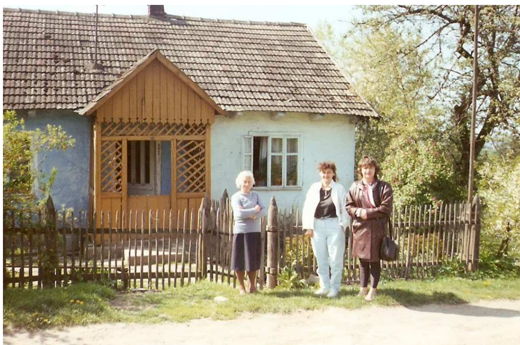
Fot. nr 71. Skan ze zdjęcia analogowego (czerwiec 1994).