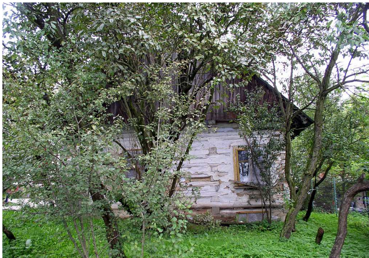
Fot. nr 35. Równie oryginalna, boczna ściana chaty.