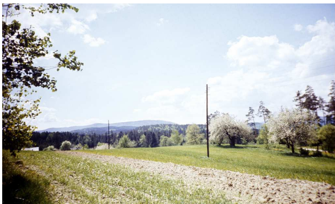
Fot. nr 75. (Wiosna 1991).