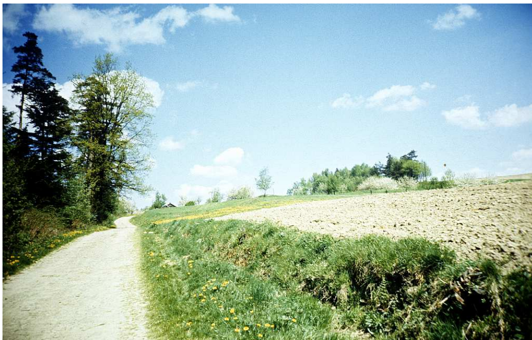
Fot. nr 64 (64-79). Wiosenne krajobrazy z przysiółka Zalesie (wiosna 1991).