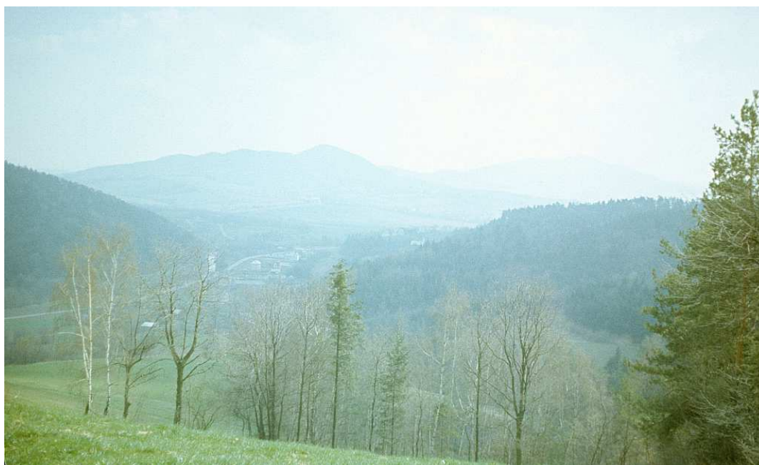
Fot. nr 83 (83-84). Grodzisko ponad doliną Czaławia (wiosna 1992).