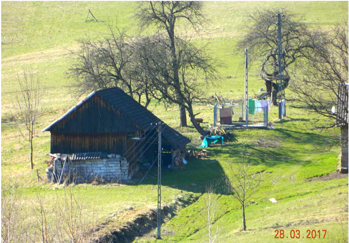
Fot. nr 94.