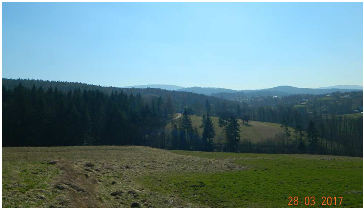
Fot. nr 90 (90-91). Widoki ze skraju lasu w przysiółku Syberia. Tu w stronę Zasania i Trzemeśni.