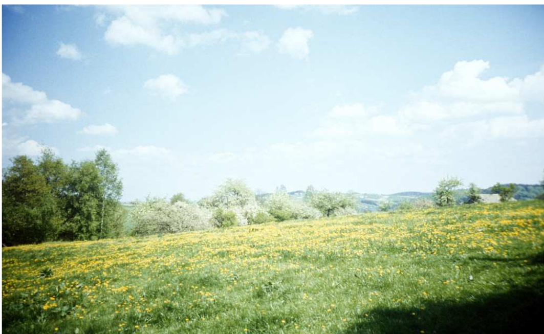
Fot. nr 65. (Wiosna 1991).