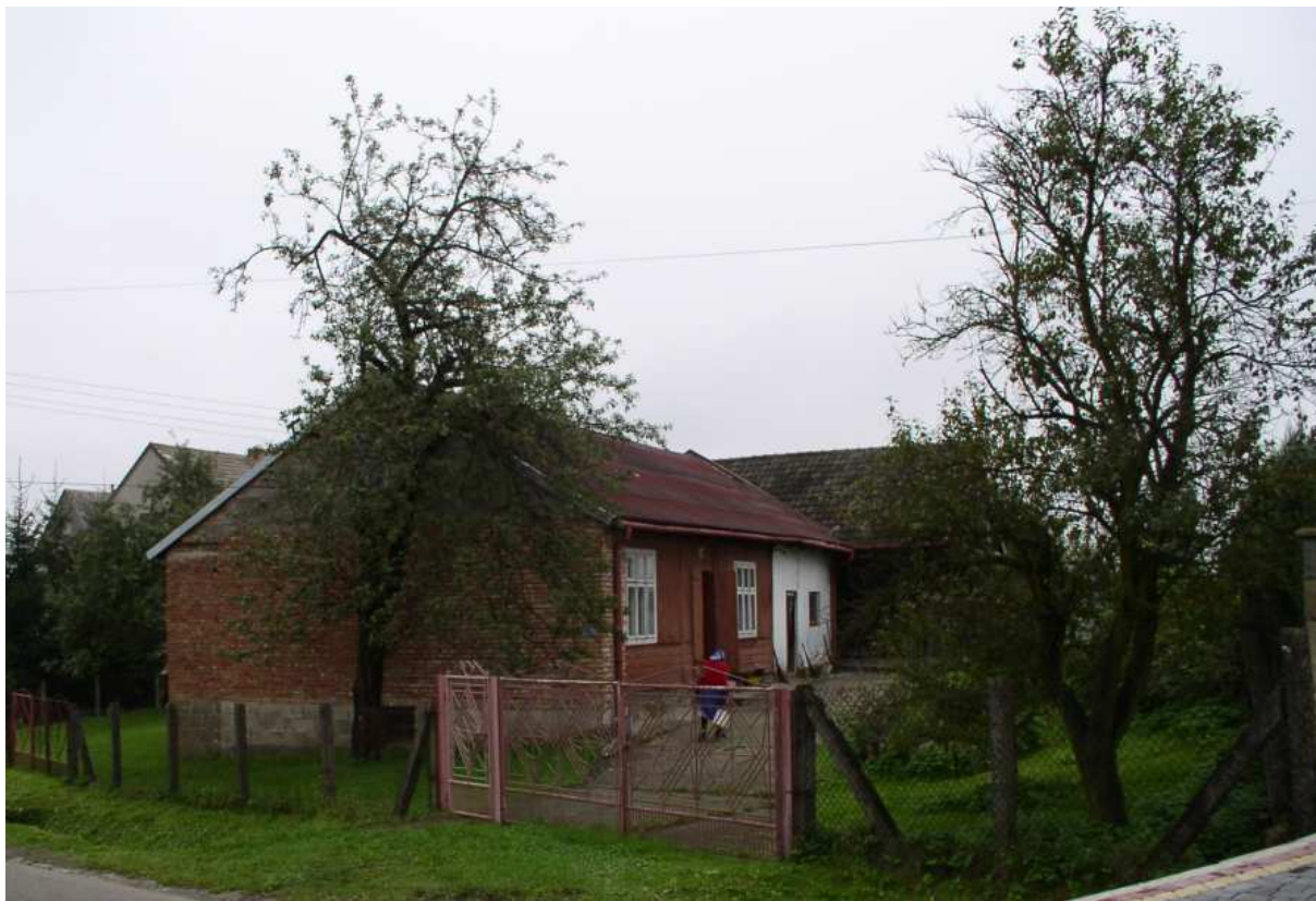
Fot. nr 30. Zagroda z początku ulicy Dębowej (nr 16), zapewne z okolic poł. XX wieku.