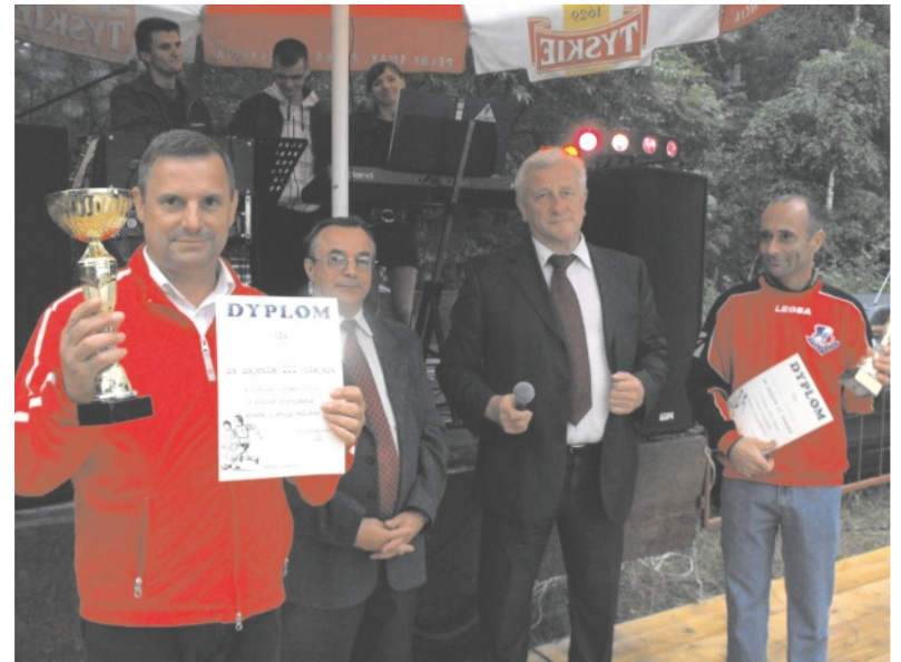
Choć złoto zgarnęli goście nasi i tak się cieszyli