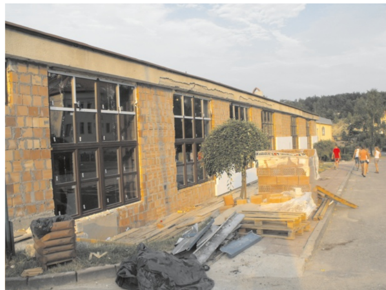
Nowe okna sali lustrzanej dadzą się otworzyć