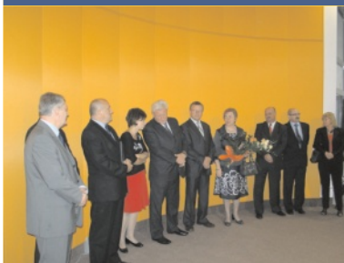
Święto Policji - str. 2.