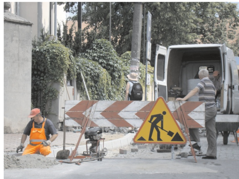
Na Kościelnej są już nowe krawężniki

W mieście i w sołectwach naszej gminy trawa obecnie wiele mniejszych robót drogowych. Drogowcy z MZGKiM obecnie działają w rejonie ul. Sadowej (gdzie niełatwo pogodzić istniejący stan ogrodzeń okolicznych posesji z prawidłowym wypoziomowaniem chodników i jezdni), ul. Kościelnej, gdzie wymieniono już krawężniki, a wkrótce ruszy remont nawierzchni, trwają prace przy "schetynówce" i w innych miejscach. Wszystkie te roboty trochę utrudniają poruszanie się po centrum (będzie jeszcze gorzej), ale w efekcie miasto i okolice doczekają się poprawy stanu najważniejszych ciągów komunikacyjnych. Oby tylko pogoda nadal dopisywała i budżet wytrzymał – niestety decyzje o udziale w kolejnych remontach nie są łatwe, bowiem okazało się, że dużo więcej pieniędzy niż wcześniej planowano burmistrz będzie musiał przeznaczyć także na remonty przeciekających dachów na budynkach komunalnych i placówkach oświatowych w całej gminie. Pomimo, że powódź nie dotknęła bezpośrednio naszych terenów, także nasza gmina odczuje jej skutki. Już dziś wiadomo, że władze wojewódzkie skierują znaczne środki finansowe w rejon popowodziowy, oszczędzając na pozostałych. W tym