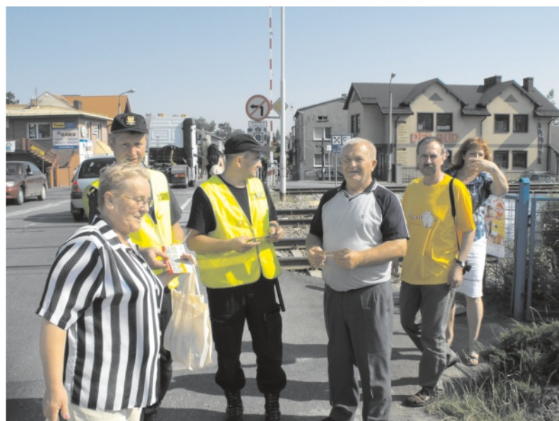
... jest w grupie najniebezpieczniejszych w kraju