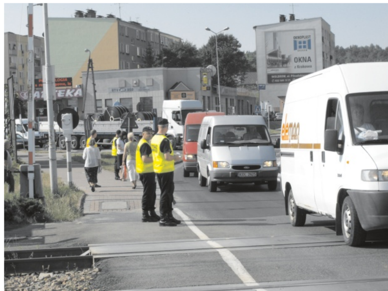
Wolbromski przejazd ma złą sławę...

- Kierowcy, stojąc przed zamkniętym szlabanem, często denerwują się, że muszą poczekać kilka lub kilkanaście minut. Dróżnik, który odpowiada za ludzkie życie, musi