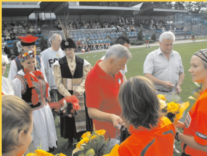
Czym chata bogata...