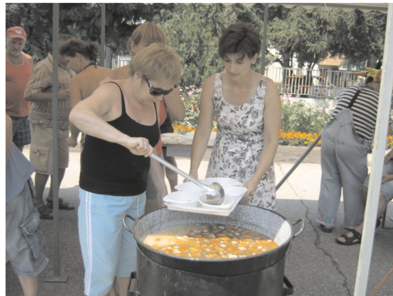
Polskie gospodynie dały radę nawet w tropikalnym upale!

Przygotowany przez wolbromską reprezentację żurek z jajkiem i kielbasą zrobił furorę wśród węgierskich smakoszy, a członkowie jury oceniający potrawy przygotowane przez wszystkich uczestników konkursu doceniło oryginalność nieznaną na Węgrzech zupy, przyznając jej specjalne wyróżnienie. Wolbromscy „kelnerzy” wydali ponad 200 porcji polskiego przysmaku, udzielając przy tym chętnie informacji na temat produktów