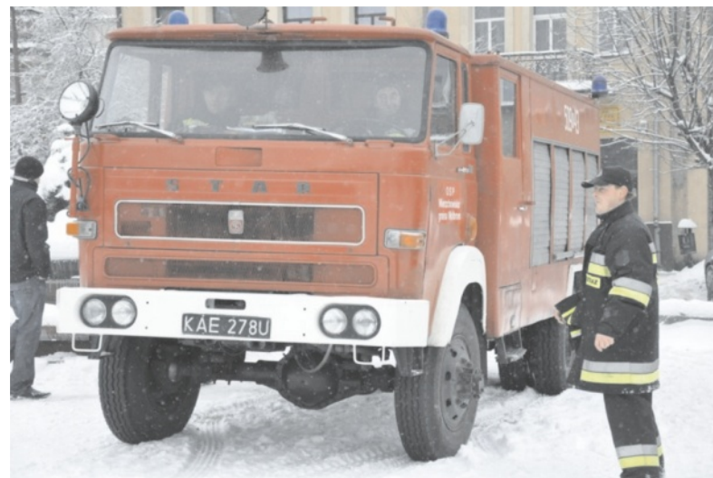
W zimie dowozili wodę do pozbawionych prądu gospodarstw

Tegoroczny konkurs jest kontynuacją pomocy udzielonej gminom w roku 2009. W ubiegłorocznej edycji, w ramach przekazanych na ten cel ponad 3 mln zł, prace remontowo-budowlane przeprowadzono w 83 remizach w Małopolsce. Wśród nich również znalazł się nasz projekt, dzięki któremu udało się dofinansować w kwocie 50 tys. zł remont remizy w Gołacz-