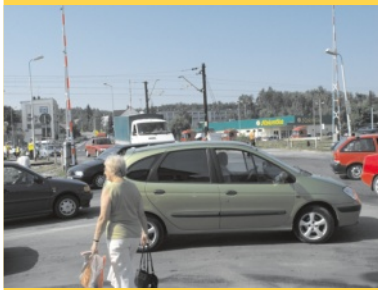
Ocal życie! Zatrzymaj się przed przejazdem! - str. 5.