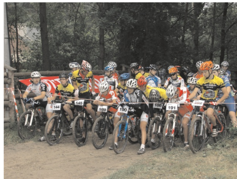
Za chwilę start

w wyścigu otrzymali nagrody, a zawodnicy licencjonowani - medale Mistrzostw Małopolski dla pierwszych trzech miejsc.