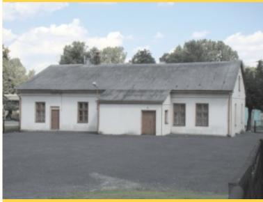
Mamy dofinansowanie remontu kolejnej remizy - str. 6.