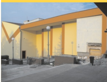
Centrum Kultury nabiera barw - str. 3.