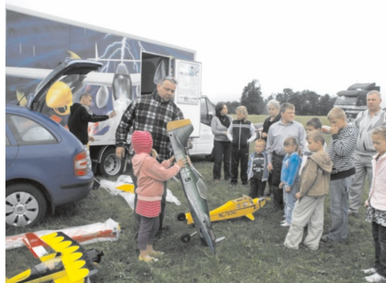
Tyle atrakcji się zmarnowało!

Jeszcze gorsze warunki pogodowe panowały podczas niedzielnej imprezy IX Dni Poręby Górnej. Zespoły muzyczne „Awans”, a później „Altonus” dwoiły się i troiły, aby przyciągnąć jak największą rzeszę ludzi. Chętnych do przyścia na miejsce imprezy i wspólnej zabawy było jednak naprawdę mało. Nie dziwi więc, że z powodu braku kandydatek nie odbyły się też wybory Miss Publiczności planowane w trzech kategoriach wiekowych. Zabawa taneczna przy muzyce zespołu „Concret” z Jędrzejowa, która