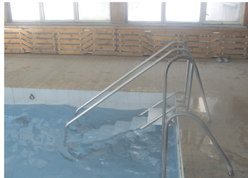
Teraz osoby mniej sprawne łatwiej wejdą do basenu

Zarząd Koła Polskiego Stowarzyszenia na Rzecz Osób z Upośledzeniem Umysłowym w Wolbromiu oraz Dyrekcja OREW w imieniu wychowanków Ośrodka Rehabilitacyjno-Edukacyjno-Wychowawczego składa serdeczne podziękowania wszystkim ofiarodawcom.