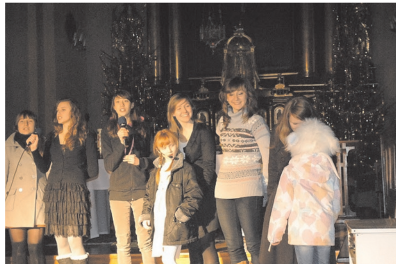
Kto dziś ma czas na takie przemyślenia?

W sztuce nie zabrakło odwołań do scen biblijnych. W kontekście zdrady, alkoholizmu, aborcji młodzi artyści pokazali przykład Maryi i Józefa, którzy żyli w bardzo trudnych czasach, a nie poddali się i dzięki moc-