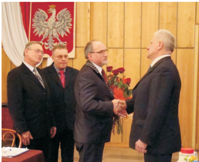
Minął czas gratulacji, nastał okres wytężonej pracy

ty odcinków dróg wojewódzkich biegnących przez naszą gminę: Olkusz-Wolbrom-Miechów, Strzegowa-Wolbrom, Wolbrom-Zielonki, budowa nowych chodników. Są plany budowy sali gimnastycznej przy Zespole Szkół, do których powiat chce wrócić, po pierwszym nieudanym podejściu i oczekuje od nas jeszcze większego zaangażowania finansowego niż pierwotnie. Rozumiemy potrzeby i podtrzymujemy ci g dalszy na str. 5.