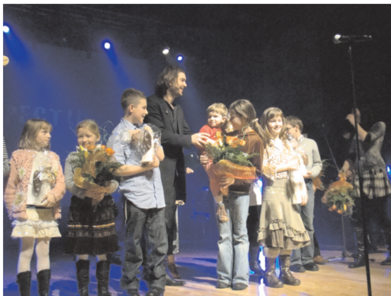
Podziękowaniem za koncert były ciepłe słowa, kwiaty i symboliczne anioły