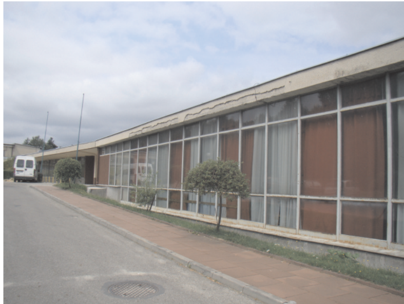
Dwa oblicza Centrum Kultury