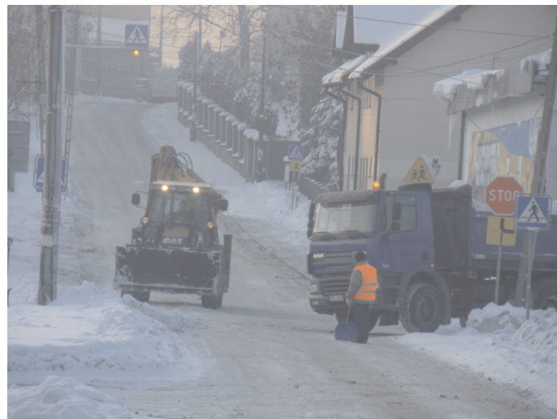
Na razie zima w odwrocie, ale wywiezienie nadmiaru śniegu z centrum miasta w pewnym momencie było niezbędne