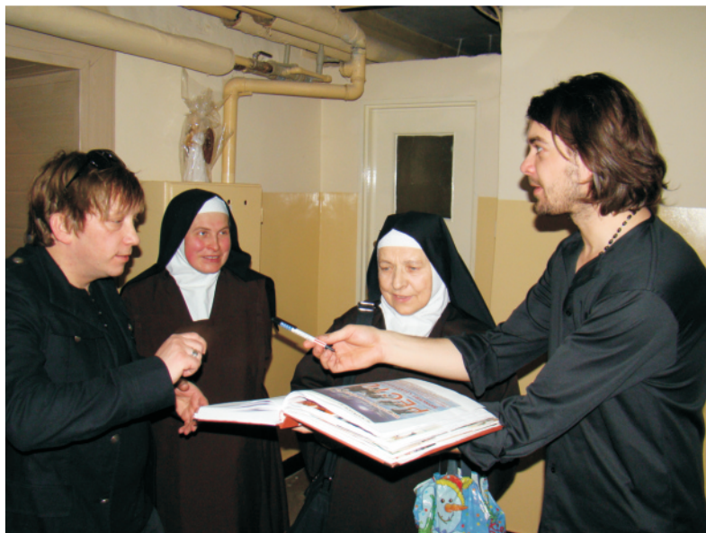
Jeszcze tylko pamiątkowy wpis do kroniki Ochronki!

Siostry z wielkim zaangażowaniem opiekuj si dzie mi, które maj trudniejsze ni rówie nicy dzieci stwo, zagospodarowuj c im czas wolny w sposób po yteczny i bezpieczny. Podczas codziennych zaj dzieci korzystaj z opieki, wywienia, zaj ruchowych, wietlicowych oraz mog w spokoju i - je eli jest taka potrzeba - z pomoc odrobi lekcje. W ci gu roku szkolnego Ochronka daje schronienie dzieciom po szkole do godzin wieczornych. Podczas ferii i wakacji dla podopiecznych organizowane s wyjazdy na wypoczynek. Działalno Ochronki jest chary-