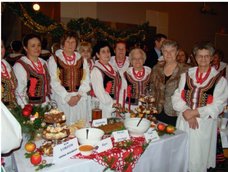
KGW z Łobzowa