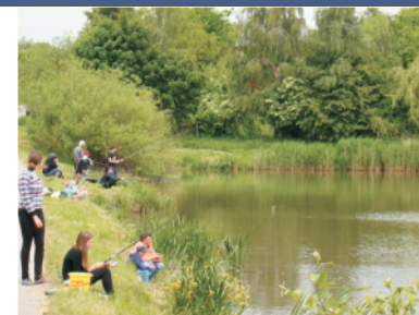
Wędkarze - dzieciom - str. 3.

szą o kierowców o rozsądne ustawianie samochodów wzdłuż ul. Kościuszki, którą prowadzony jest objazd ul. Nowej. Kierowcy korzystający z pobliskiej piekarni często wręcz tarasują przejazd, co powoduje korki i poważne zagrożenie kolizyjną, zwłaszcza, gdy na wąskim pasie ruchu mijają się duże ciężarówki.