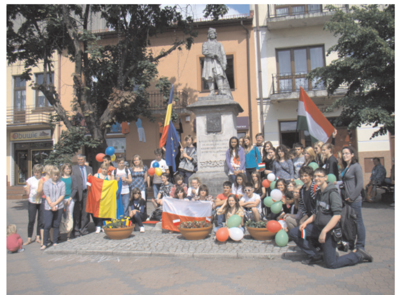
Na pamiątkę pobytu w Wolbromiu młodzież węgierska, rumuńska i polska posadziła w rynku kwiaty w barwach swoich flag narodowych

przedpołudnie w Domu Kultury widać było, że cel został osiągnięty. Dorosli opiekunowie i uczestniczący w wymianie uczniowie nie kryli wzruszenia podczas prezentacji wspólnie przygotowanego przedstawienia opartego na wątkach legend z trzech krajów. Nie obyło się też bez wylewnych podziękowań za aktywne uczestnictwo wolontariuszy – nauczycieli G3, a także wszelką pomoc i współpracę instytucji oraz osób wspierających projekt. W wymianie realizowanej przez G3 brało udział 58 młodych ludzi z Polski, Rumunii oraz Węgier w wieku 13-18 lat, którzy wyruszyli „Tropem legend” ku historii powstania Europy, swoich krajów i miejscowości oraz dawnych stolic. Bazą noclegową dla grupy były Domaniewice koło Wolbromia, gdzie zakwaterowani zostali wszyscy uczestnicy projektu (także dzieci polskie). Projekt był realizowany od 1 do 28 maja tego roku, młodzież z Rumunii i Węgier odwiedziła Wolbrom w dniach 21-28 maja. Środki na dofi-