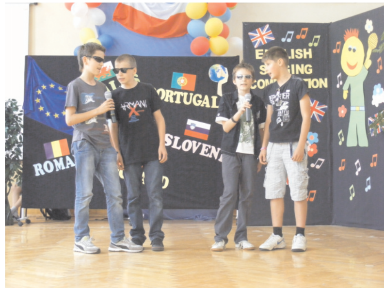
Dobra zabawa najlepszą platformą porozumienia międzynarodowego

W czasie spotkania roboczego nauczycieli młodzież zmagala się z torem przeszkód zorganizowanym na boisku szkolnym przez nauczycieli