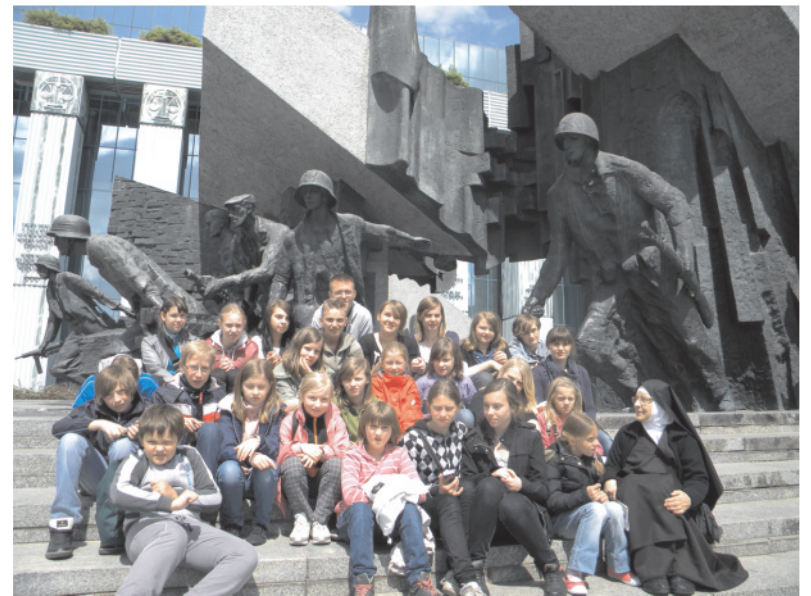
Dużym przeżyciem była dla dzieci wizyta w Muzeum Powstania Warszawskiego

Ukoronowaniem cyklu zajęć była dwudniowa wycieczka do Niepokalanowa i Warszawy, gdzie dzieci zwiedzały Muzeum i Panoramy Tysiąclecia w Niepokalanowie, wzięły udział w teatralnym przedstawieniu upamiętniającym Tysiąclecie Chrztu Polski w 1966 r. i zapoznały się z wszystkimi ważnymi dla Polski osobami począwszy od 966 roku po obecne czasy. W Warszawie zwiedziły Pałac Kultury i Sztuki, Pomnik Powstańców, Starówkę, Barbakan, pomnik małego powstańca, warszawską syrenkę, katedrę św. Jana, kolumnę Zygmunta, skąd podziwiała nowy stadion na Euro. W Zamku Królewskim w Warszawie zorganizowano dzieciom lekcje muzealne, gdzie nie tylko podziwiała piękne komnaty królewskie, ale poznały historie królów Polski i tradycje naszego narodu. Na koniec oglądały film o Zamku Królewskim i jego zburzeniu w czasie II wojny światowej. W Muzeum Powstania Warszawskiego dzieci oglądały doku-