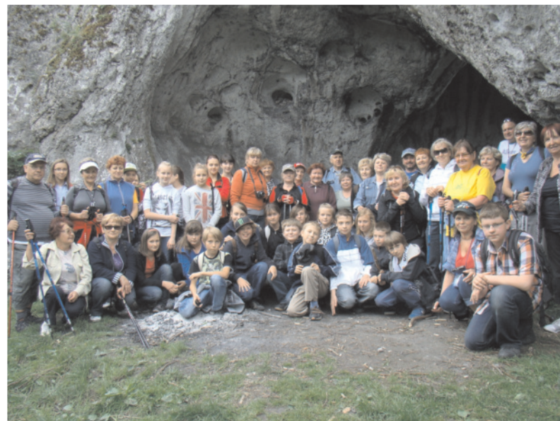
Piękna Dolina Wodącej zachęca do pieszych wędrowek i kontaktu z przyrodą Jury