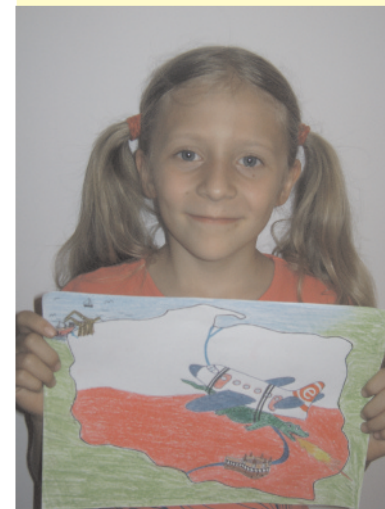
Wygrała lot dla klasy - str. 4.