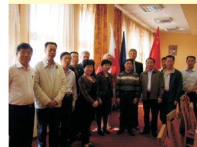
Chińczycy chcą nawiązać współpracę z Wolbromiem - str. 7.