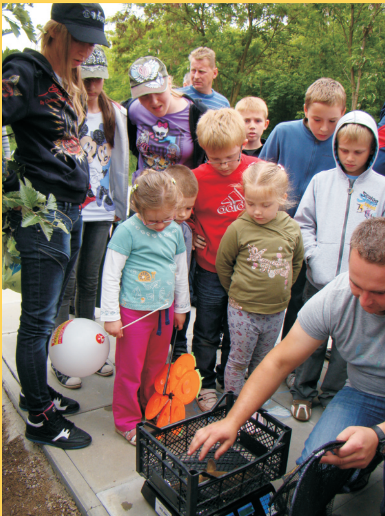
Zważono nawet najmniejszą rybkę :)

Z pewnością nie udałoby się przygotować tylu nagród i prezentów dla małych wędkarzy, gdyby nie tradycyjna już hojność sponsorów, którym tą drogą ser-