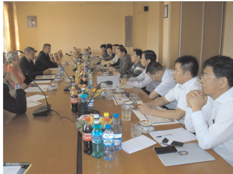
Przedstawiciele chińskiego Hengyang zaproponowali władzom Wolbromia podpisanie umowy partnerskiej