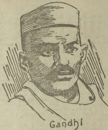
Ilustracja nasza przedstawia przywódcę nacyonalistów indyjskich Gandhiego, o którym piszemy w dzisiejszym feljetonie.

by na zasadzie zapewnionej mu ochrony i nieusuwalności stawiać zamierzonej budowie nowych pomieszczeń mieszkalnych.