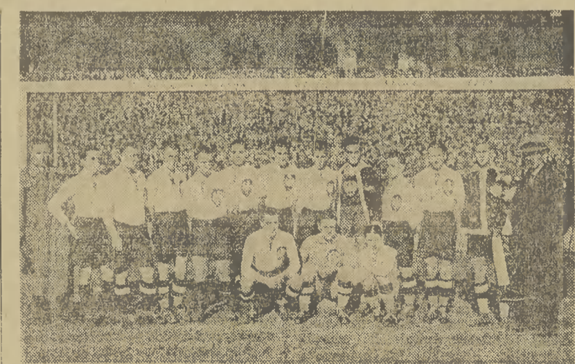
Reprezentacja piłkarska Polski przed meczem ze Szwecją w Sztokholmie