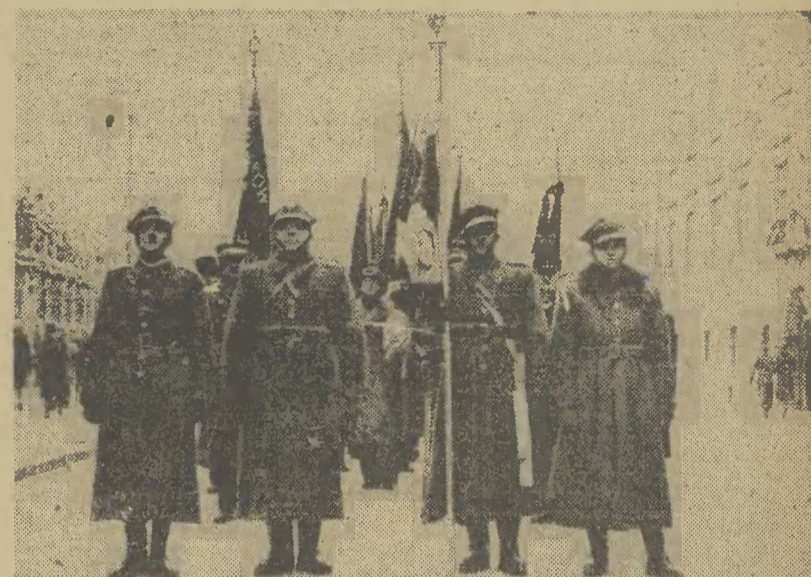
Niedawno odbył się w Krakowie Zjazd Uczestników Woj. Związku Walki Zbrojnej o Niepodległość i Demokrację. Na zdjęciu: poczty sztandarowe

wkroczyły w 1939 roku wraz z armią niemiecką na ziemie polskie dowiedział się dopiero z prasy i radia (I). Ks. Tiso oświadczył, że wojna przeciwko ZSRR wśród narodu słowackiego była niepopularna. Formalne i