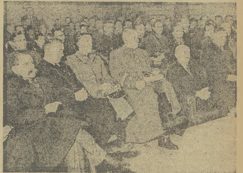
Wiec stronnictw Bloku Demokratycznego w Krakowie

Od jutra rozpoczynamy druk powieści Liona Feuchtwangera p. t.: „SIMONA”