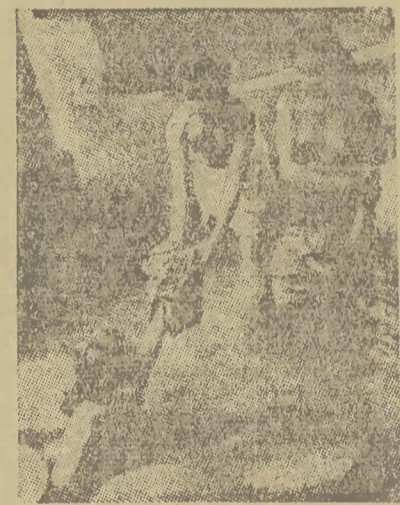
Kapiec na Bali

Bali — piękna wysepka koło Indii, pełna egzotycznego czaru i powabu, posiadająca wyjątkowo pięknych i zgrabnych mieszkańców, zwłaszcza kobiety, cieszy się wielką popularnością wśród podróżników, pragnących poznać jej