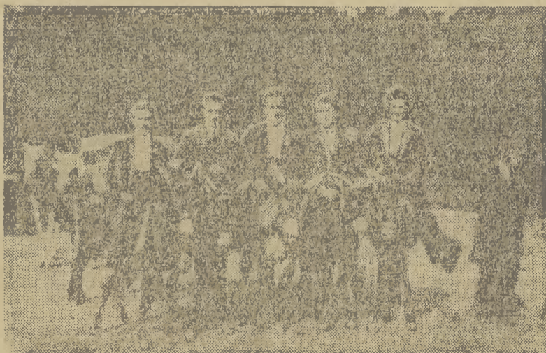
Nasi dobrzy znajomi zażywają przejażdżki na osiołkach

Na drugi dzień graliśmy zawody Kraków — Konstantynopol. Wobec