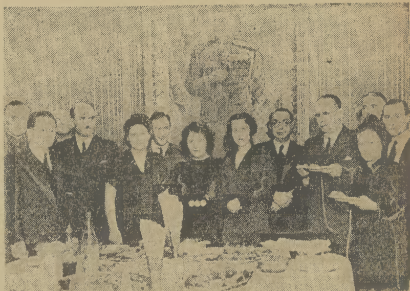
W dniu urodzin Generalissimo Stalina nastąpiło uroczyste otwarcie konsulatu ZSRR w Krakowie. Na zdjęciu konsul z małżonką w otoczeniu gości.

Prezydent Bierut otrzymał następujący meldunek: Dotychczas wykonano plan tegoroczny produkcji cukru w 120%. Planowano przerób 2.210.000 ton buraków oraz produkcję 287.300 ton cukru. Przerobiono już 2.860.000 ton buraków, wyprodukowano 346.000 ton cukru. Odbiór buraków oraz produkcja cukru trwa i osiągnie przypuszczalnie ponad 370.000 ton, czyli przewyższy produkcję cukru Polski w piątym roku po pierwszej wojnie światowej.