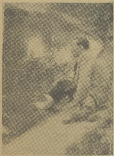
STRUZZONY wędrowiec z prowincji, zmęczony miastem muzeów, moczy nogi w sadzawce na Plantach.