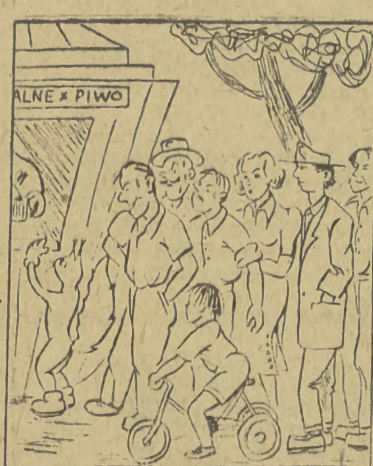
Proszę duże słodowe.