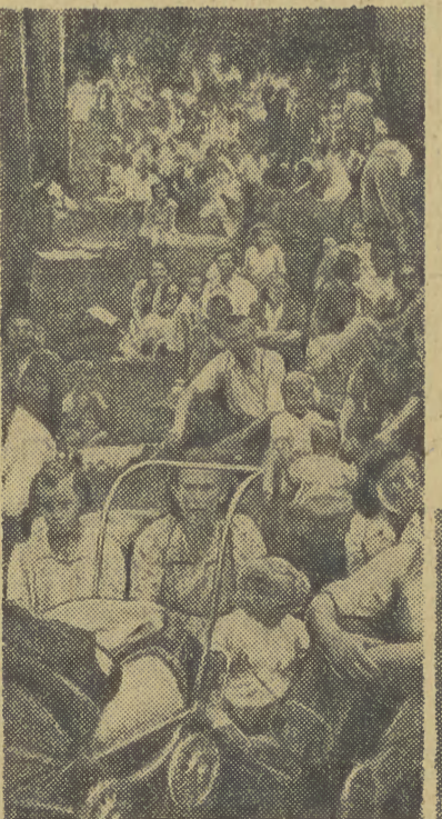
Jak na wszystkich naszych wczasach nie brak było „rodzinnych” obozów, porożkanych w szerokim promieniu na wrocznej polanie w Łasku Wolskim.

Z ACZAŁEM przypieszać kroku. Tempo budowy zmienia nie tylko wygląd naszych miast — zmienia ludzi. Z dawnych, przygaszonych niepewnością jutra, drobnych rolników, walczących bez chwili wytchnienia z wyżyskiwaczem, kryzysem, nędzą — zmieniamy się w armie twardych, świadomych swych sił, ofiarnych proletariusz, dla któ-