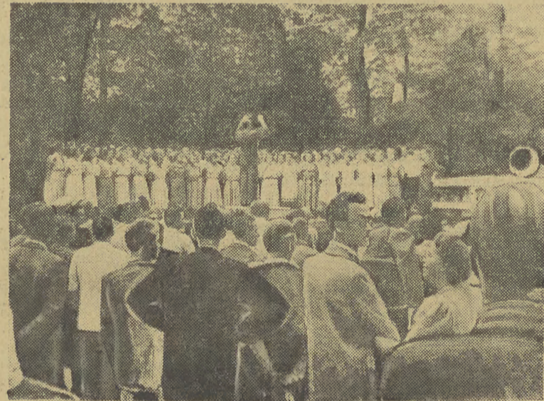
Największą atrakcją części artystycznej był społeczny występ doskonałego 100-osobowego Chóru Państwowej Filharmonii w Krakowie pod dyrekcją Stefana Żulawy.

Ponad 5 tysięcy krakowian zebrało się w ubiegłą niedzielę na polanie w pobliżu Skal Panieńskich, gdzie odbyły się szóstki z kole; wczasy świąteczne.