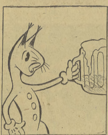
A to co? Pół kufła piwa, pół piany!