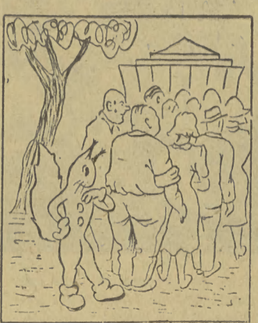
Stane jeszcze raz w kolejce i płacąc za dwa otrzymam w efekcie jeden pełny kufel.