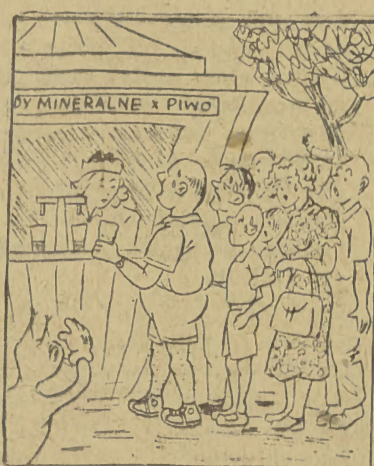
Nareszcie ugasać pragnienie! Warto nawet postać w kolejce, by otrzymać kufel piwa.