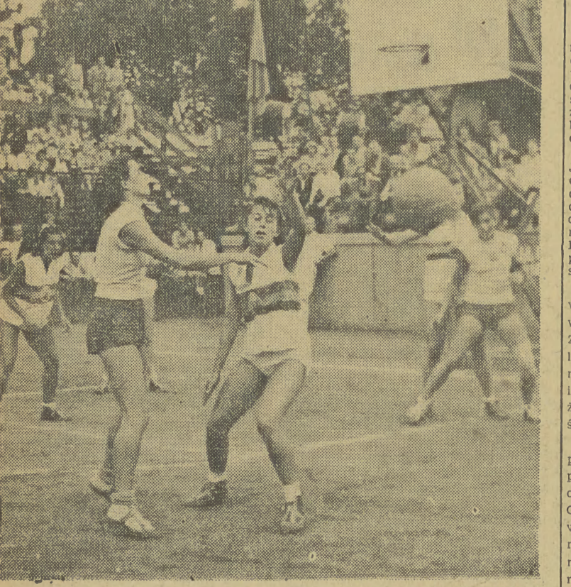
Na zdjęciu fragment meczu koszykarskiego z reprezentacją Rumunii, w którym nasze koszykarki wygrały 22:18.

...juniorom Krakowa za przesłanie pozdrowienia z Ogólnopolskich Mistrzostw Tenisowych Juniorów w Zabrzu.