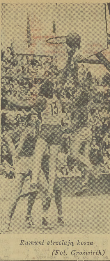
Rumuni strzelają kosza