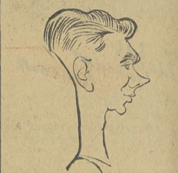
Mc Nally — Irlandia waga kogucia