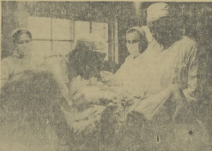
W szpitalu PCK podczas operacji.

Mimo cienkich ścian koreańskich chat wewnątrz jest ciepło i przytulnie nawet w trzaskające mrozy,