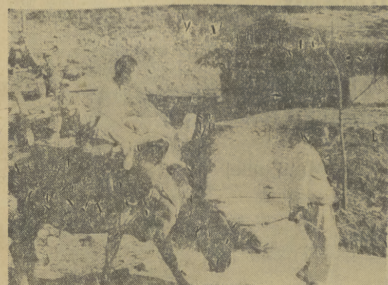
Z pomocy lekarzy polskich korzystała również i koreańska ludność cywilna. Ranny ze złamaną nogą, któremu założono opatrunek gipsowy, wraca do domu.