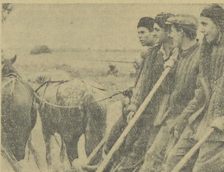
Pionierzy z Koczala jadą do pracy w polu.

Zakwaterowano ich w gospodarstwie Licheń. 36 osób to dużo — to o 11 pionierów więcej niż w Koczale, więc i efekty pracy powinny być bardziej widoczne. Tymczasem w Liche-