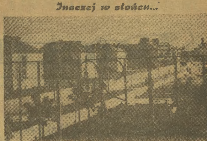
Inaczej w słońcu...

Na szczęście badania można było przeprowadzić w tamtejszej szkole dzięki jej kierownikowi, w przeciwnym bowiem razie cała ta pożyteczna akcja mogła „spalić na panewce”. (d)