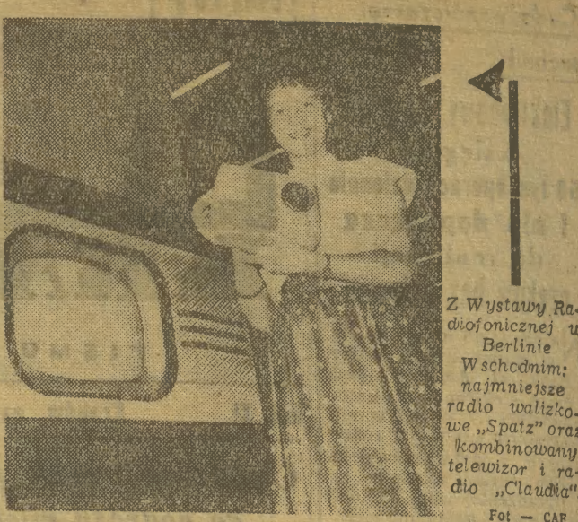
Z Wystawy Radiofonicznej w Berlinie Wschodnim; najmniejsze radio walizkowe „Spatz” oraz kombinowany telewizor i radio „Claudia”.

W ramach organizowanych w czasie wystawy „dni narodów” — Związek Radziecki zorganizuje występy swoich najlepszych zespołów artystycznych i weźmie udział w szeregu imprez sportowych. Budowa pawilonów radzieckich rozpocznie się w październiku br.