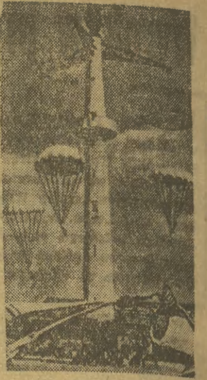
50 m wysokości ma wybudowana niedawno w Chinach i widoczna na zdjęciu wieża spadochronowa z żelazobetonu, z której może równocześnie korzystać kilku skoczków. Specjalny wyciąg wewnątrz wieży umożliwia zawodnikom szybki wyjazd do góry. (db)

Tak więc wbrew postanowieniom komisji, a przez kumoterstwo otrzymali mieszkania ludzie, którzy mieli gdzie mieszkać, a skrzywdzono tych, którym mieszkanie koniecznie jest potrzebne. (zw)