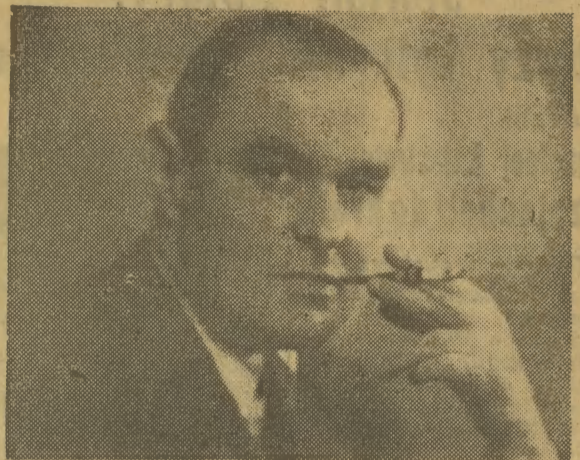
JERZY DE LAVEAUX