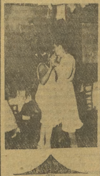
Zblazowani Yankesi przebywający w Atenach postanowili się zabawić urządając wielki bal, na którym obowiązuje strojem wieczorowym była koszula nocna...