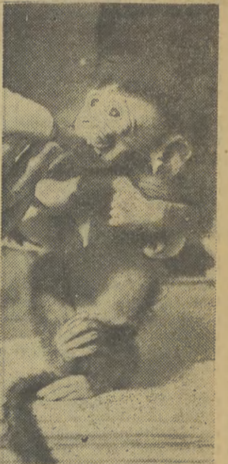
PRZYCHÓWEK WARSZAWSKIEGO ZOO Ta mała małpka ma zaledwie dwanaście dni.

Pewien pilot brytyjski, który wrócił z południowej Gujany poinformował, że ostatnio w ciągu doby około tysiąc mieszkańców zapada na te choroby.