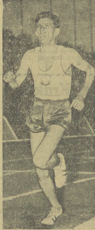
Zdzisław Krzyszkowiak który wczoraj w Sztokholmie wywalczył dla Polski tytuł mistrza Europy w biegu na 10.000 m.