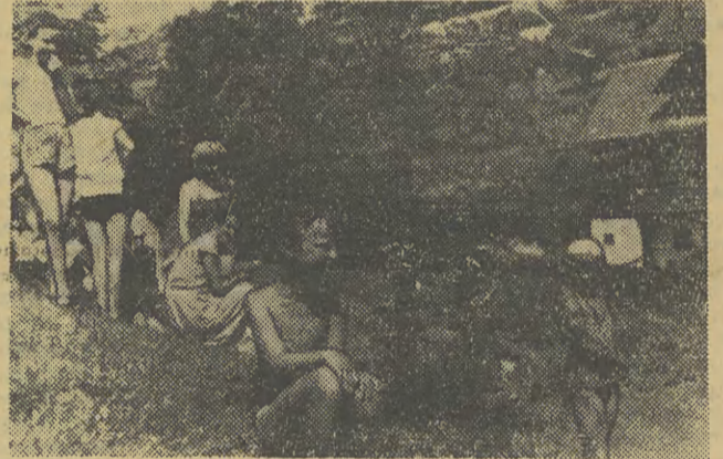
Na kolonii CPLiA w Krościenku.