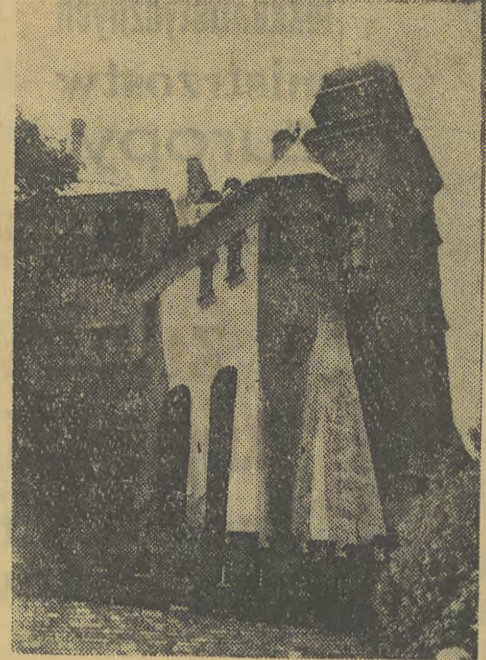
Zwiedzanie Wawelu to żelazny punkt programu każdej przybywającej do Krakowa wycieczki.

Staraniem Wydziału Oświaty Rady Narodowej m. Krakowa od 1 września zostaną oddane do użytku nowe szkoły podstawowe: na Bielanach, w Prądniku Białym, na Krzemionkach, przy ul. Bogatki (szkoła świecka) oraz w terminie nieco późniejszym — szkoła ogólnokształcąca w Prokocimiu.