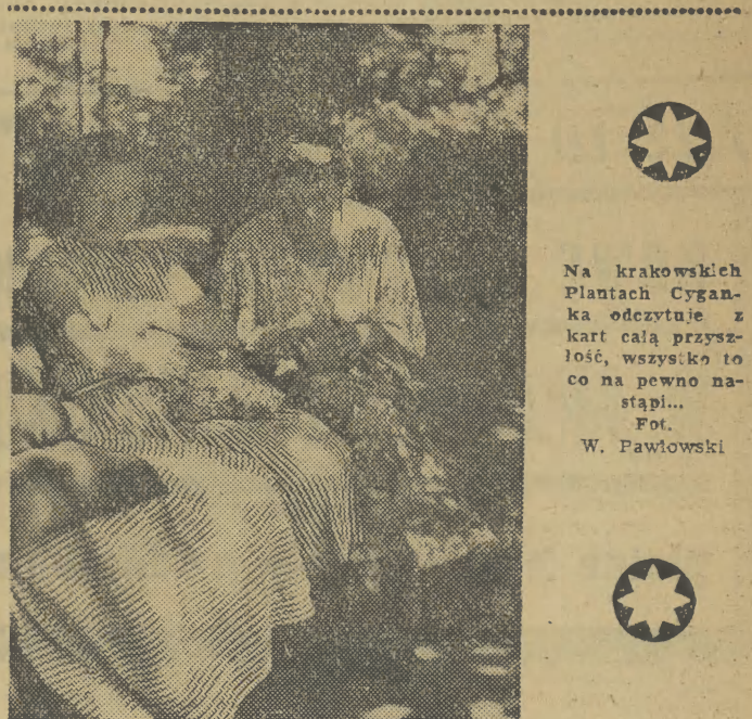
Na krakowskich Plantach Cytanka odczytuje z kart całą przyszłość, wszystko to co na pewno nastąpi...