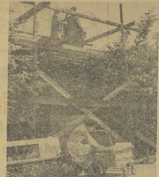
Wszystko wskazuje na to, że... Jadwiga i Jagiello poddani zostaną pewnym zabiegom kosmetycznym.

Wydział Architektury i Nadzoru Budowlanego Prezydium RN w m. Krakowie stwierdza, że w ostatnim czasie mnożą się fakty samowolnego umieszczania szyldów i wywieszek świetlnych firmowych i reklamowych bez zezwolenia władz budowlanych.