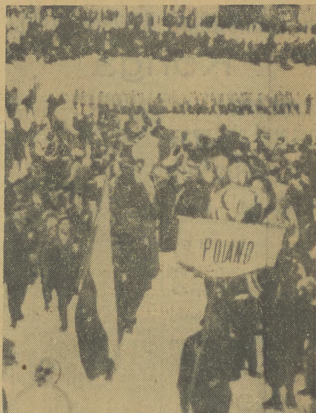
EKIPA POLSKA PODCZAS DEFILADY.