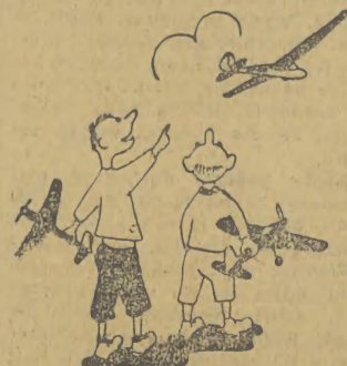
CZY ZNASZ SIĘ NA LOTNICTWIE?

Tak więc, w przypadkach wątpliwych, kobieta otrzymywałaby alimenty w wysokości ustalonej przez przepisy, a nie przez zarobki mężczyzny. W ten sposób — twierdzi uczony — można byłoby stworzyć warunki dla dochodzenia ojcostwa w stosunku do rzeczywistych ojców dzieci.