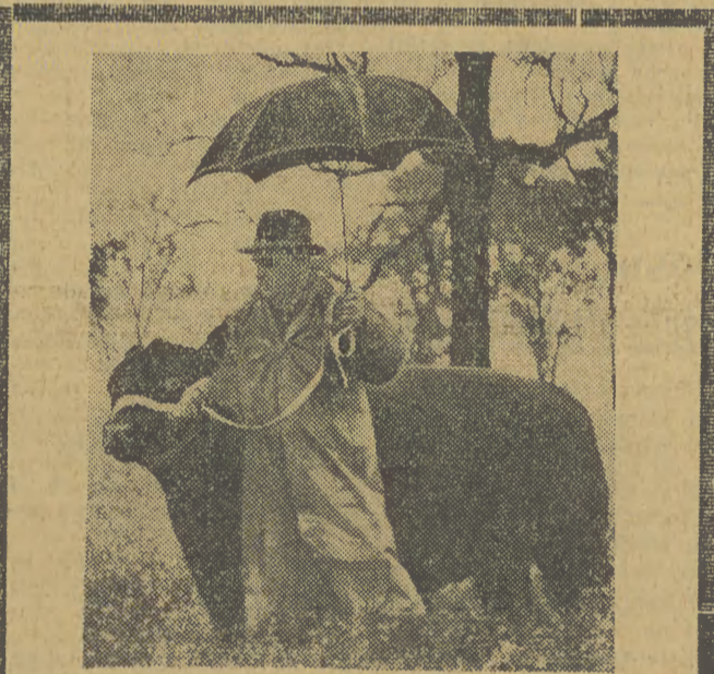
Mimo niezbyt pięknej pogody, taki weekendowy spacer z buhajem, będącym prawdziwą ozdobą obory, należy do stałych przyjemności tego pana. Zwierzę nazywa się Angus i zdobyło wiele nagród, przysparzając korzyści swemu angielskiemu właścicielowi. Buhaj jest przy tym niebywale łagodny i jak widzimy na zdjęciu — chętnie daje się wodzić na przechadzce. (db)

Na pewno więcej, niż wolnych mieszkań... (wl)