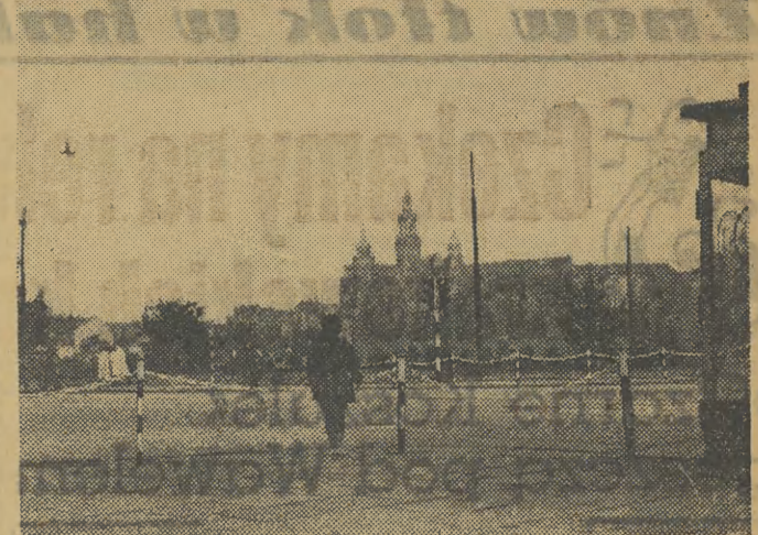
Dobrze się dzieje, że w ślad za zakładaną na rogach naszych ulic sygnalizacją świetlną otęsza się skrzyżowania białymi tańczuchami Zapobiega to w dużym stopniu samowoli w przechodzeniu jezdni przez niedyscyplinowanych krakowian. Na zdjęciu skrzyżowanie ulic: Zwierzynieckiej, Kościuskiej, Mostu Dębnickiego i al. Trześci Wieszczów.

Zarząd Oddziału ZBoWiD prosi o udział w zebraniach także b. więźniów będących jeszcze poza organizacją ZBoWiD-u. Oddzielnie zaproszenia na zebranie nie będą rozsyłane.