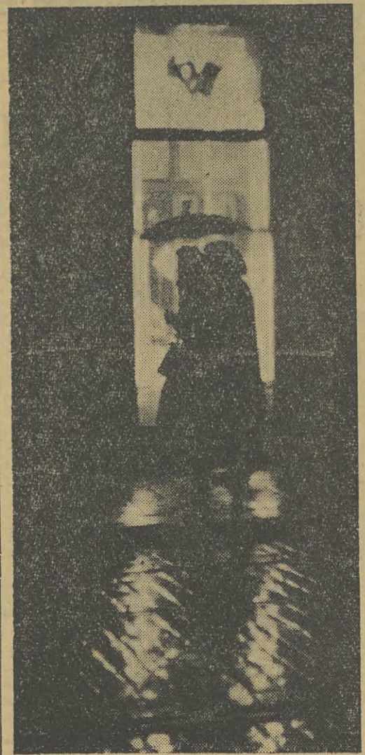
Pod parasolem nawet jesienny deszcz nie przeszkadza w spacerach ulicami Krakowa.

Wierście mi — lektura to nader interesująca, chociaż większość miejsca zajmują tu piętrzone tabele i zestawienia. Jedno nie ulega kwestii: żywienie — to nauka, nauka, którą należałoby jak najbardziej upowszechnić, jeśli chcemy jak najmniej mieć do czynienia z różnymi chorobami i jak najdłużej zachować cen-