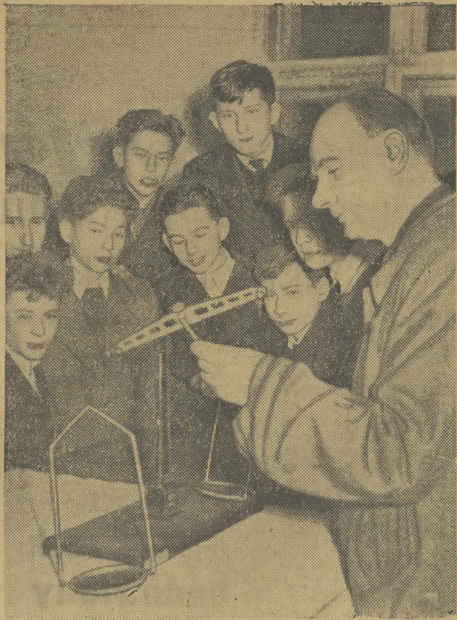
Fot. J. Lewicki