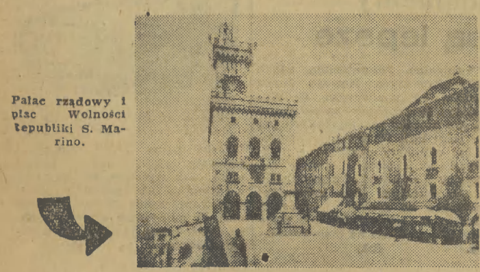
Pałac rządowy i plac Wolności republiki S. Marino.