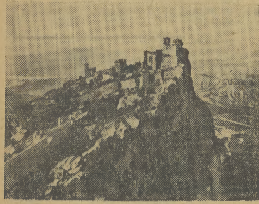
Panorama S. Marino.