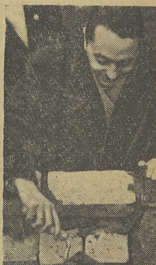
W tym samym dniu wmurowano kamień węgielny pod drugi Dom Nauczyciela, który stanie przy ul. Podgórskiej. W pobliżu buduje się również nową szkołę dla dzielnicy Podgórze.