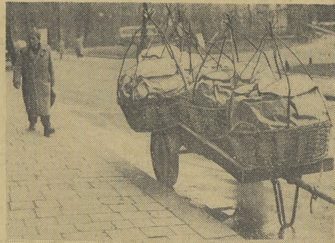
Co przewozi się w takich — jak to widać na zdjęciu — koszach — ostrygi, kraby, żółte, czy też jeszcze coś innego? Kwiaty proszę państwa, kwiaty do krakowskich kwiatni. A ten daszek z patyków nad nimi ma chronić krusze todygi podczas transportu.

Podajemy przykład: MPRB nr 2 w roku 1958 było przedsiębiorstwem poważnie deficytowym. Obecnie w ciągu trzech kwartałów br. wykazało ono już 800 tys. zł. czystego zysku. (paw)