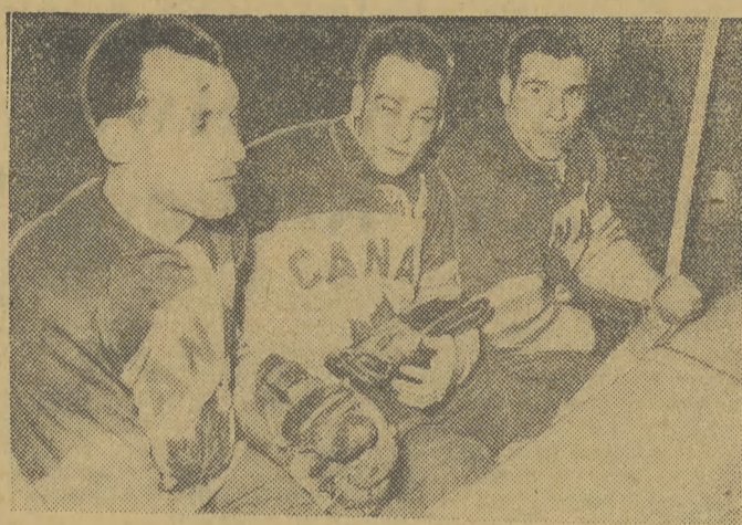
...chwila odpoczynku w boksie.

Na jesieni br. nazwisko Pesser ponownie pojawiło się w składach ligowych zespołów wiedeńskich. Chodzi tu jednak o syna przedwojennego mistrza, któremu fachowcy przypisują większą karierę od ojcowiskiej.