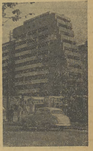
Nawet na peryferie wkracza w Jugosławii nowoczesna architektura.

Tym bardziej, jeśli w kieszeni ma się już bilet autobusowy do Zagrzebia, zdobyty zresztą z trudnością, gdyż z początku trudno się tu „połapać” w konkurencyjnych firmach autobusowych, pracujących na wspólnym dworcu. Do Zagrzebia jadę sławną autostradą „Braterstwo - Jedność”, budowaną szereg lat przez młodzież.