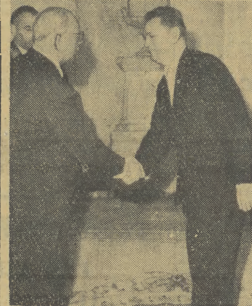
2 bm. ambasador nadzwyczajny i pełnomocny PRL w Związku Radzieckim, Bolesław Jaszczuk złożył listy uwiarytelniające na ręce przewodniczącego Prezydium Rady Najwyższej ZSRR, K. J. Woroszyłowa.

Eisenhower powróci do Waszyngtonu w dniu 23 grudnia.