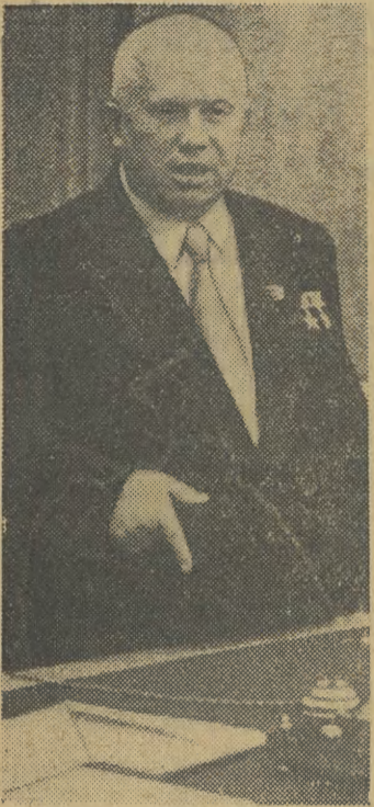
Urodzony 17 kwietnia 1894 roku we wsi Kalinowska w obwodzie kurskim, Nikita Sergejewicz Chruszczow — przewodniczący

Rady Ministrów ZSRR i I sekretarz KC Komunistycznej Partii Związku Radzieckiego — od wczesnej młodości związał się z ruchem rewolucyjnym. Pochodząc z biednej rodziny chłopskiej, już jako kilkunastoletni chłopiec zaczyna pracę jako uczeń ślusarski w Donbasie. W 1918 roku wstępuje do partii komunistycznej. W latach wojny domowej znajduje się w szeregach Armii Radzieckiej na południowym froncie. Po wojnie wraca do pracy w Donbasie, a w 1929 r. — pełniąc zresztą w tym czasie szereg funkcji partyjnych — rozpoczyna studia w Akademii Przemysłowej w Moskwie.