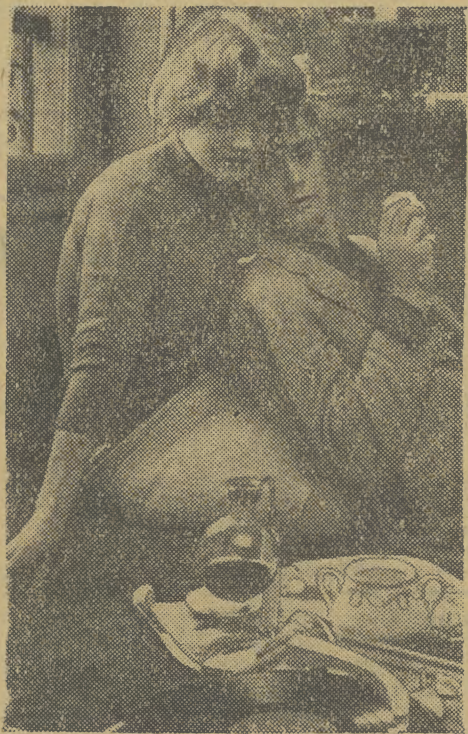
Romy Schneider, 20-letnia gwiazda niemieckiego filmu ogłosiła już oficjalnie swoje zaręczyny z 23-letnim Alainem Delonem...